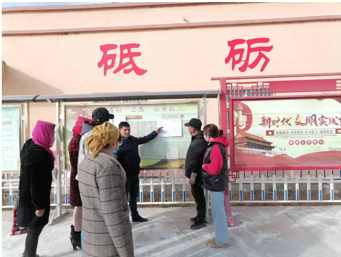
塔什库尔干乡瓦尔希迭村