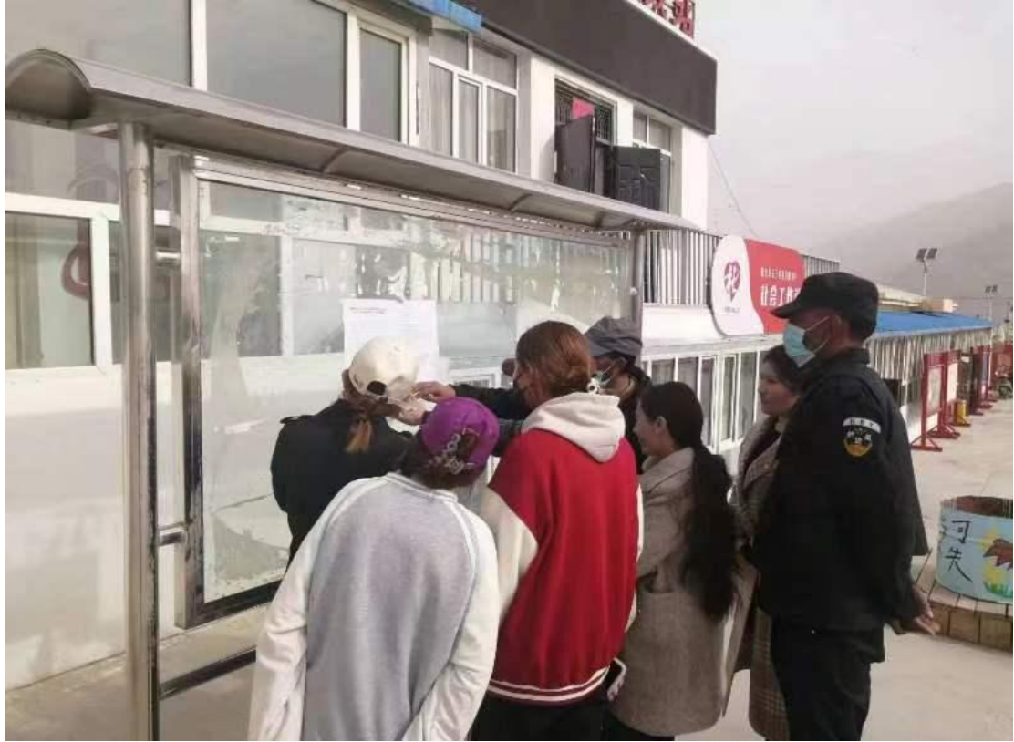
提孜那甫乡栏杆村