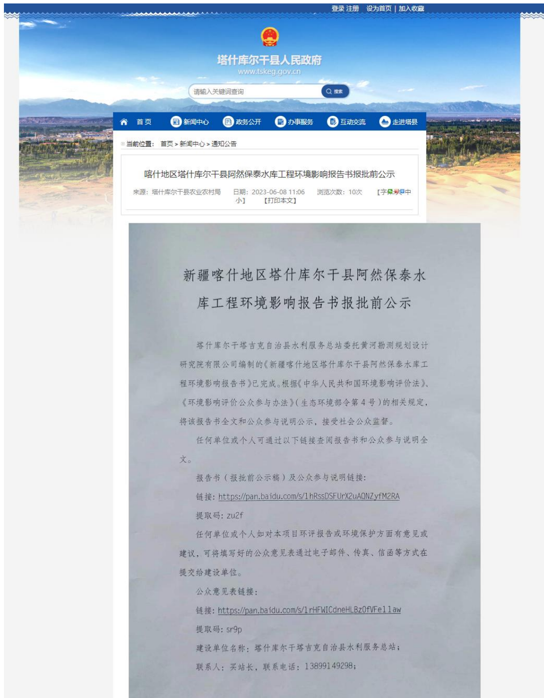
图 5-1 项目报批前网上公示