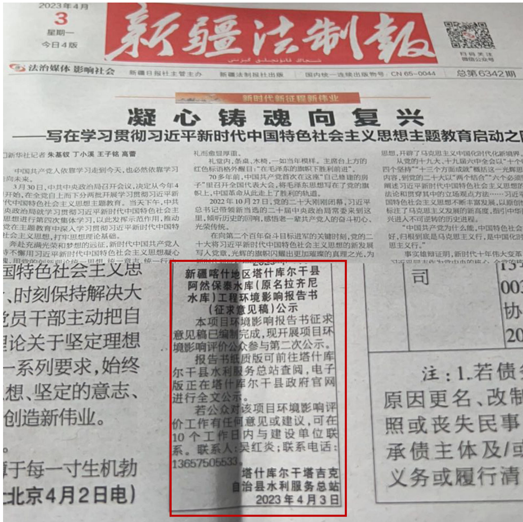
图 3.2-3 新疆法制报 项目征求意见稿第二次报纸公示情况