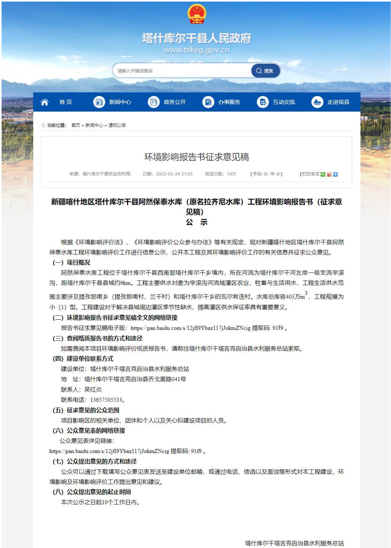
图3.2-1 项目征求意见稿网络公示