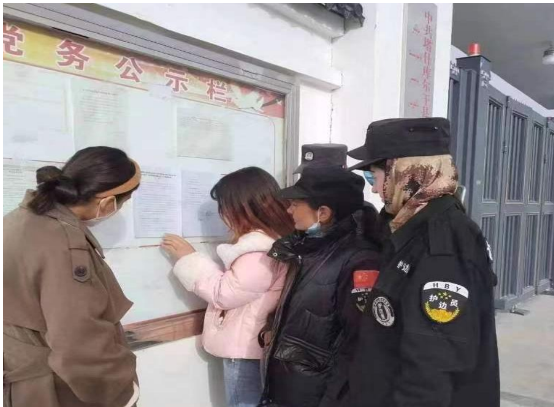
提孜那甫乡提孜那甫村