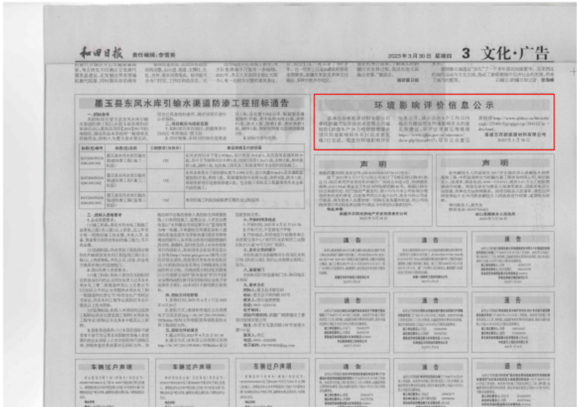
图3 3月30日和田日报截图