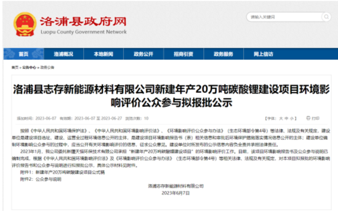
图 4 报批前公示截图