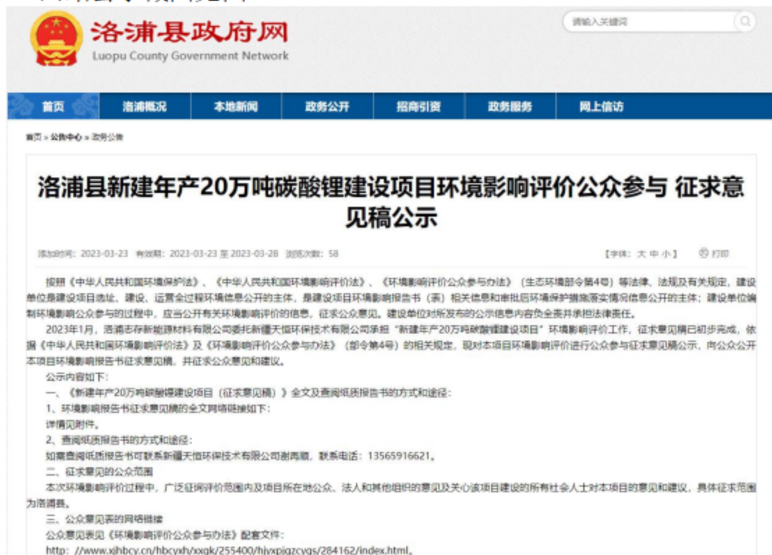
图 1 网上公示截图