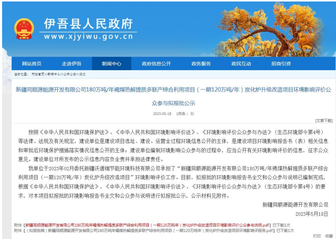
图7本项目拟报批稿网络公示截图