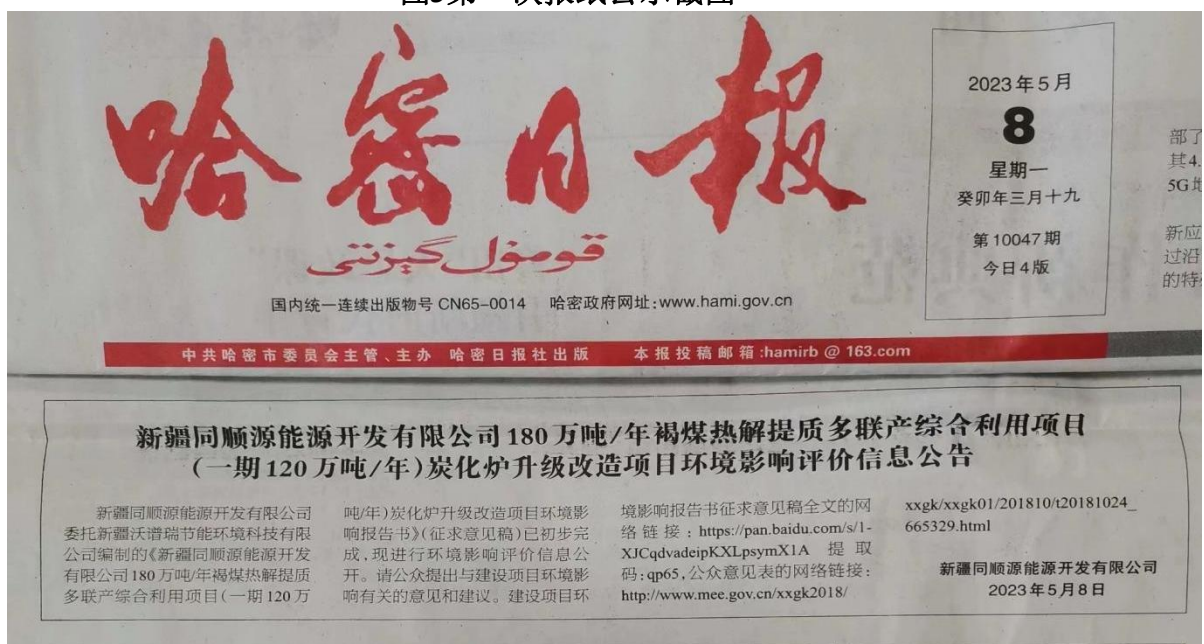
图4第二次报纸公示截图