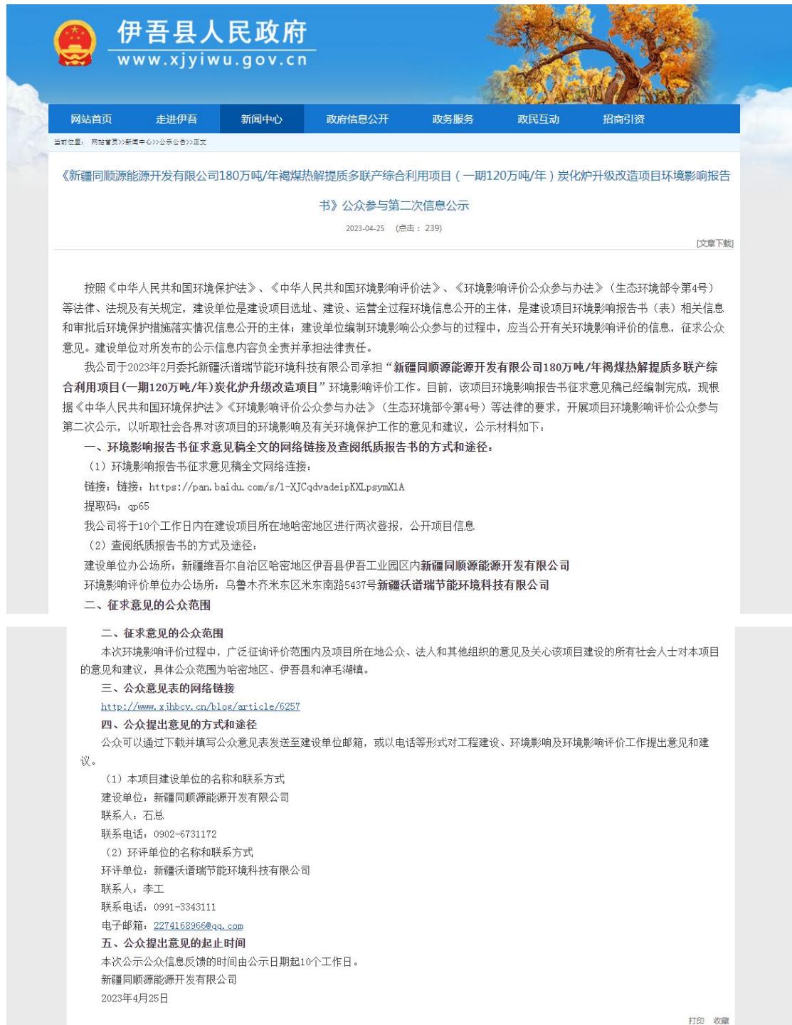
图2本项目征求意见稿网络公示截图