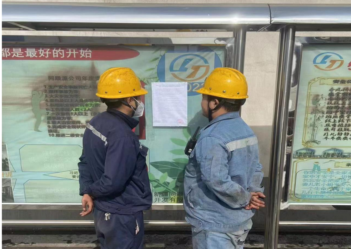
图5 同顺源厂区宣传栏照片

在第二次公示期间，本项目在新疆同顺源能源开发有限公司公示栏和淖毛湖镇政府外进行了张贴公示，载体选择符合《环境影响评价公众参与办法》要求。张贴公示照片见图5和图6。