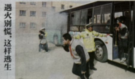
遇火别慌，这样逃生

3月27日，库尔勒市公安局交警大队二十中队民警来到库尔勒市第二中学，开展“播放文明守法种子”护校学生安全出行”安全讲座。