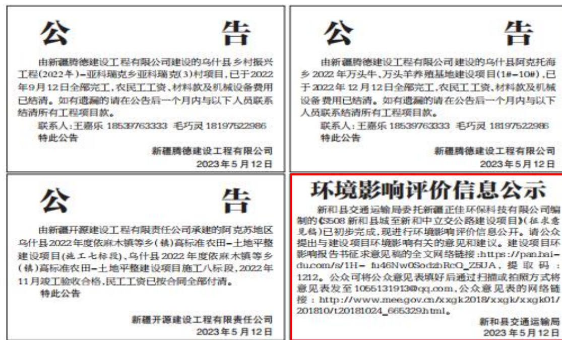
图 3-3 征求意见稿第二次报纸公示截图