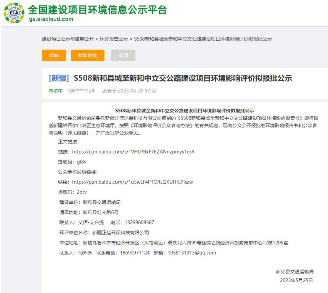
图 6-1 拟报批稿第三次报公示截图

新和县交通运输局于2023年5月25日在全国建设项目环境信息公示平台刊登了项目第三次公众参与公示信息( https://www.eiacloud.com/gs/detail/1?id=30525tHEZ9 ),载体选择符合《环境影响评价公众参与办法》要求。公示截图请见图6-1。