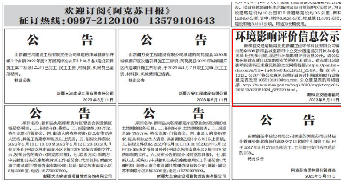
图 3-2 征求意见稿第一次报纸公示截图