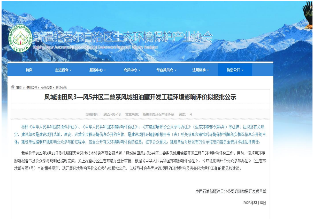
图 6 本工程拟报批稿网络公示截图