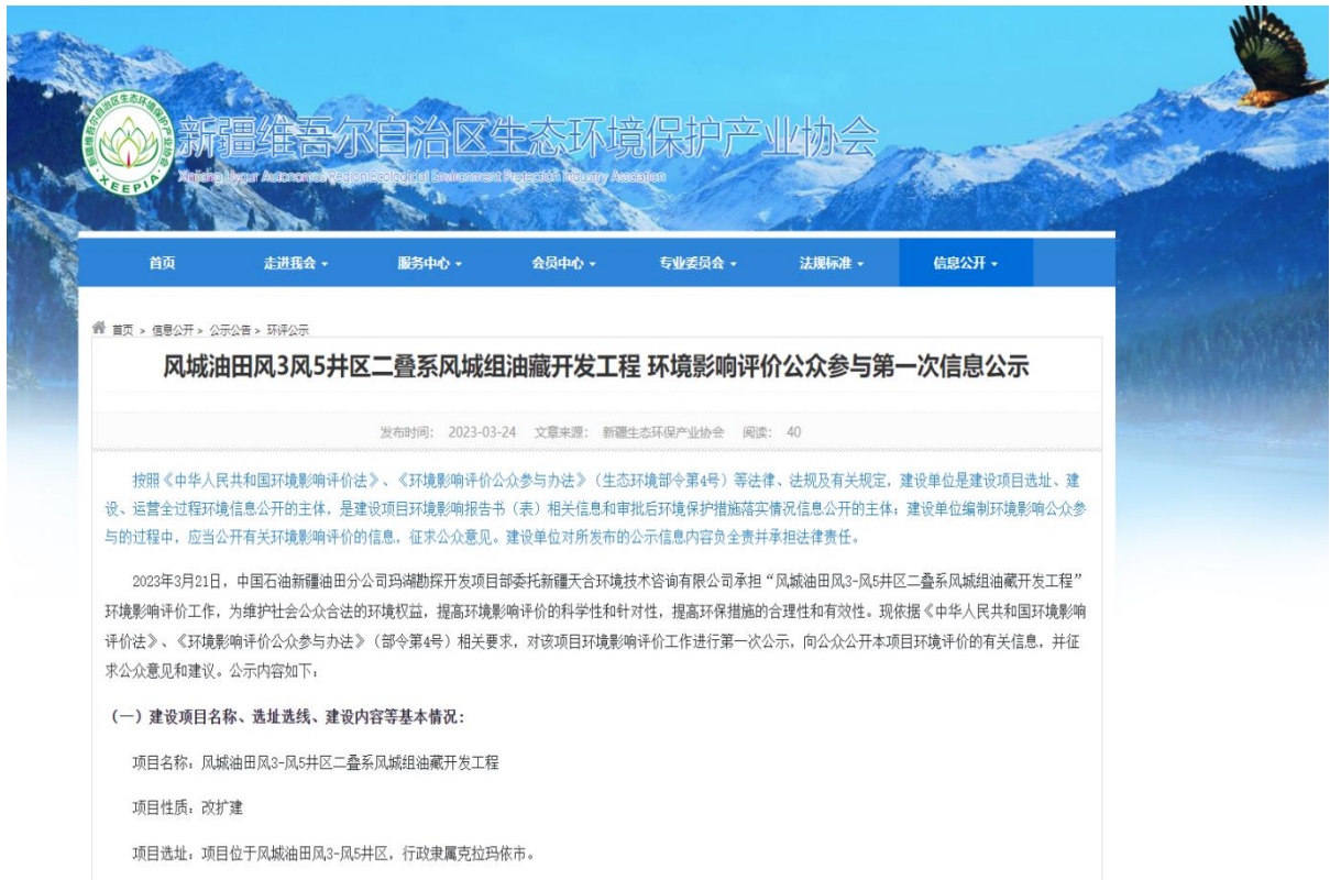
图 1 本项目第一次网络公示截图