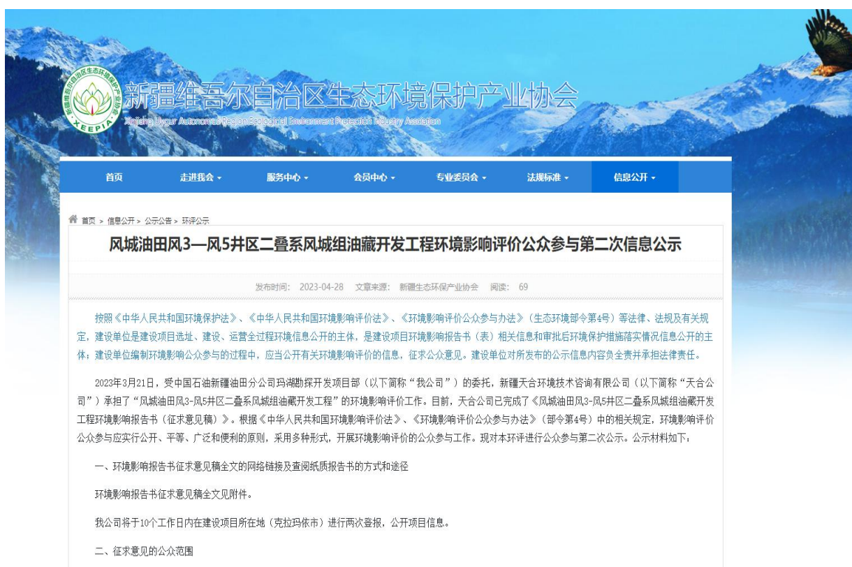
图 2 本项目征求意见稿网络公示截图