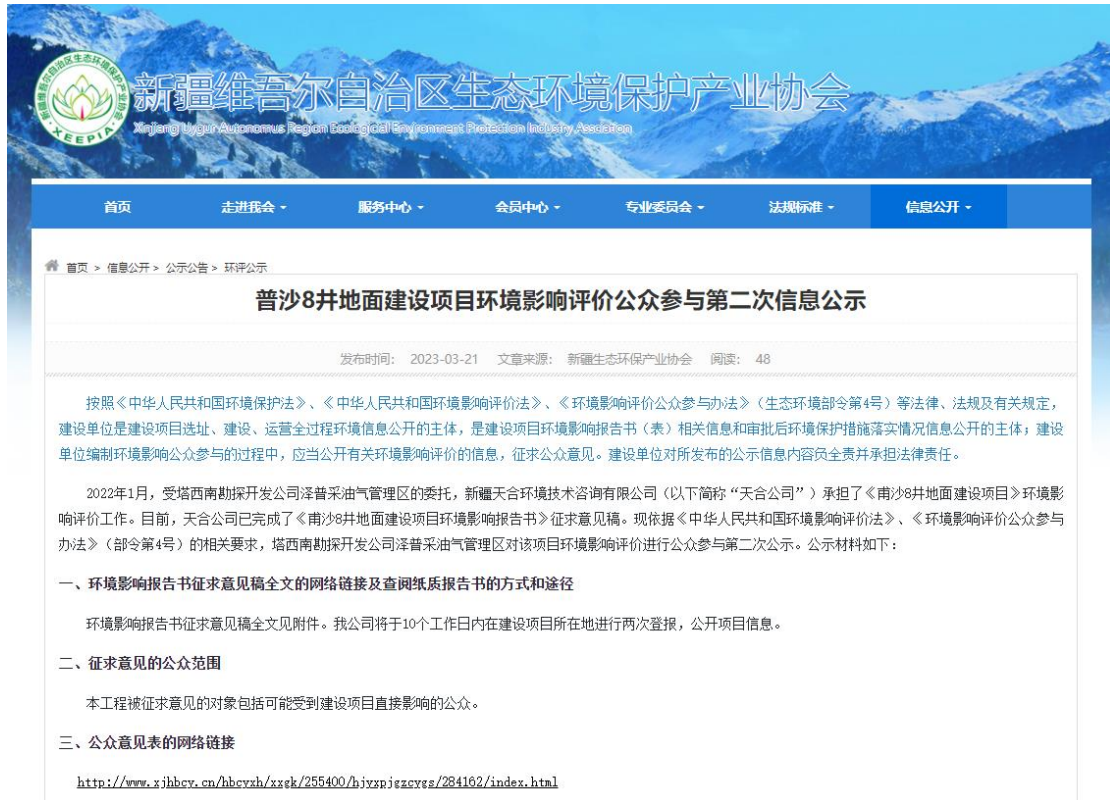
图 2 本项目征求意见稿网络公示截图