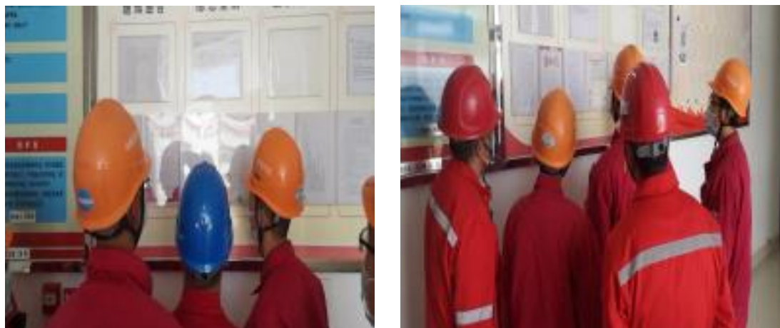
图 5 本项目张贴公示栏照片

在第二次公示期间，本项目在泽普采油气管理区进行了张贴公示，载体选择符合《环境影响评价公众参与办法》要求。张贴公示照片见图 5。