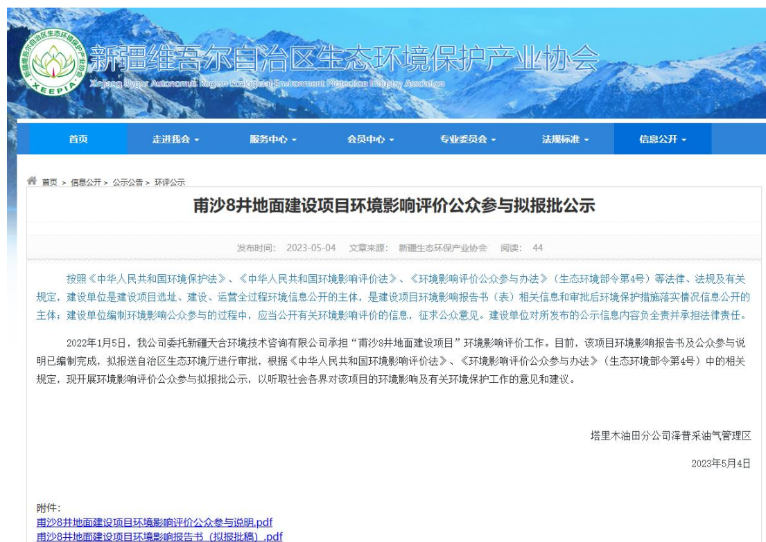
图 6 本项目拟报批前网络公示截图

中国石油天然气股份有限公司塔里木油田分公司在向生态环境主管部门报批环境影响报告书前，于 2023 年 5 月 4 日在新疆维吾尔自治区生态环境保护产业协会网站上进行拟审批网络公示，载体选择符合《环境影响评价公众参与办法》要求。网络公示截图见图 6。