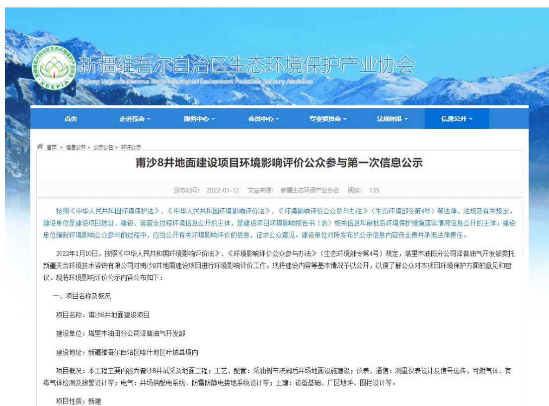
图1 本项目第一次网络公示截图