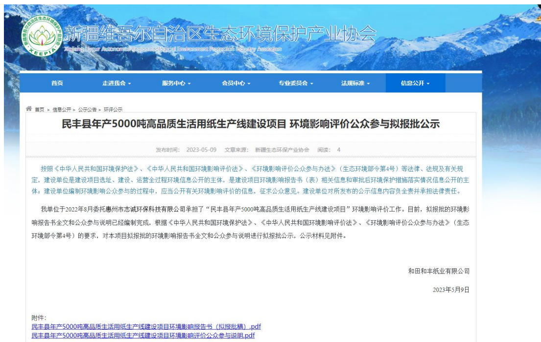
图6 报批前网上公示截图