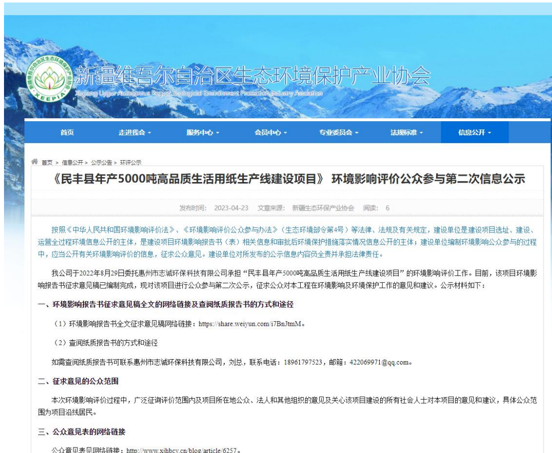
图2 本项目征求意见稿网络公示截图