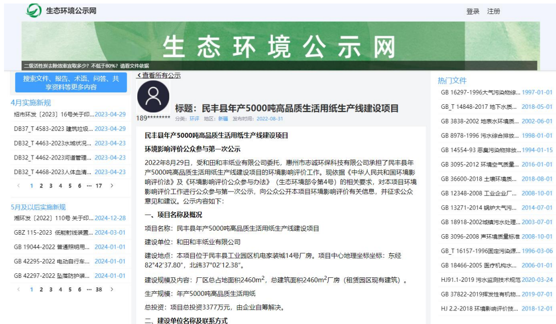
图 1 本项目第一次网络公示截图