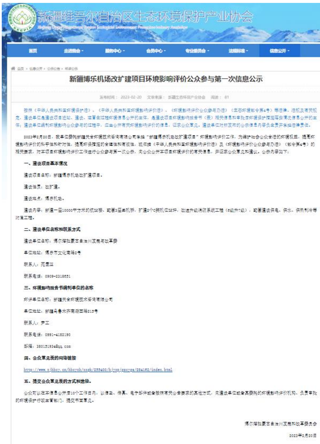
图 2.2-1 本项目第一次网络公示截图