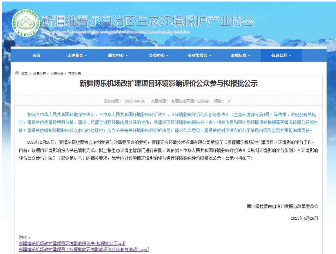
图 6.2-1 拟报批公示网页截图