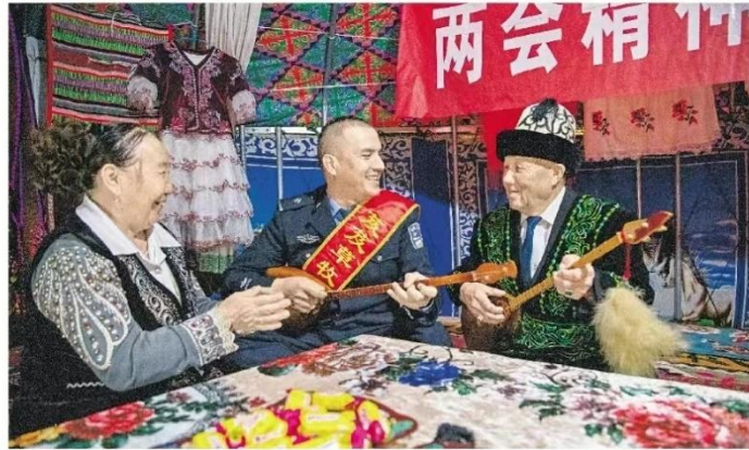
图 3.2-2 本项目第一次报纸公示照片

博乐塔拉蒙古自治州发展与改革委委托新疆天合环境技术有限公司(新疆博乐机场改扩建项目环境影响评估报告)《征求意见稿》(征求意见稿)已初步完成,现进行环境影响评价信息公开。请公众提出与本项目环境影响有关的意见和建议。建设项目环境影响报告书征求意见稿全文的链接地址: http://www.xjhbcy.cn/blog/article/10964。公众意见表的链接地址: http://www.xjhbcy.cn/hbcyxb/xxgk/265400/hyxpgzcygs/284162/index.html。 博尔塔拉蒙古自治州发展与改革委 2023年3月17日