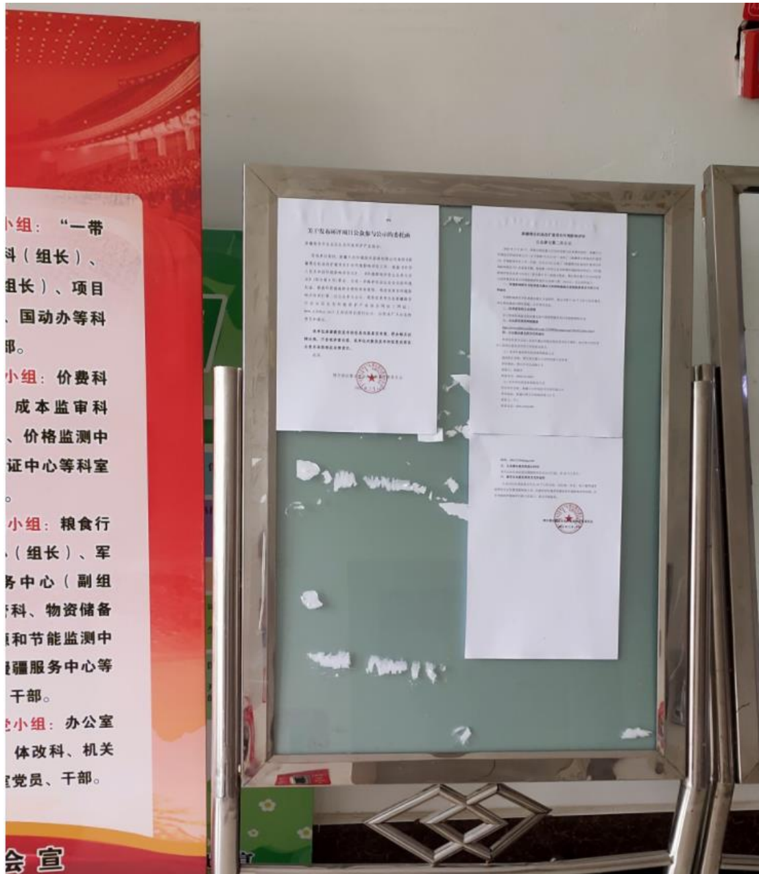
图 3.2-4 本项目公告公示照片