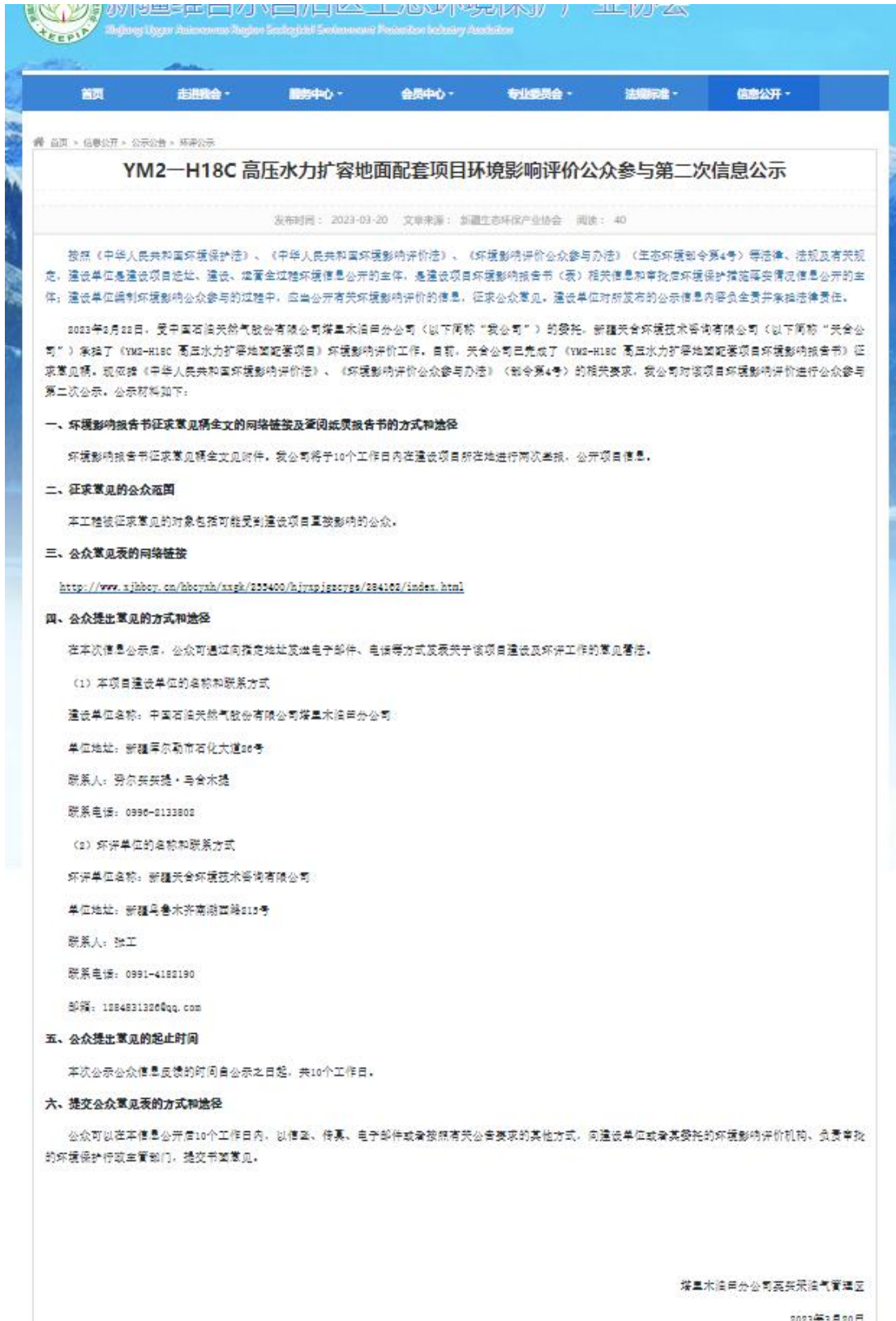
图 3.2-1 本项目征求意见稿网络公示截图