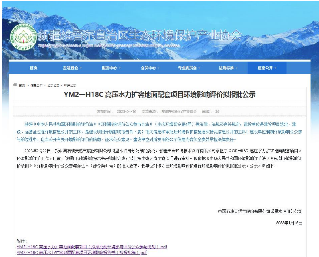
图 6.2-1 拟报批公示网页截图