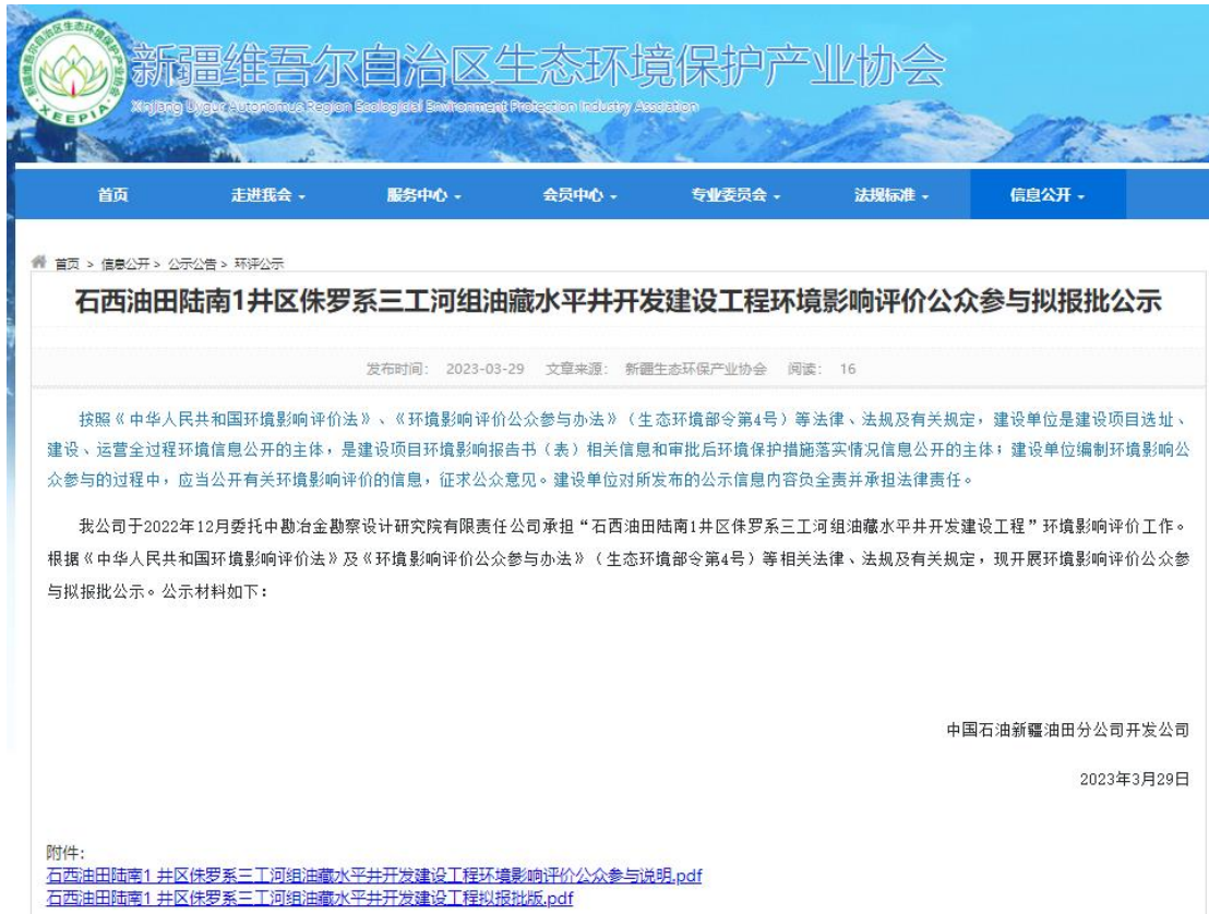
图 6-1 拟报批报公示截图