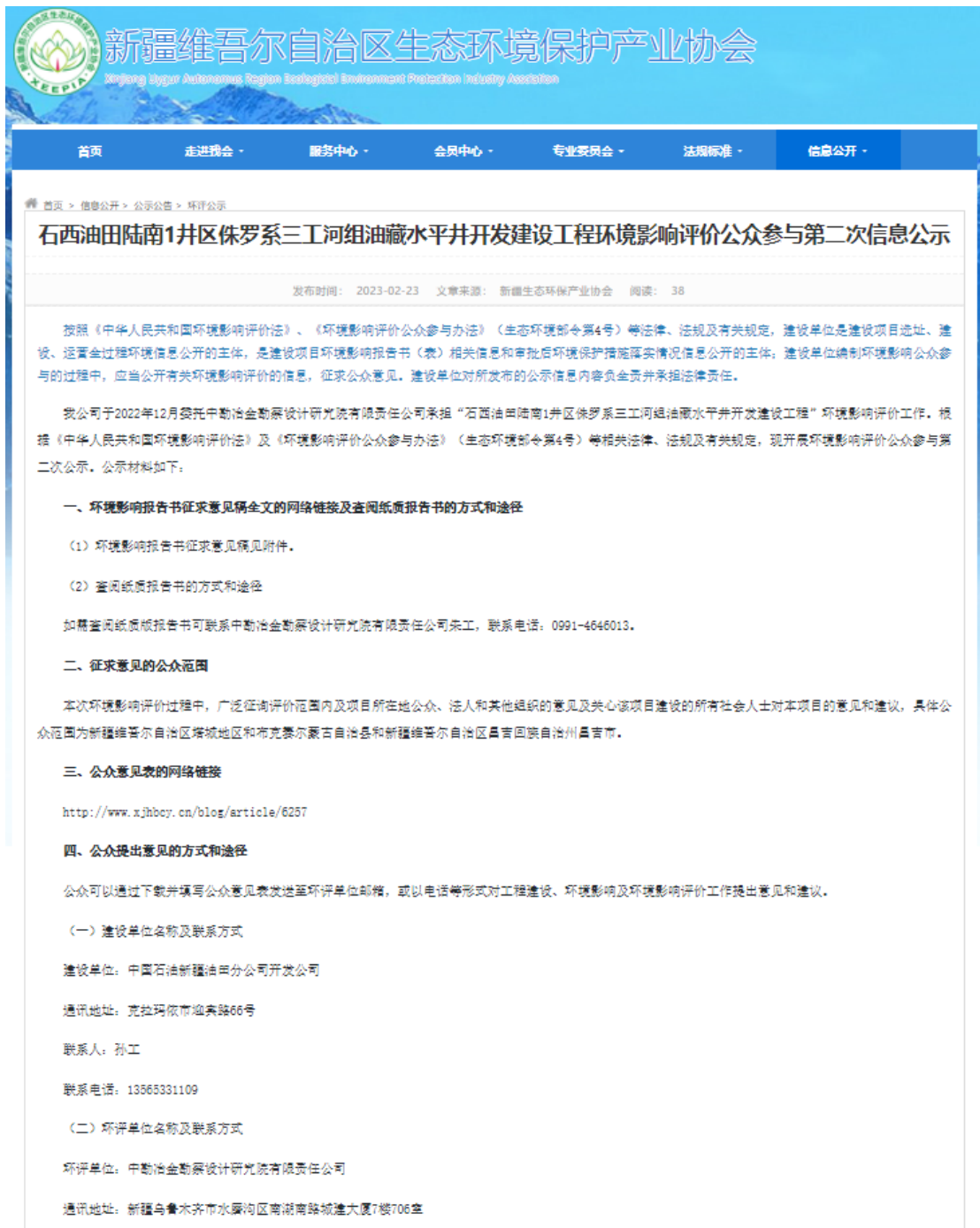
图 3-1 项目公众参与第二次信息公示截图