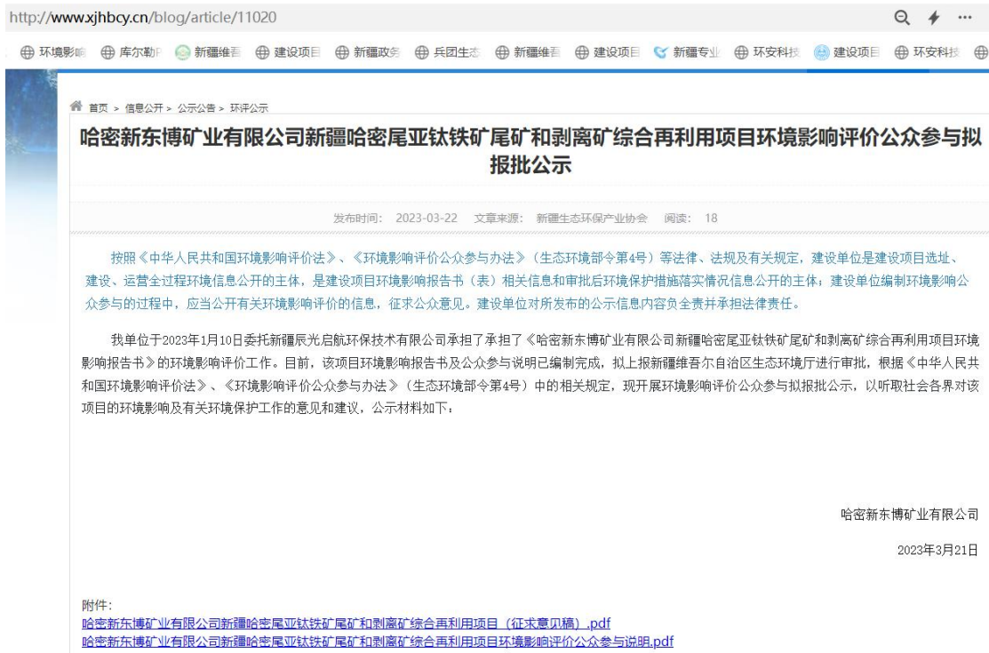
图6 报批前网上公示截图