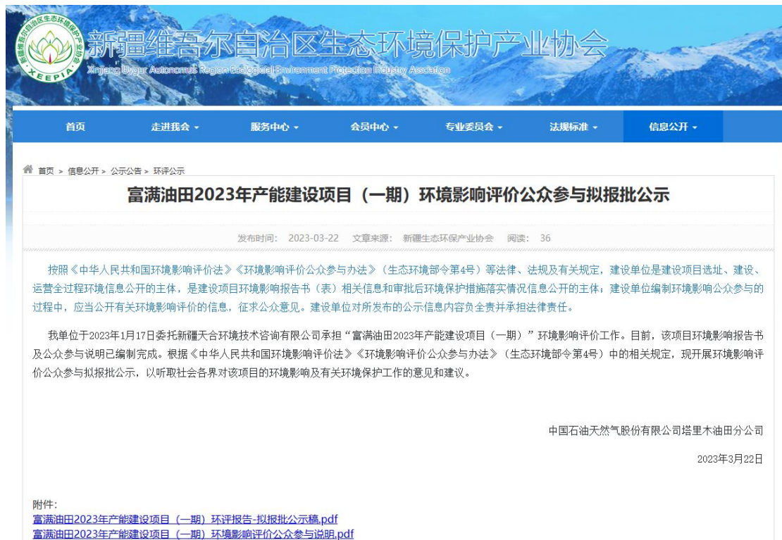
图 5 本项目第三次网络公示截图

中国石油天然气股份有限公司塔里木油田分公司在新疆生态环境保护产业协会网站开展网络公示，载体选择符合《环境影响评价公众参与办法》要求。公示链接： http://www.xjhbcy.cn/blog/article/11025 ，网络公示截图见图 5。