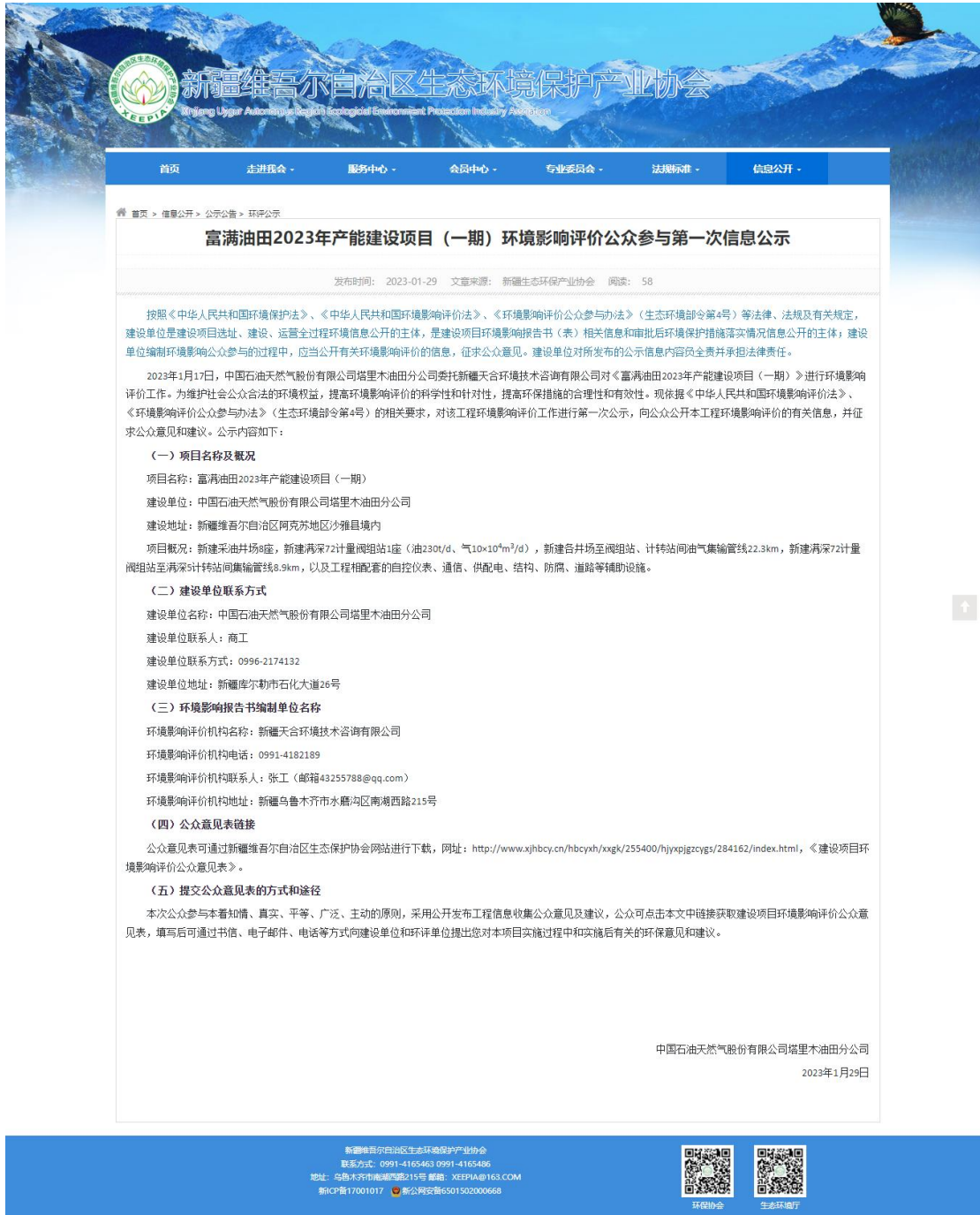
图 1 本项目第一次网络公示截图