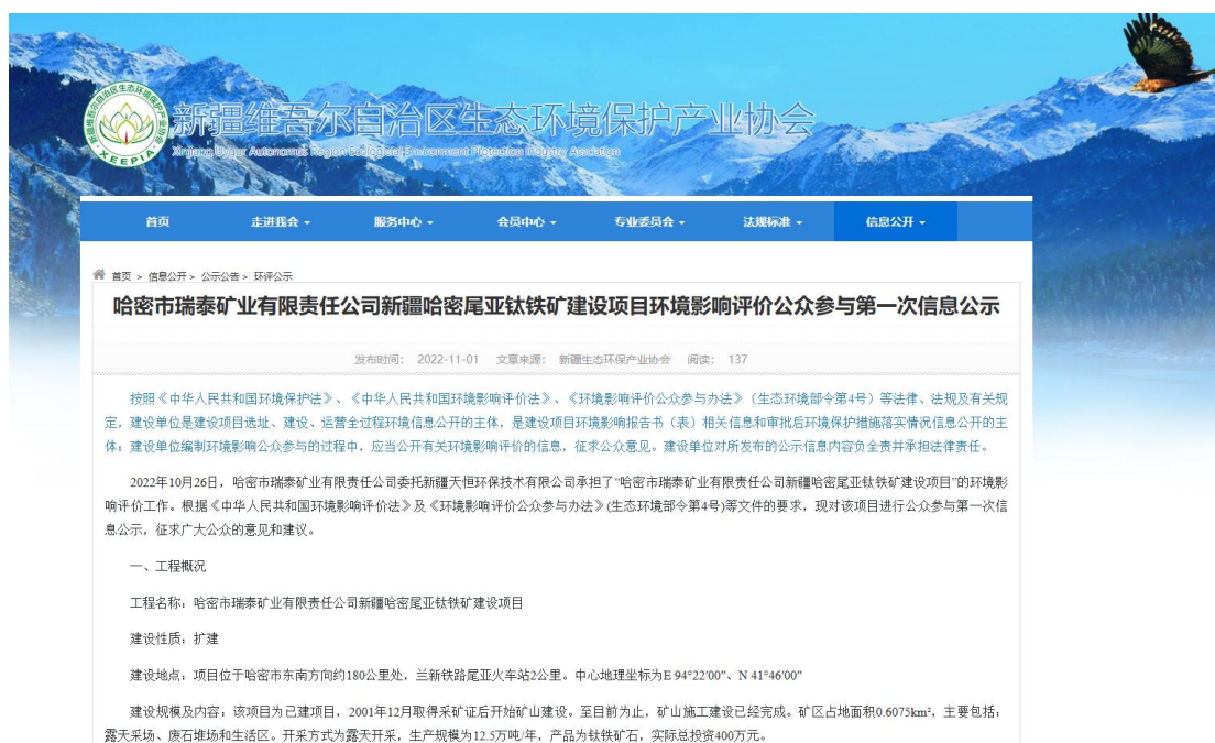
图 1 首次网络公示截图