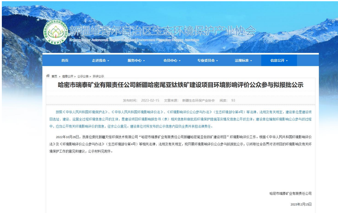
图 5 拟报批网络公示截图