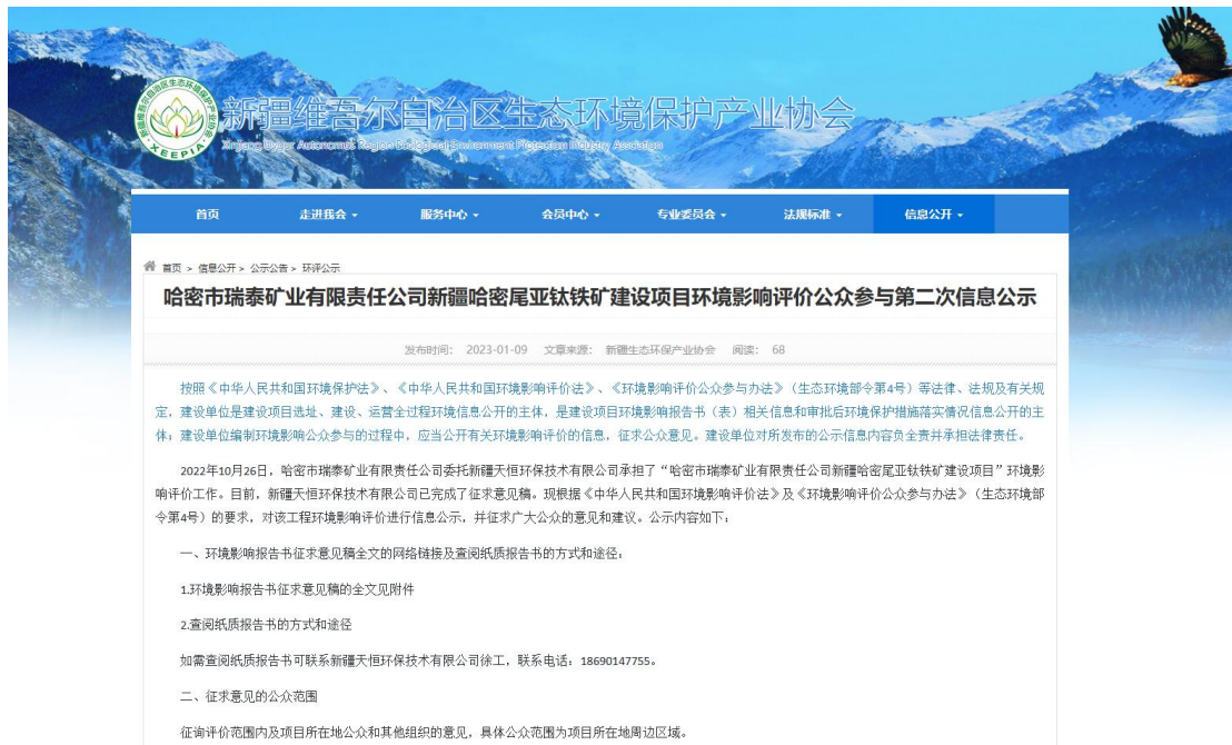
图2 征求意见稿网络公示截图