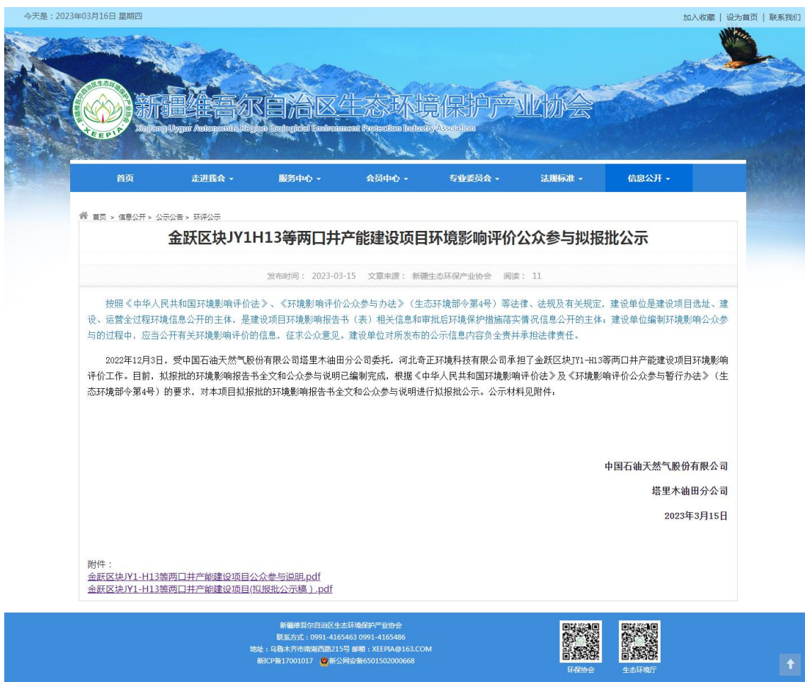
图6-1 报批前网络公示截图

本次报批前公开方式为网络公开，公开时间为2023年3月15日，公开网站为新疆维吾尔自治区生态环境保护产业协会网站（ http://www.xjhbcy.cn/blog/article/10980 ），该网站是新疆维吾尔自治区生态环境保护协会指定官方网站，且可以上传并公开项目环境影响报告书全本，选择该网站进行公示符合《环境影响评价公众参与办法》要求。报批前网络公示截图见图6-1。