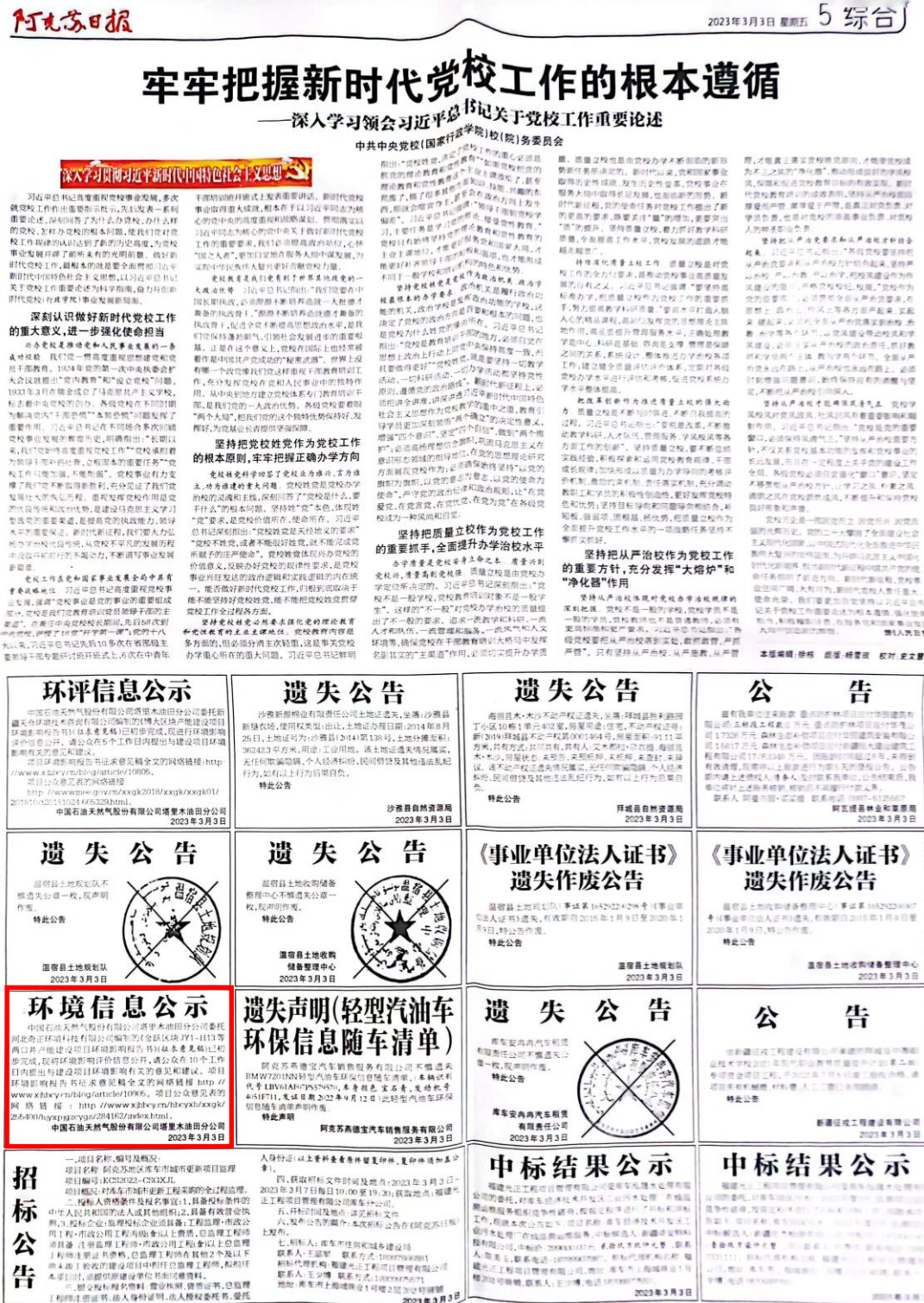
图3-2 2023年3月3日报纸公示情况

在网络公示的同时，我公司于2023年3月3日和2023年3月6日在阿克苏日报上发布了项目环境影响报告书公示信息，报纸公示照片见图3-2、图3-3。