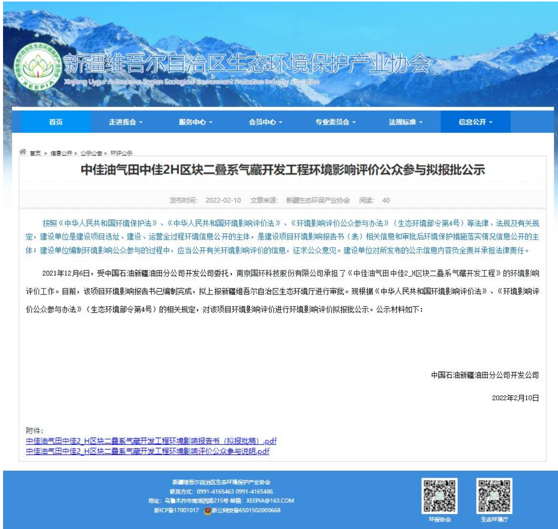
图 6.2-1 报批前公示网络公示截图