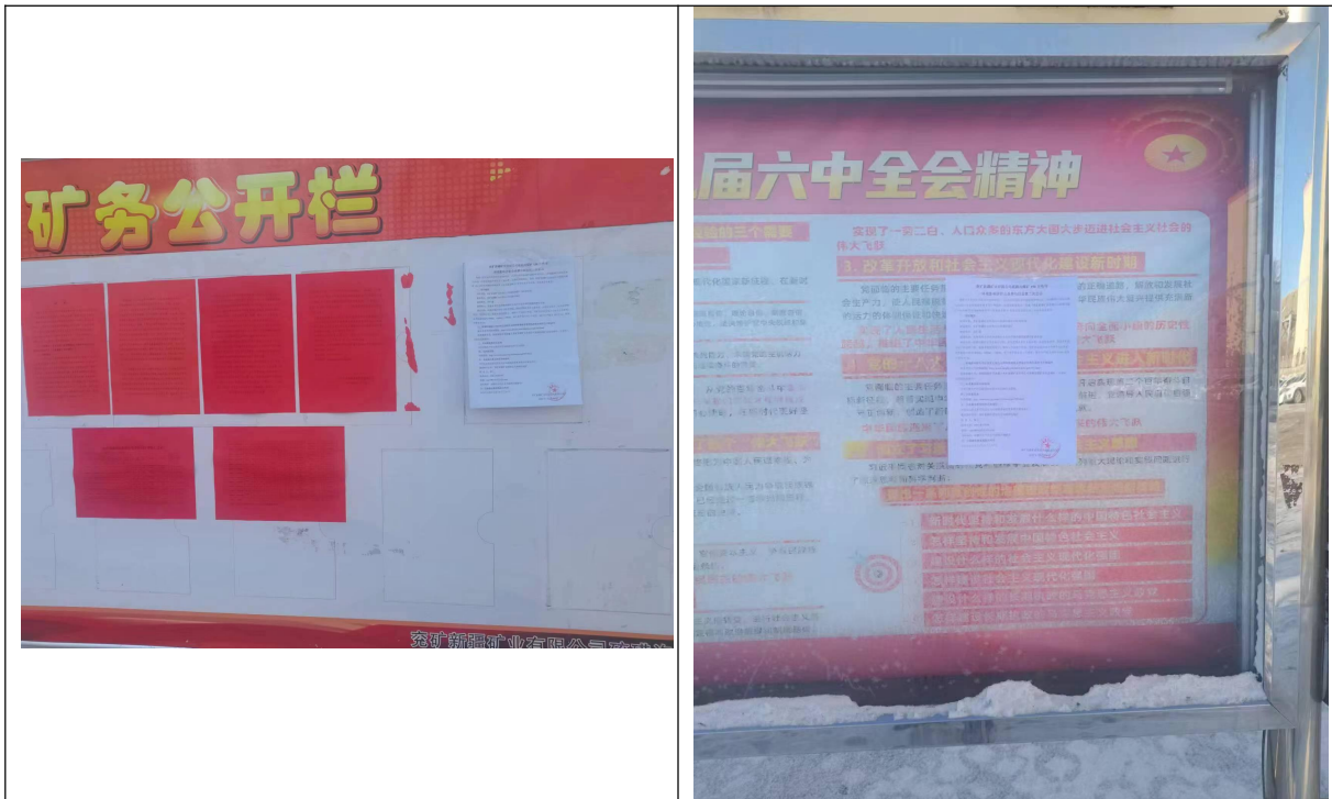
图 3.2-4 张贴公告公示截图