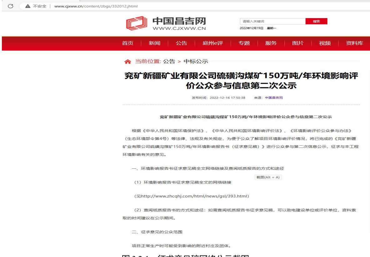
图 3.2-1 征求意见稿网络公示截图