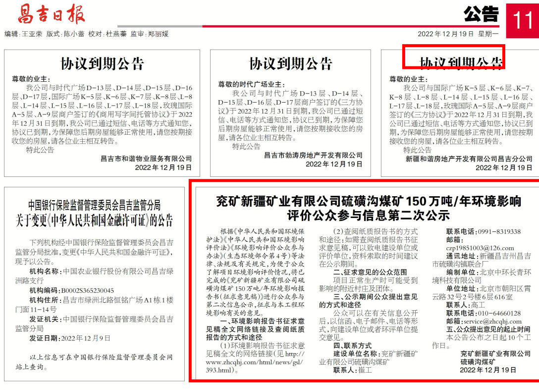
图 3.2-2 项目第一次登报公示截图

在征求意见稿网络公示的同时，在昌吉日报进行了两次登报公示，昌吉日报是项目所在区覆盖面较大的一张报纸，选择该报纸符合《办法》中规定要求。两次登报公示日期分别为 2022 年 12 月 19 日和 12 月 23 日，第一次登报公示截图见图 3.2-2，第二次登报公示截图见图 3.2-3。