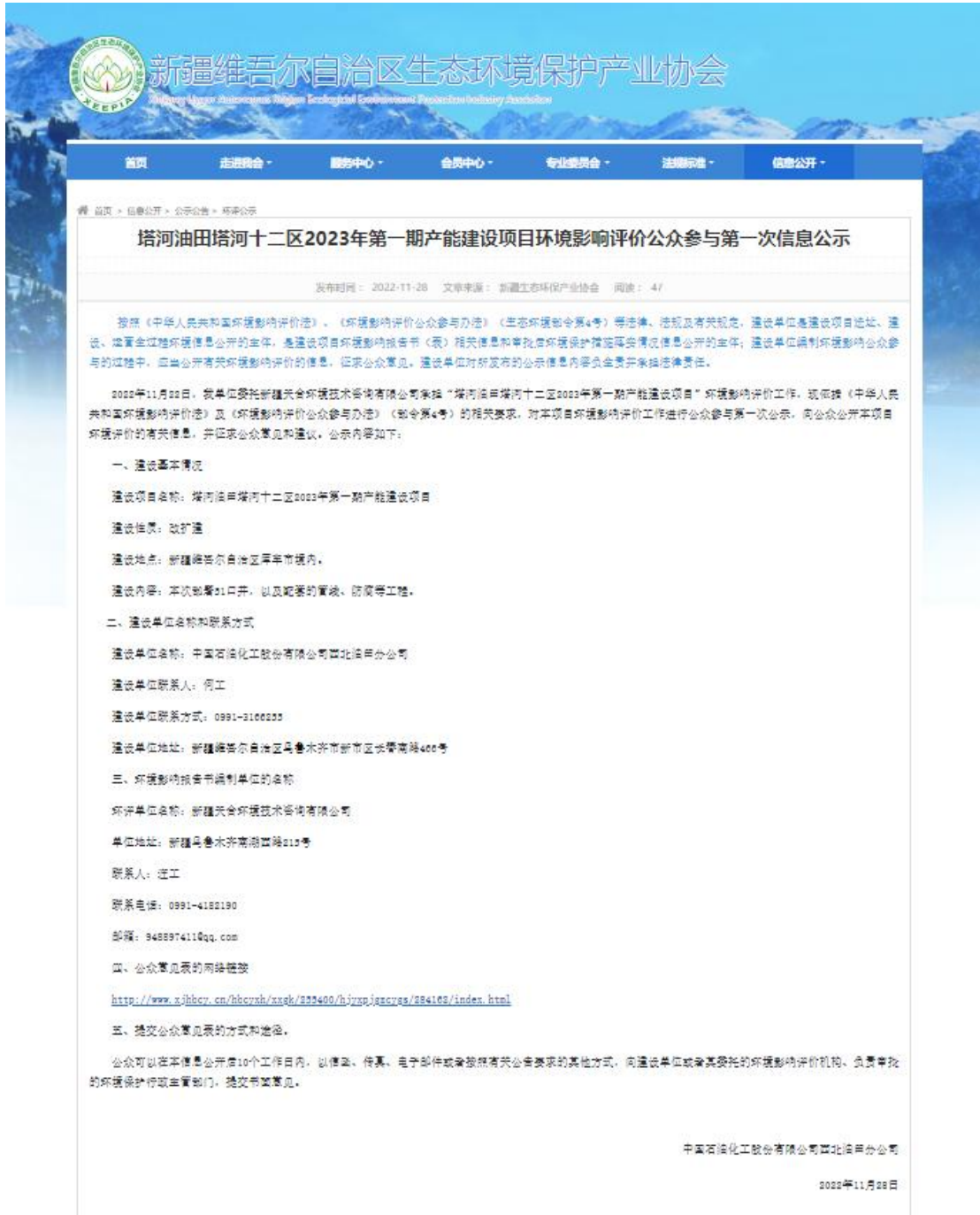
图 2.2-1 本项目第一次网络公示截图