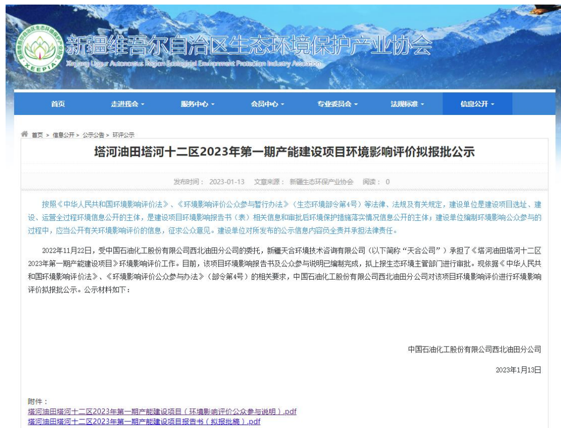
图 6.2-1 拟报批公示网页截图