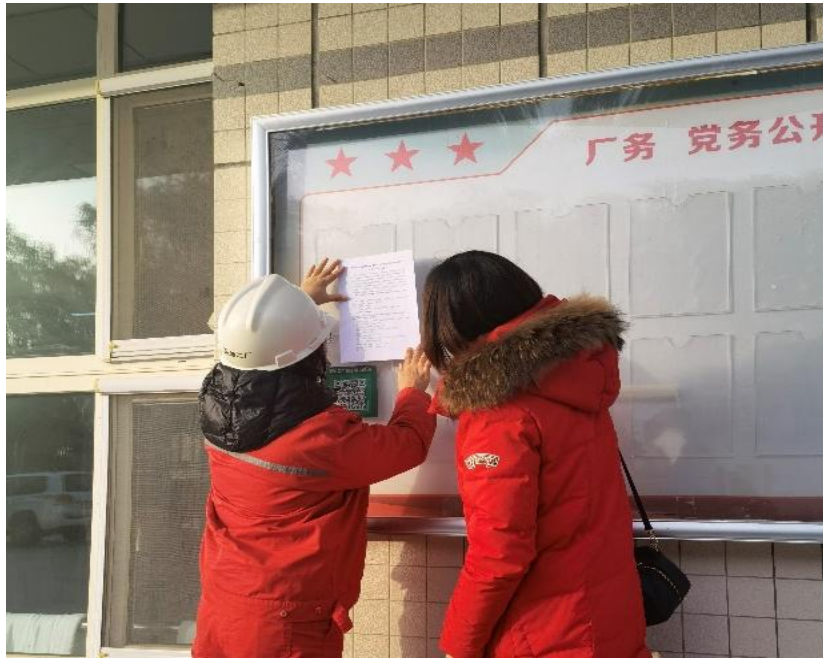
图 3.2-4 本项目张贴公示栏照片