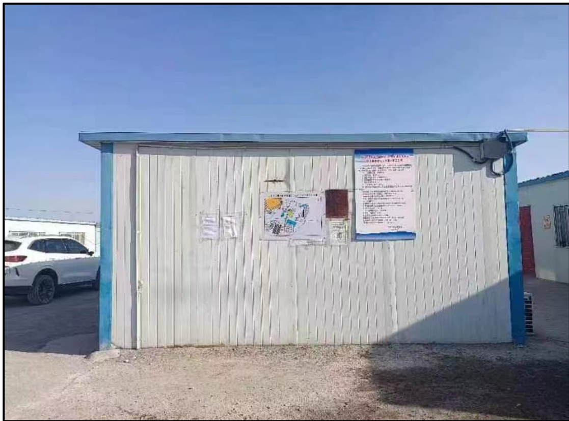
图 6 现场张贴照片