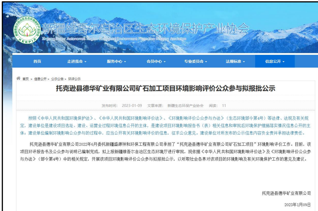
图9 拟报批稿网络公示截图