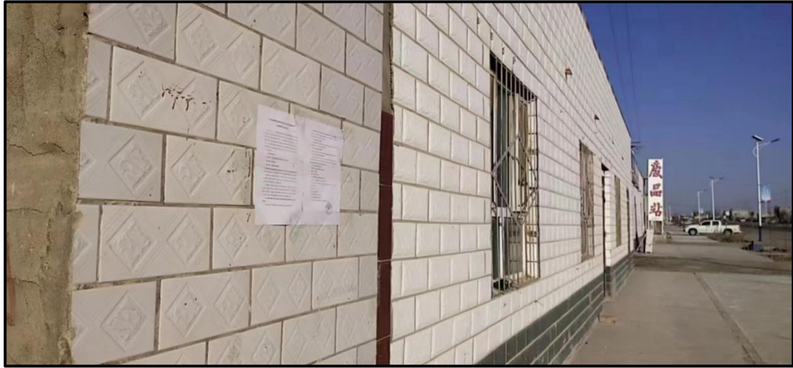
图 5 现场张贴照片