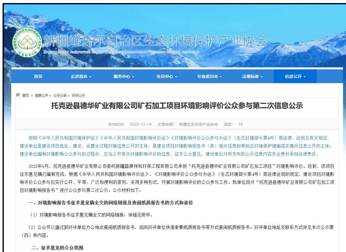
图 2 征求意见稿网络公示截图