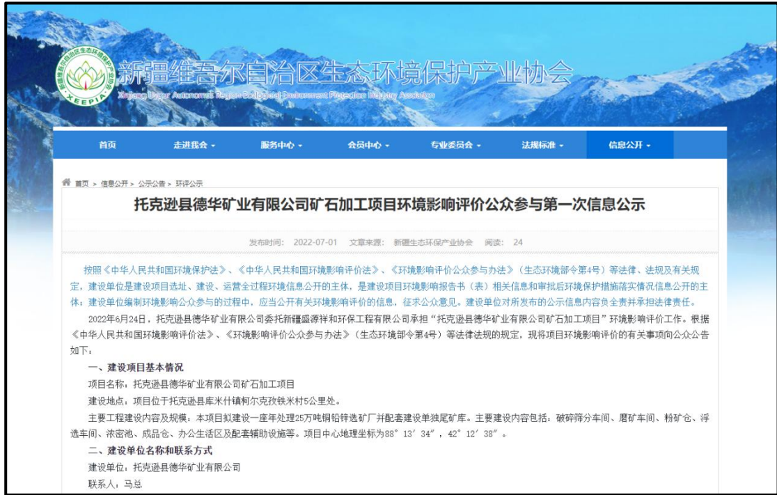
图1 首次环境影响评价信息网络公示截图