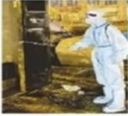
艾乃图拉在辖区开展消杀工作。