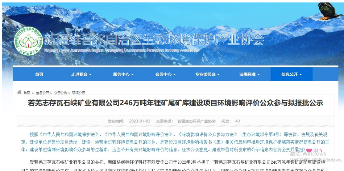
图6 报告书（公示本）及公众参与说明全文网络公示截图