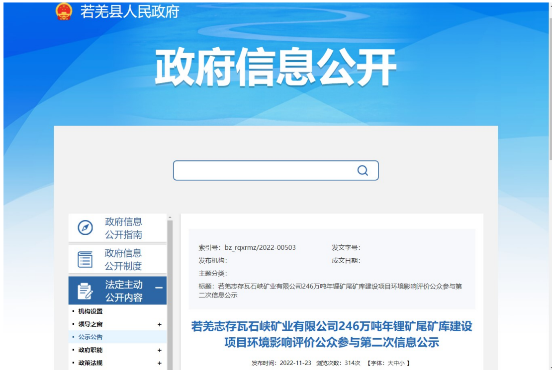
图3 公众参与第二次信息公告网络公示截图(1)