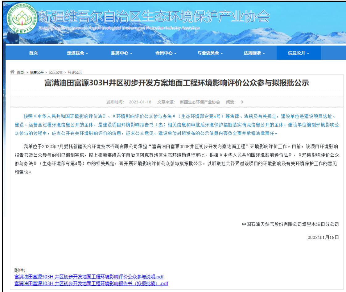
图 6.1-1 本工程报批前公示截图