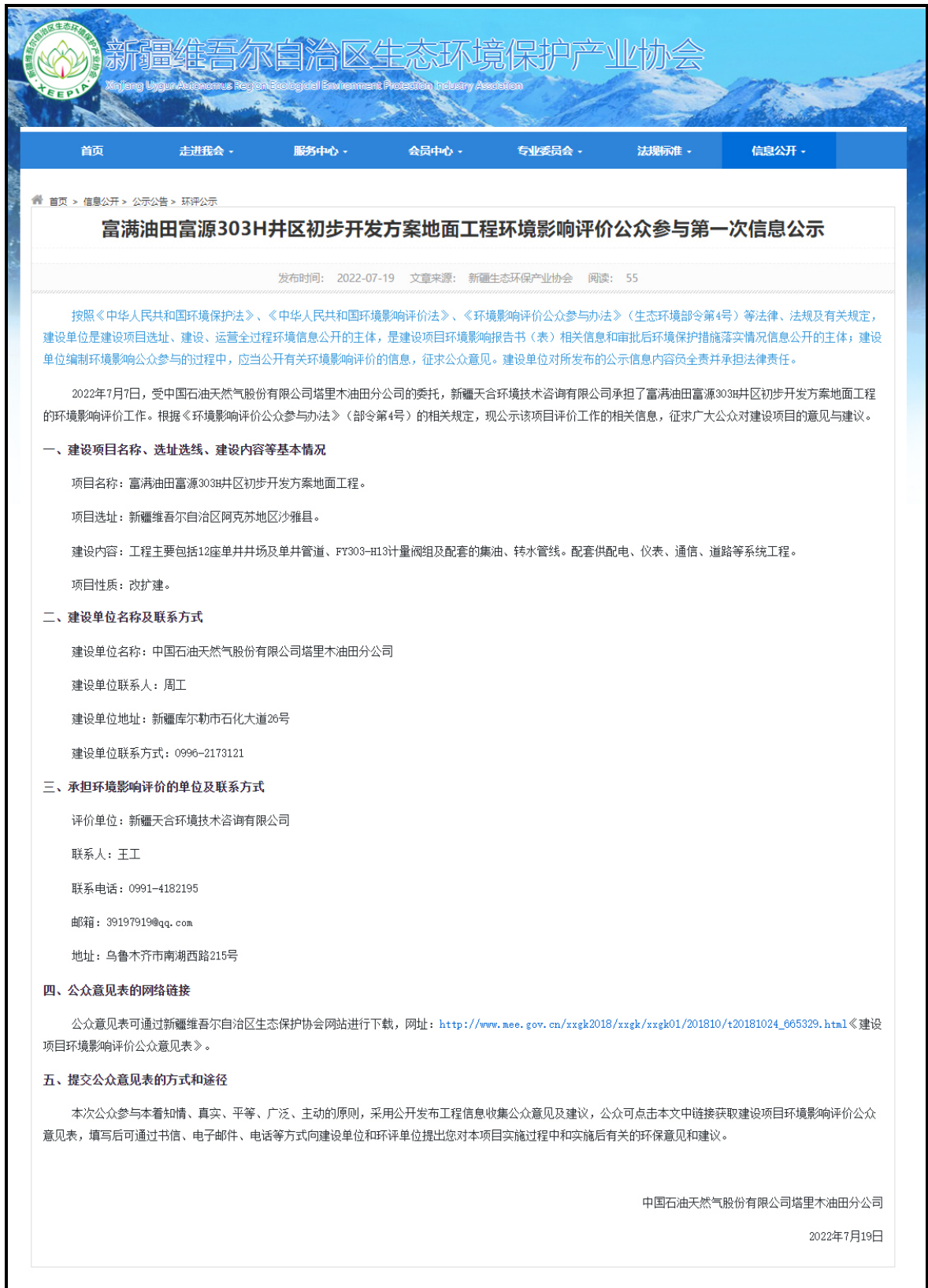
图 2.2-1 本工程第一次网络公示截图