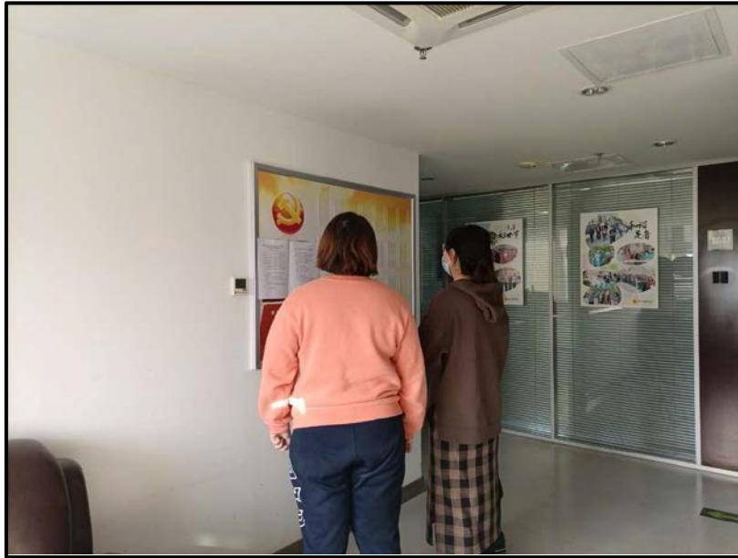
图 3.2-4 本工程张贴公示栏照片