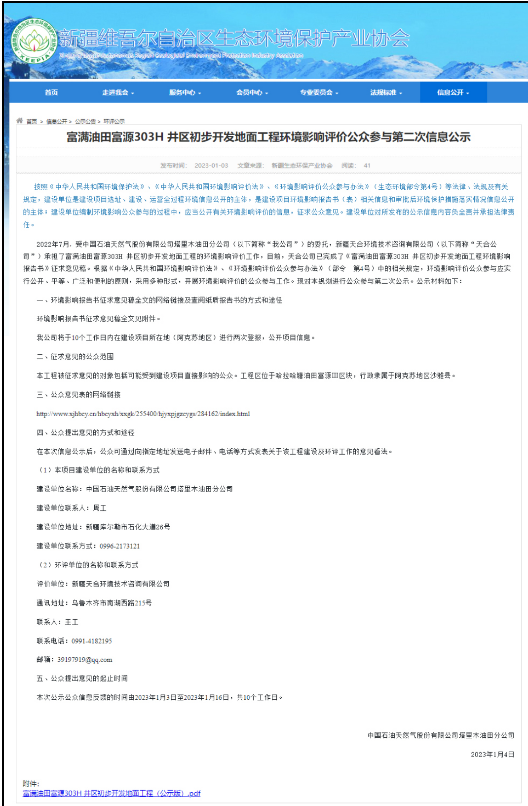
图 3.2-1 本工程第二次网络公示截图