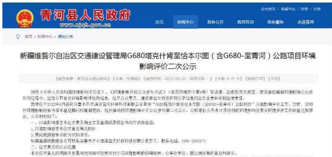
图 2 本项目征求意见稿网络公示截图