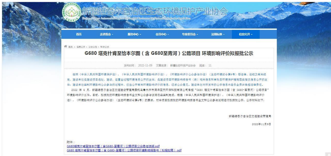
图5 报批前网络公示截图

本次报批前公开方式为网络公开，公开时间为2022年11月9日，公开网站为新疆维吾尔自治区生态环境保护产业协会网站，该网站在是新疆维吾尔自治区环保专业网站，访问流量较大，且可以上传并公开项目环境影响报告书全本，选择该网站进行公示符合《环境影响评价公众参与办法》要求。报批前网络公示截图见图5。