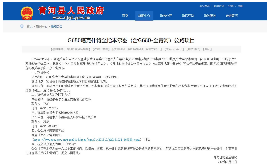
图1 本项目第一次网络公示截图

新疆维吾尔自治区交通建设管理局于2022年8月18日在青河县人民政府网（ http://www.xjqh.gov.cn/xwzx/001006/20220818/5958f6ef-5107-4e18-937f-bf61120d7d1c.html ）上进行了第一次网络公示，向公众告知本项目的建设情况，载体选择符合《环境影响评价公众参与办法》要求。网络公示截图见图1。