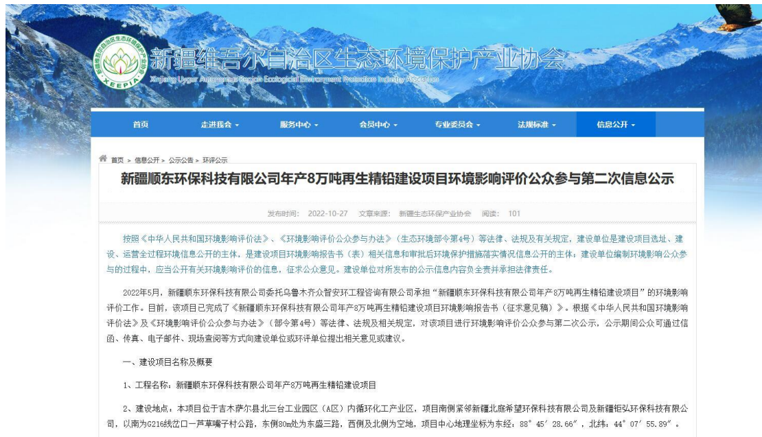
图1 第二次网络公示截图