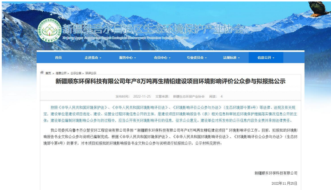
图 4 拟报批公示图片