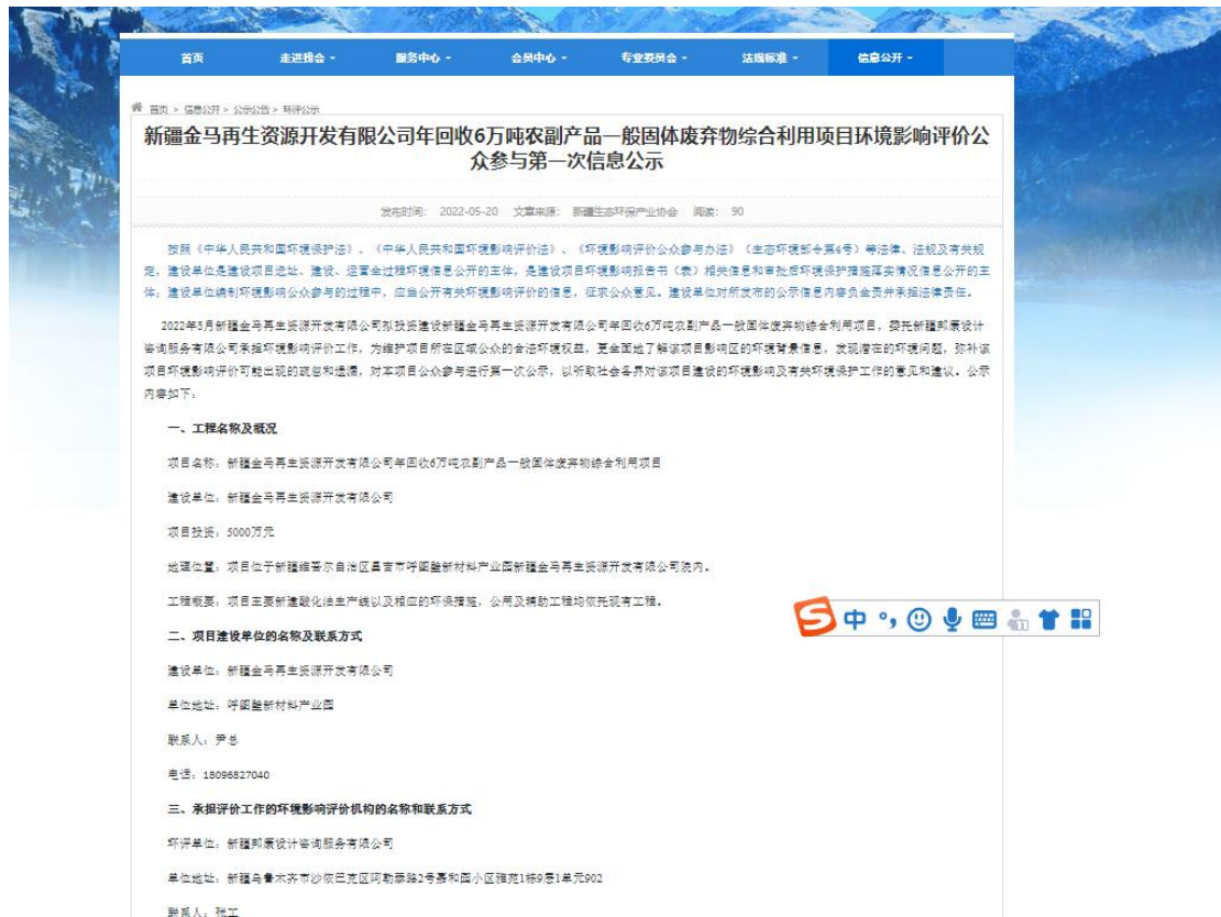
图1 本项目第一次网络公示截图

2022年5月20日，我单位在 新疆维吾尔自治区生态环境保护产业协会 ( x.jhbcy.cn )上进行了第一次网络公示，向公众告知本项目的建设情况。公示网址： 新疆维吾尔自治区生态环境保护产业协会 ( x.jhbcy.cn )。新疆金马再生资源开发有限公司在环境影响评价信息公示平台开展网络公示，载体选择符合《环境影响评价公众参与办法》要求。网络公示截图见图1。