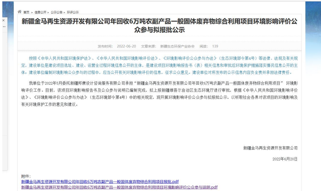
图 3 本项目报批稿网络公示截图