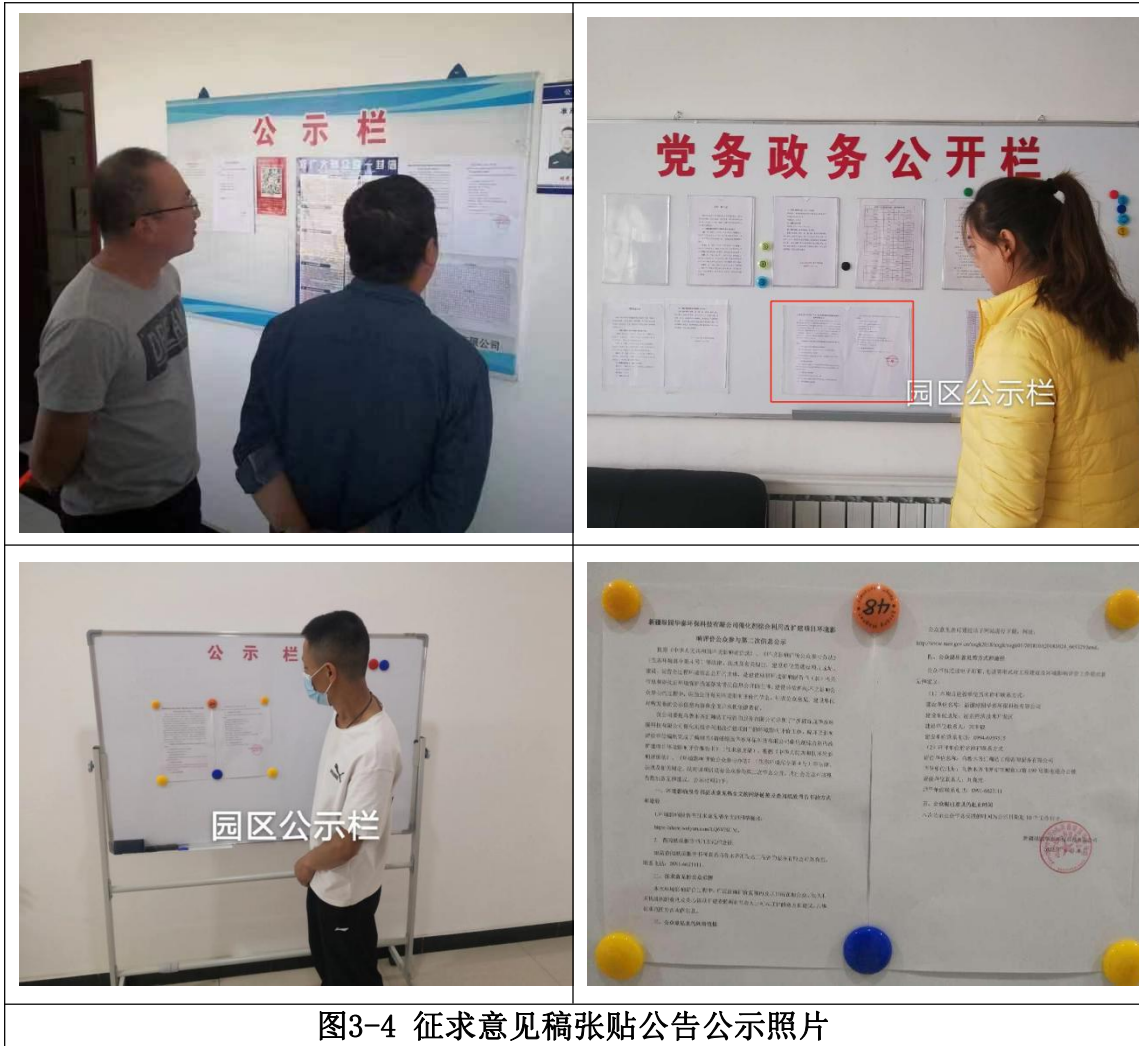
图3-4 征求意见稿张贴公告公示照片