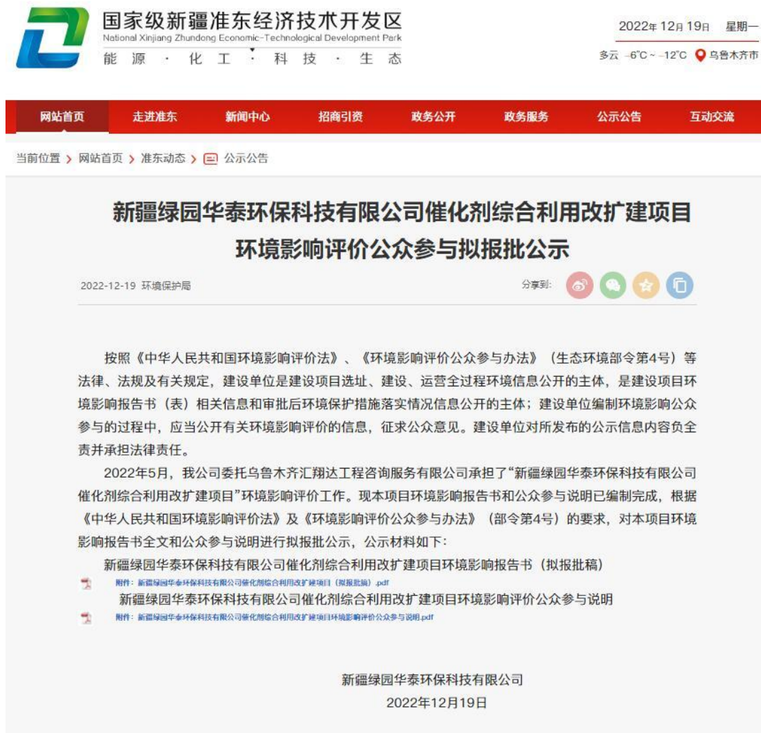
图 6-1 本项目拟报批网络公示截图

因为本项目未收到公众对环境影响方面提出的反馈意见，所以未开展公众座谈会、听证会、专家论证会等深度公众参与，符合《环境影响评价公众参与办法》要求。