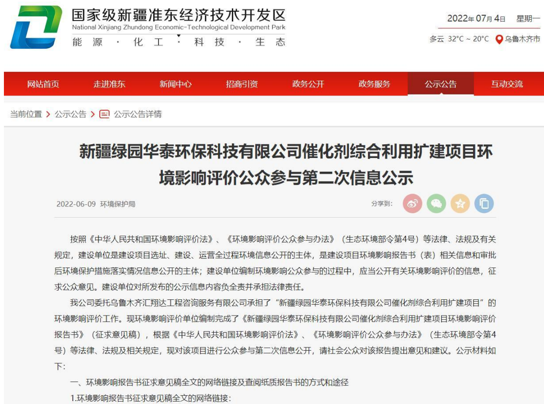
图 3-1 本项目征求意见稿网络公示截图

( http://zd.cj.cn/newsInfo.html?newsPageTitle=%25E5%2585%25AC%25E7%25A4%25BA%25E5%2585%25AC%25E5%2591%258A&bigcategory=&category=%25E5%2585%25AC%25E7%25A4%25BA%25E5%2585%25AC%25E5%2591%258A%25E8%25AF%25A6%25E6%2583%2585&cid=79&newsId=3941&newsInfoURL=/zw/details&banner=01 ), 载体选择符合《环境影响评价公众参与办法》要求。公示截图请见图 3-1。