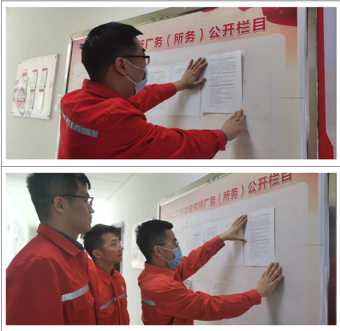
图 3.2-4 本项目公告栏公示照片