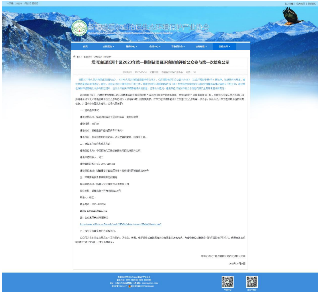
图 2.2-1 本项目第一次网络公示截图