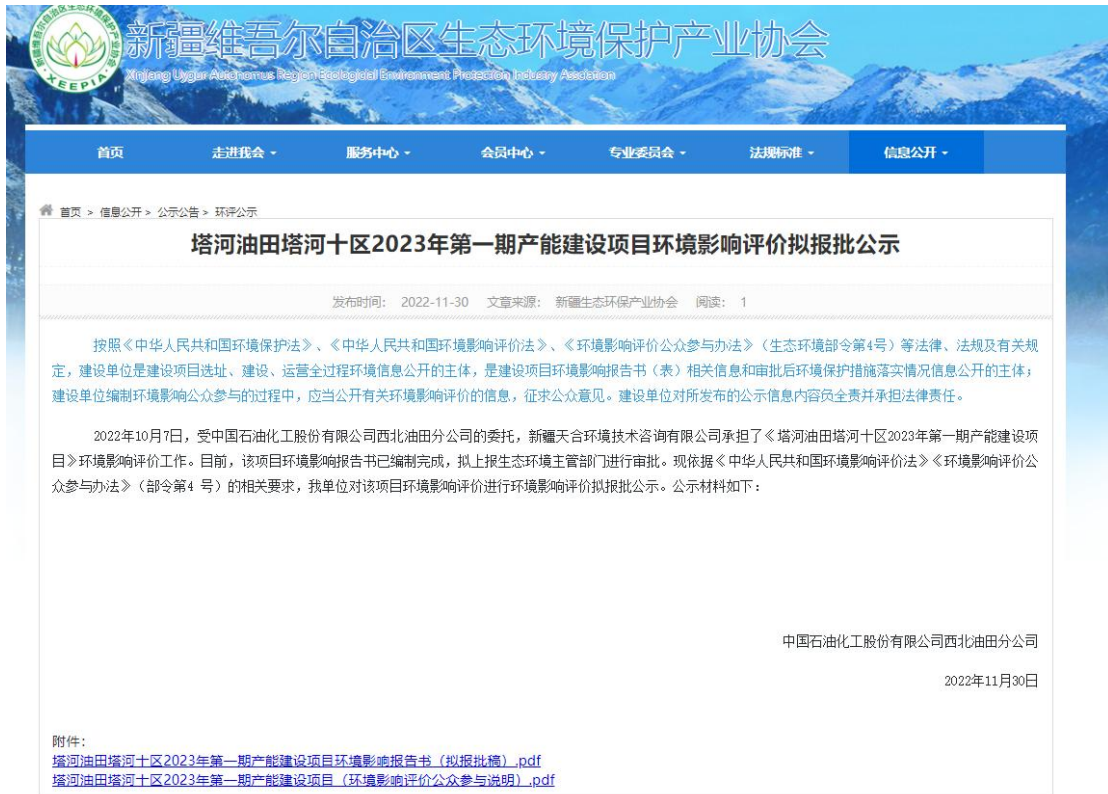
图 6.2-1 拟报批公示网页截图