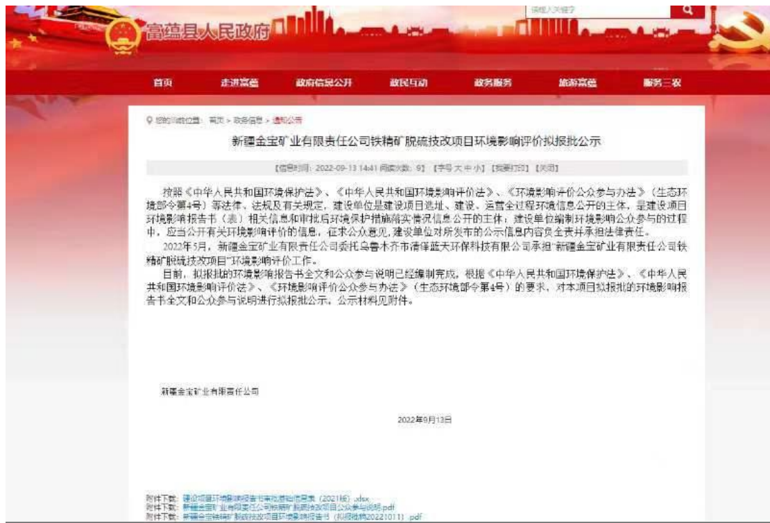
图5 报批前网络公示截图

本次报批前公开方式为网络公开，公开时间为2022年9月13日，公开网站为富蕴县人民政府网，该网站是在富蕴县人民政府网，访问流量较大，且可以上传并公开项目环境影响报告书全本，选择该网站进行公示符合《环境影响评价公众参与办法》要求。报批前网络公示截图见图5。