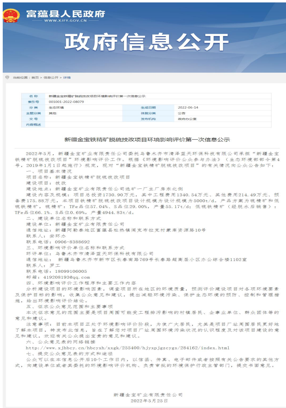
图 1 本项目第一次网络公示截图

新疆金宝矿业有限责任公司于 2022 年 6 月 15 日在富蕴县人民政府网（ http://www.xjfy.gov.cn/govxxgk/001040/2022-06-14/3f48838b-0d8c-4b25-8e2d-2cd8f62db9e1.html ）上进行了第一次网络公示，向公众告知本项目的建设情况，载体选择符合《环境影响评价公众参与办法》要求。网络公示截图见图 1。