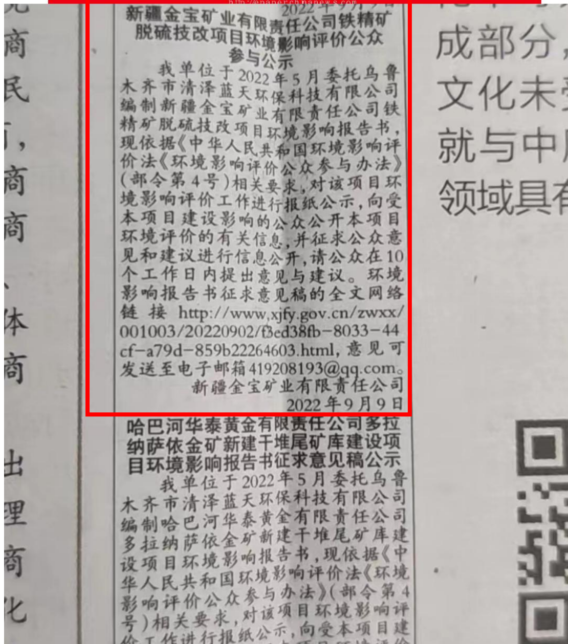
图4 本项目征求意见稿第二次报纸公示照片