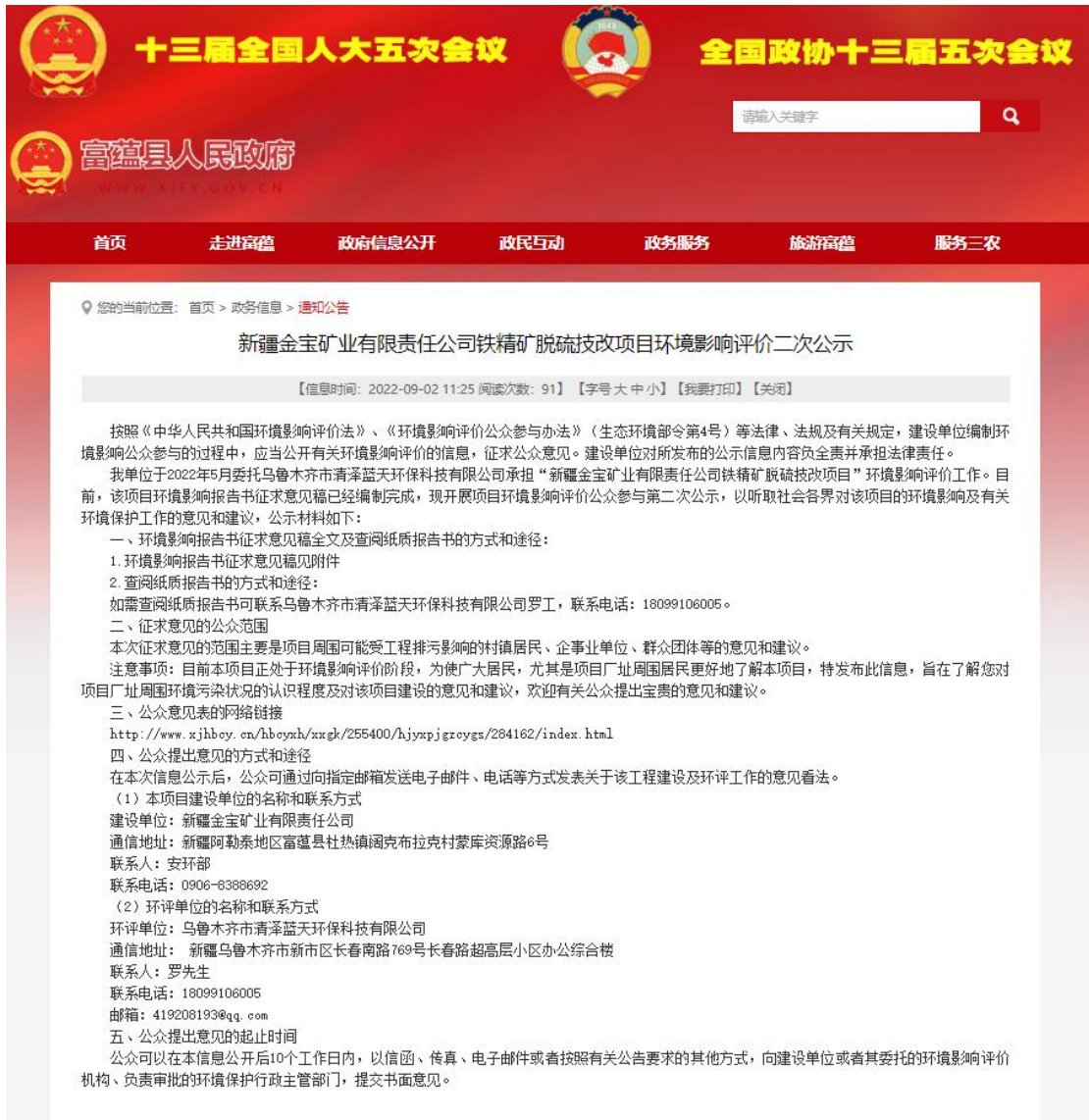
图 2 本项目征求意见稿网络公示截图