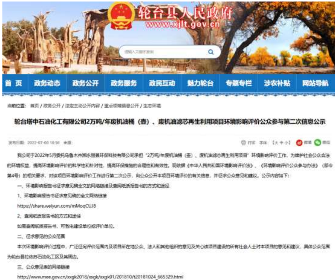
图 3-1 征求意见稿网络公示截图