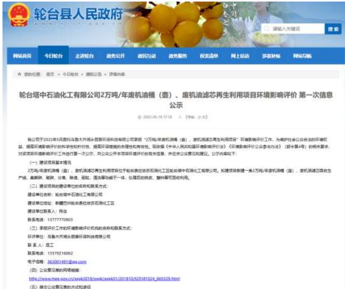
图 2-1 第一次网络公示截图

本次选择在轮台县人民政府网站上公示符合《环境影响评价公众参与办法》要求。 第一次网络公示截图如下：