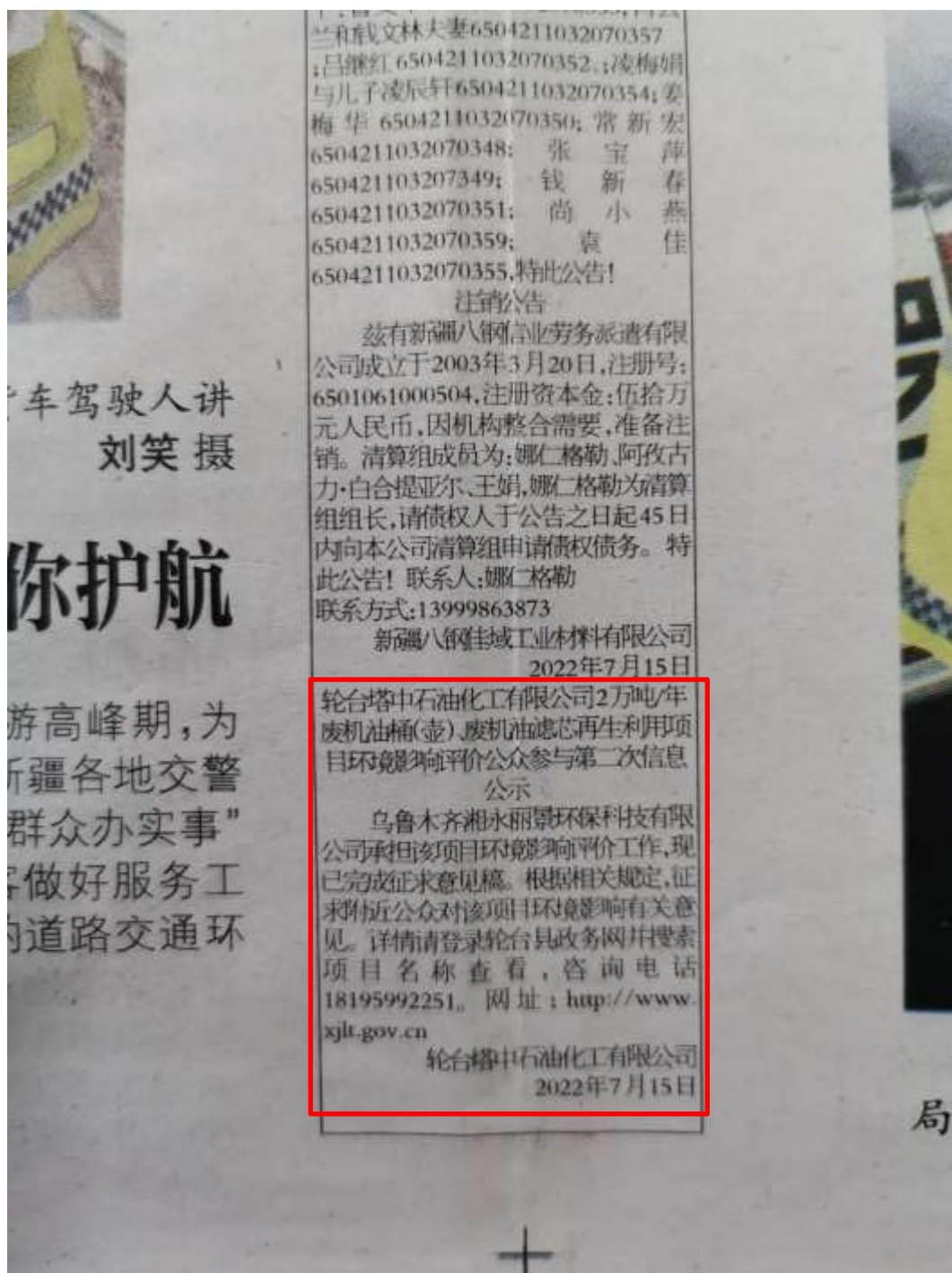
图 3-2 第一次报纸公开照片 (2022.7.15)