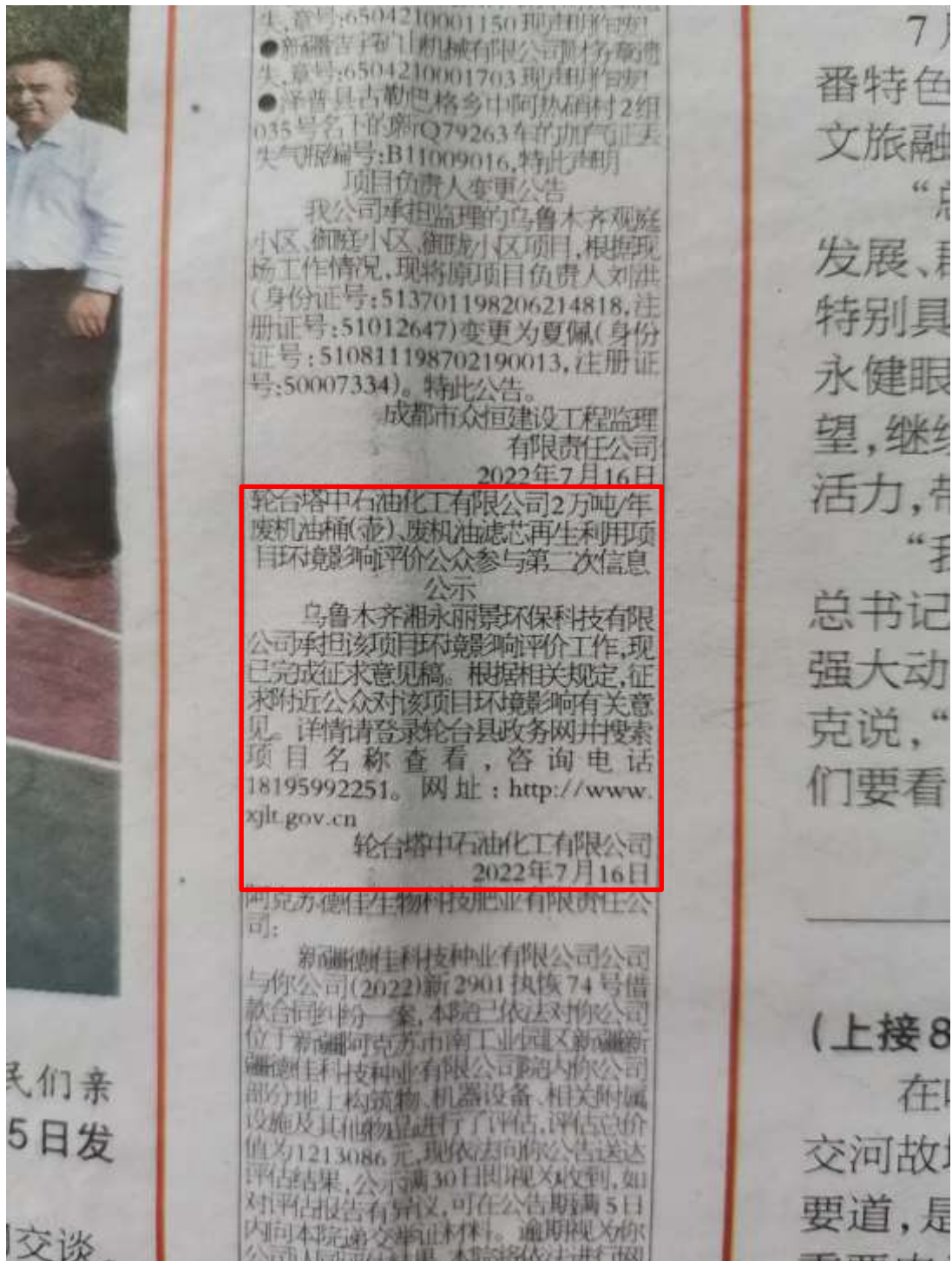
图 3-3 第二次报纸公开照片 (2022.7.16)