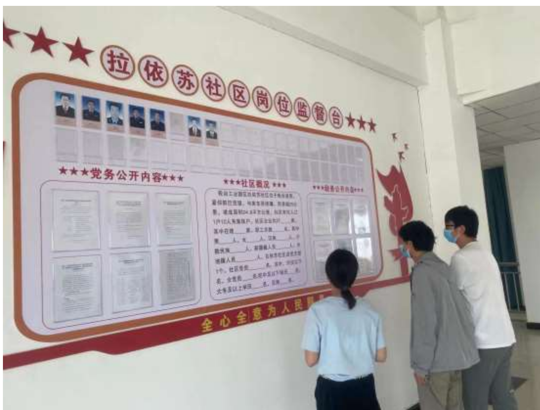
图 3-4 轮台工业园区拉依苏社区公告栏张贴照片