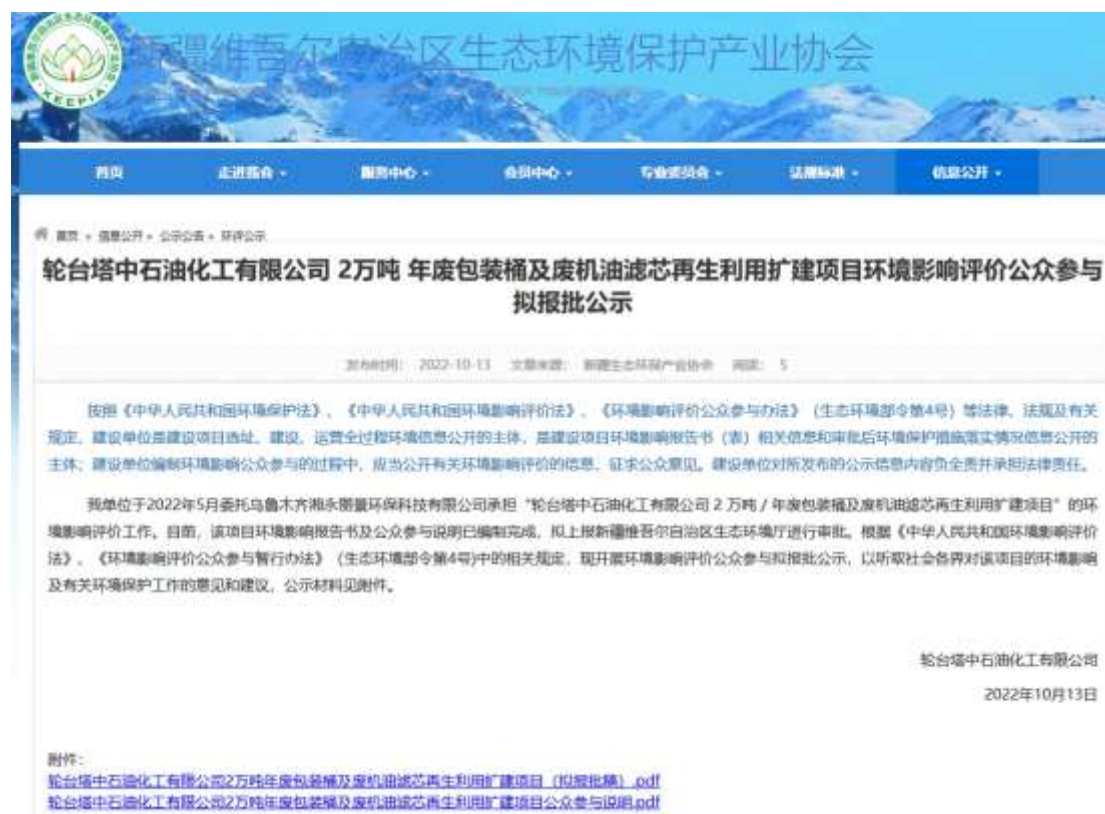
图 6-1 报批前网络公示截图