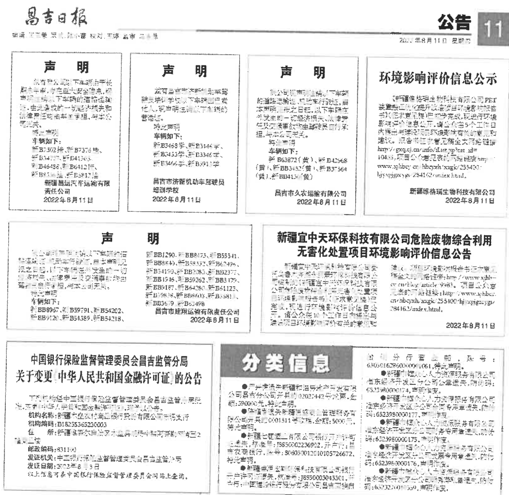
图 2 拟建项目第一次报纸公示截图（8 月 11 日）