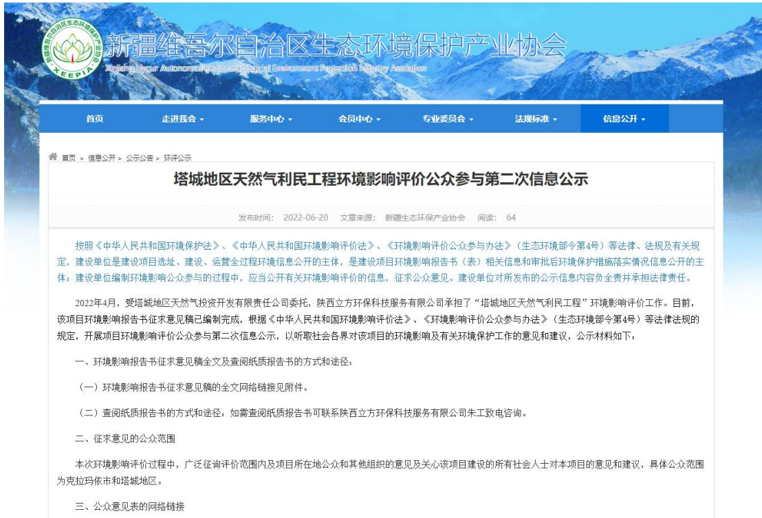
图 3.2-1 征求意见稿网上公示截图