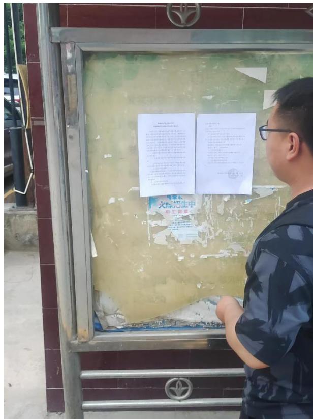
图 3.2-4 张贴公告截图