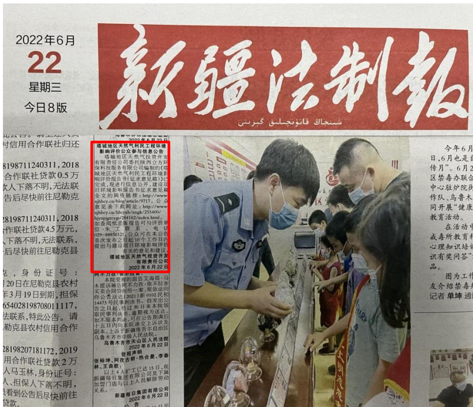
图 3.2-2 项目第一次登报公示截图