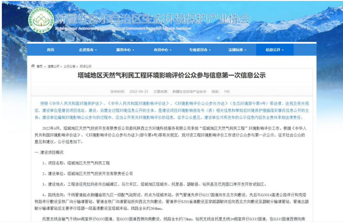
图 2.1-1 本项目首次信息公开网络截图