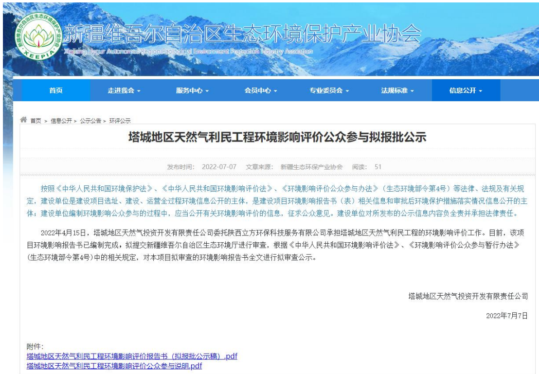
图 6.2-1 报批前公示截图