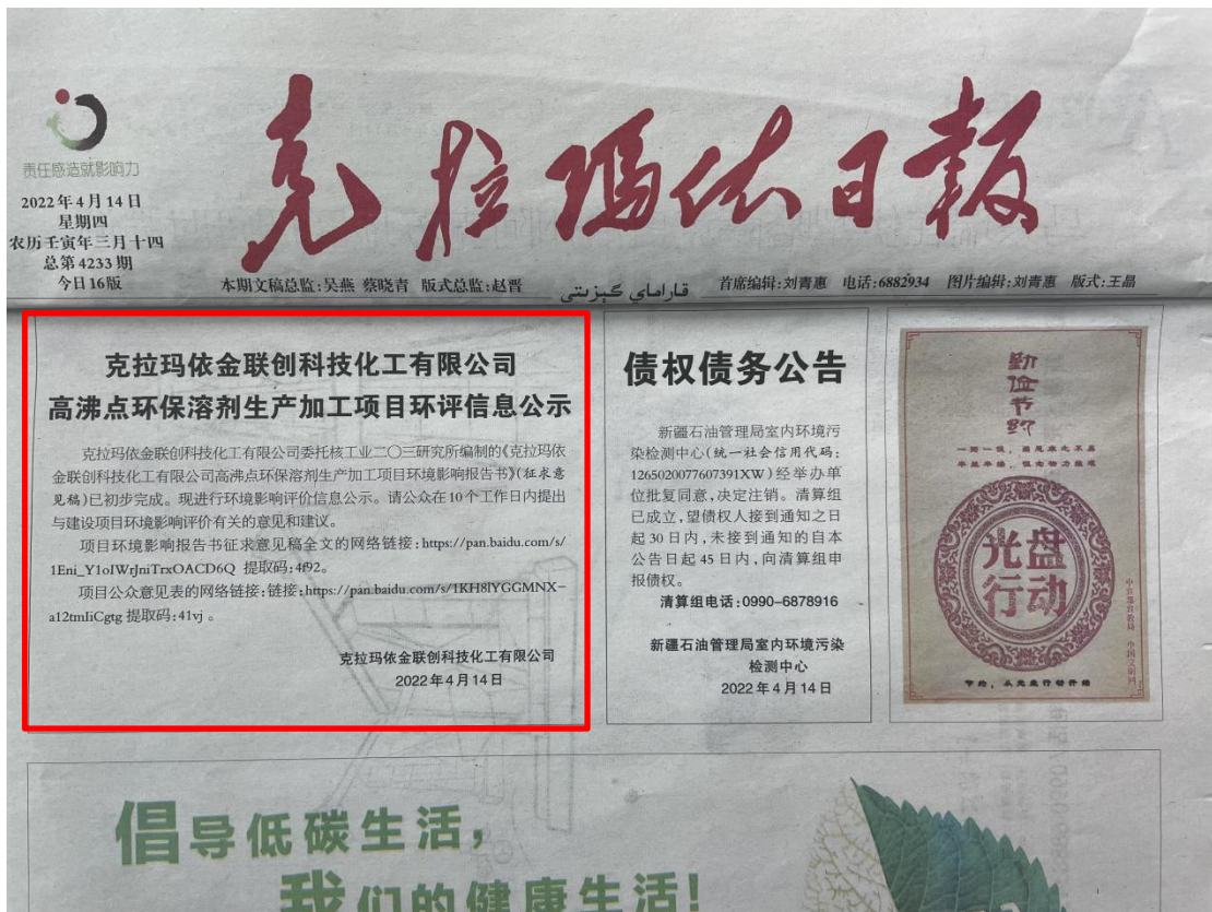
图4 征求意见稿公示（报纸第二次）