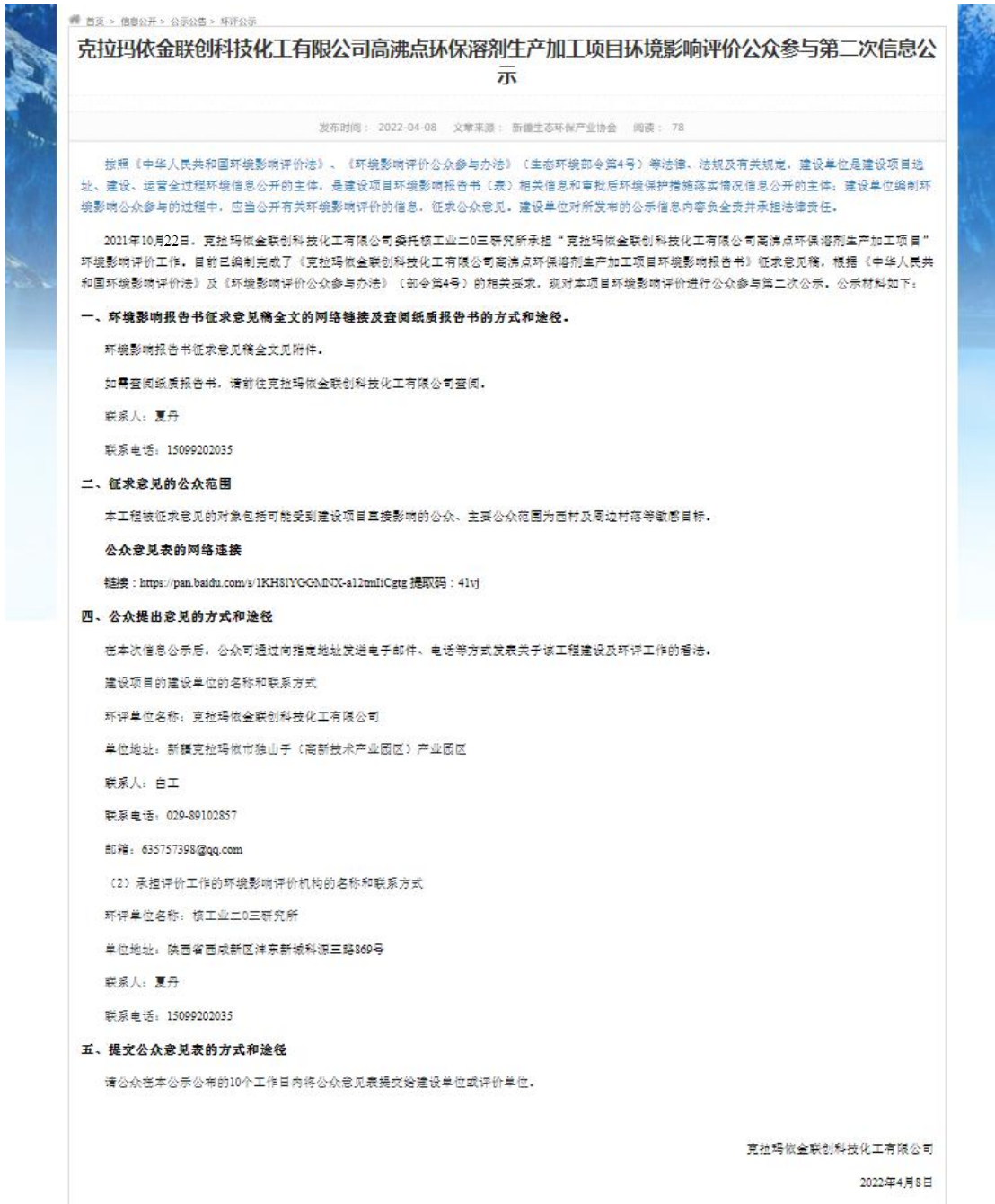
图 2 二次公示（网站公示）