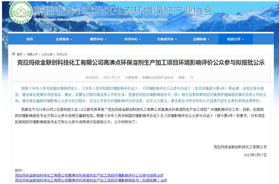
图6 报批前公示（公示网站照片）

网络公示时间为2022年5月17日, ( http://www.xjhbcy.cn./blog/article/9470 ), 公示照片为图6。