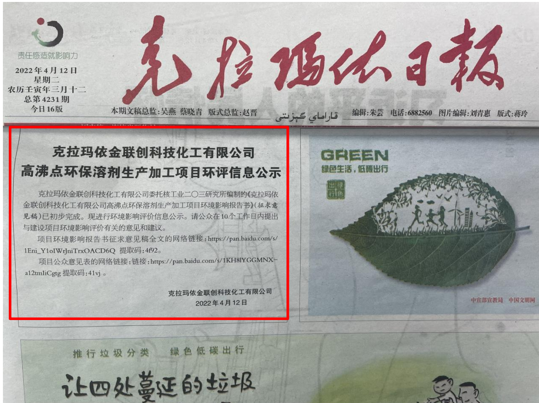
图3 征求意见稿公示（报纸第一次）