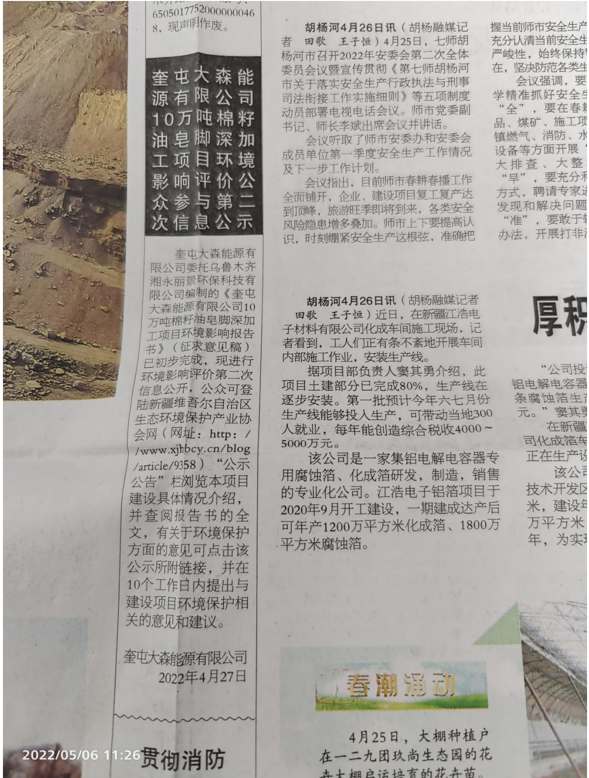
图 3-3 第一次报纸公示截图