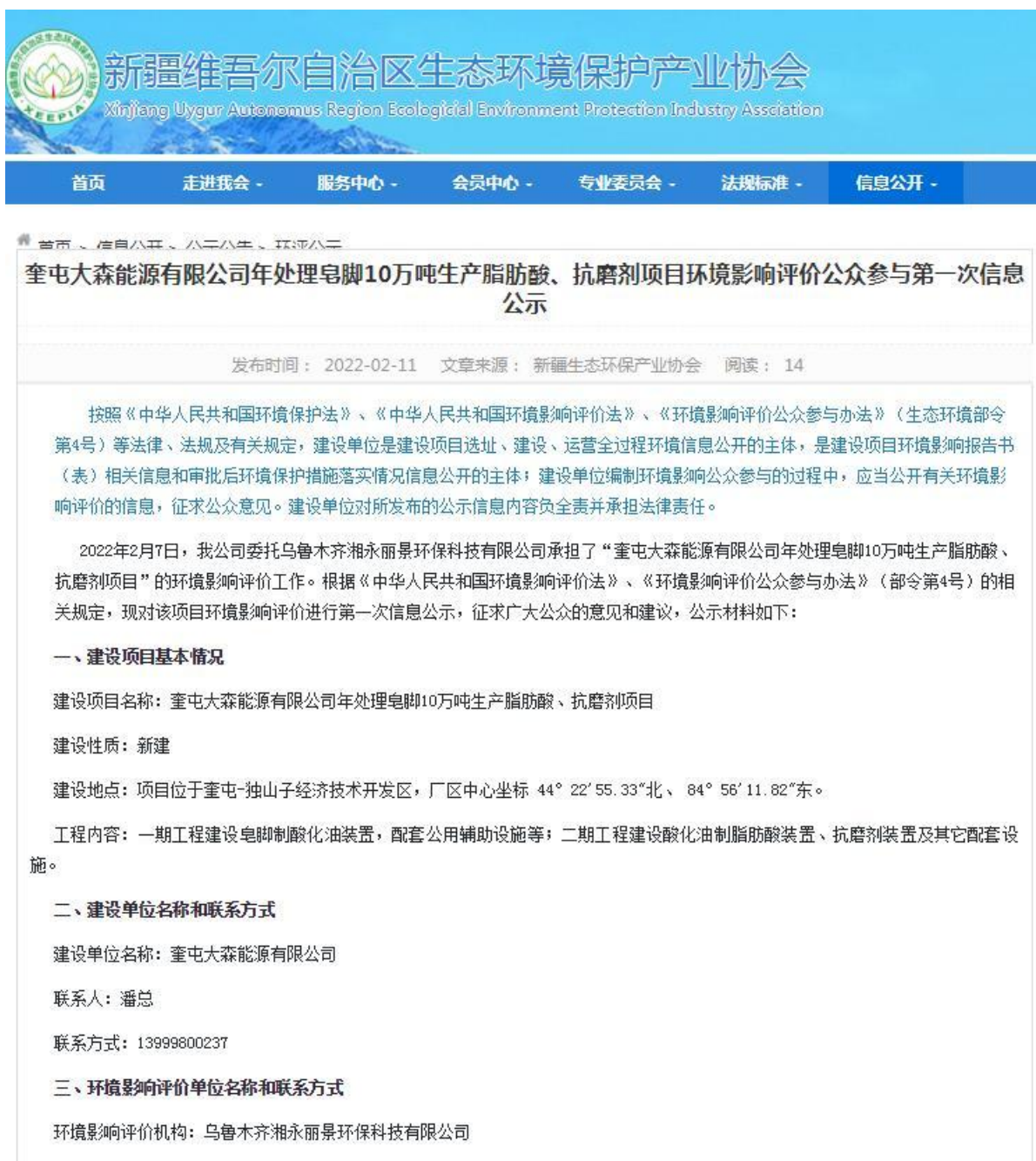
图 2-1 首次网络公示截图