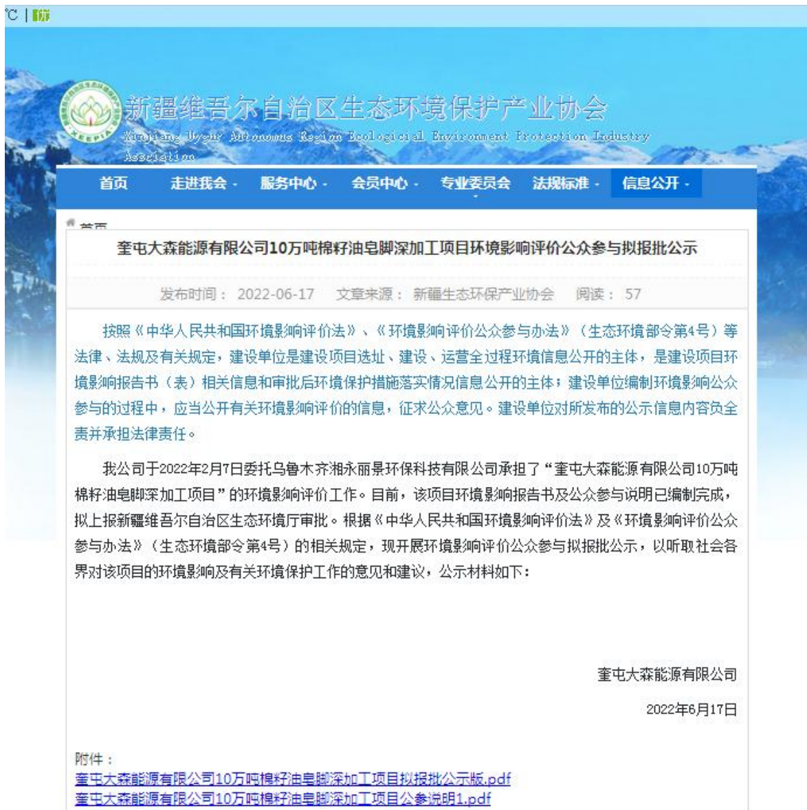
图 5-1 拟报批公示截图