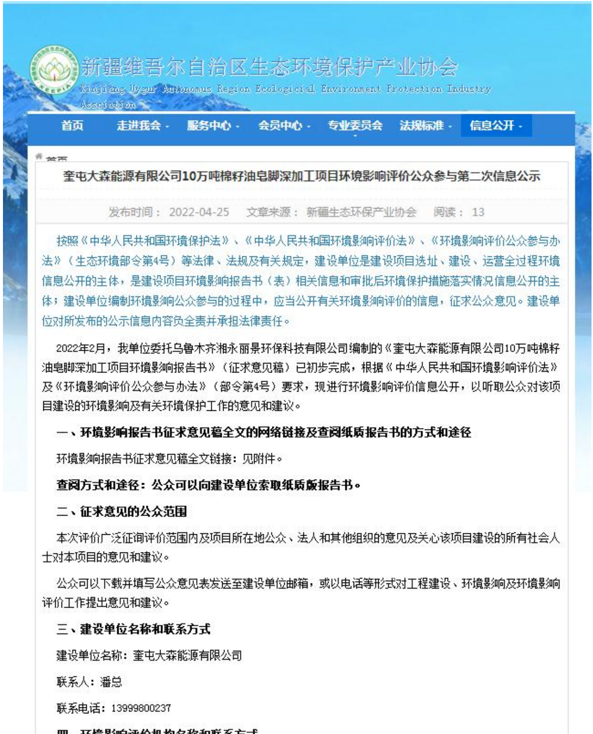
图 3-1 征求意见稿网络公示截图