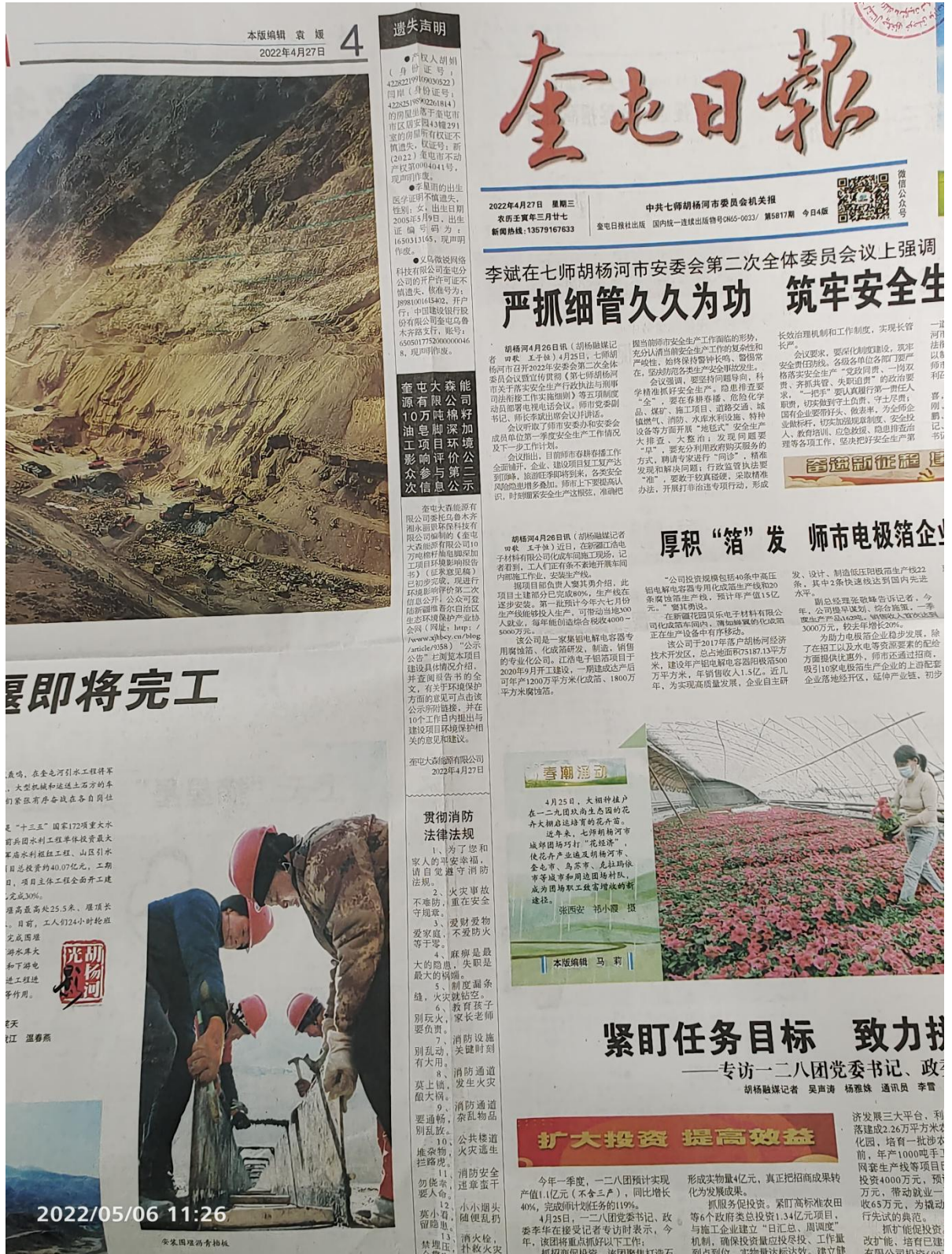
图 3-2 第一次报纸公示截图