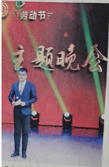
二）、七师中级人民法院民事审