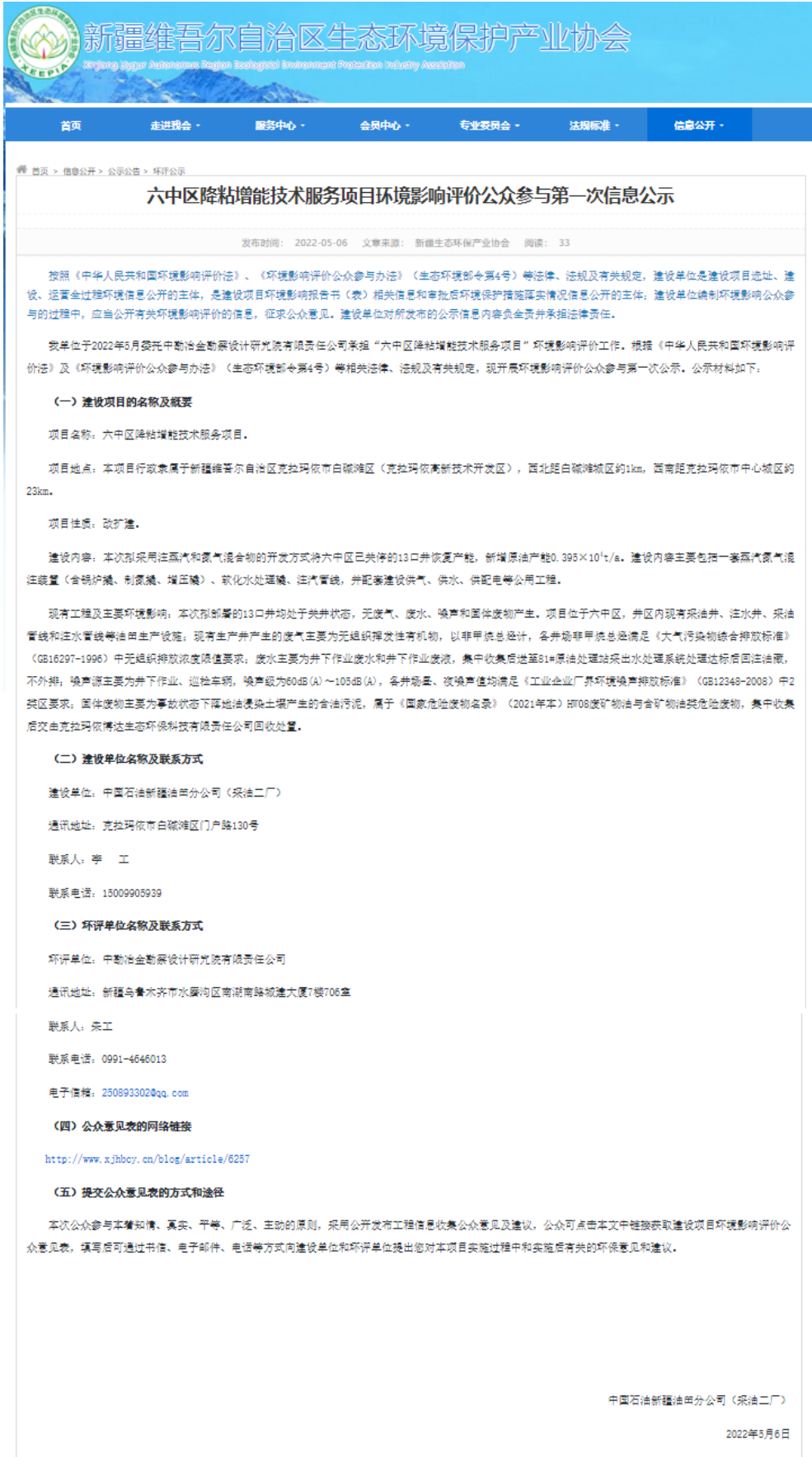
图 2-1 项目公众参与第一次信息公示截图