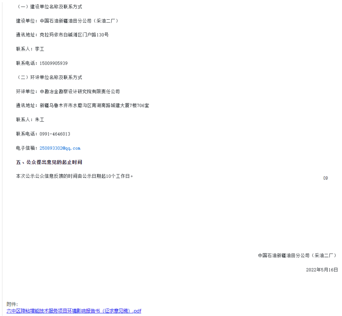
图 3-1 项目公众参与第二次信息公示截图