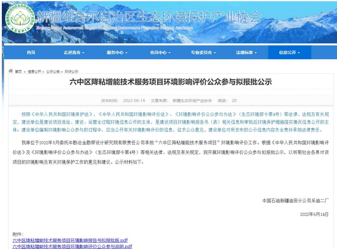
图 6-1 拟报批报公示截图