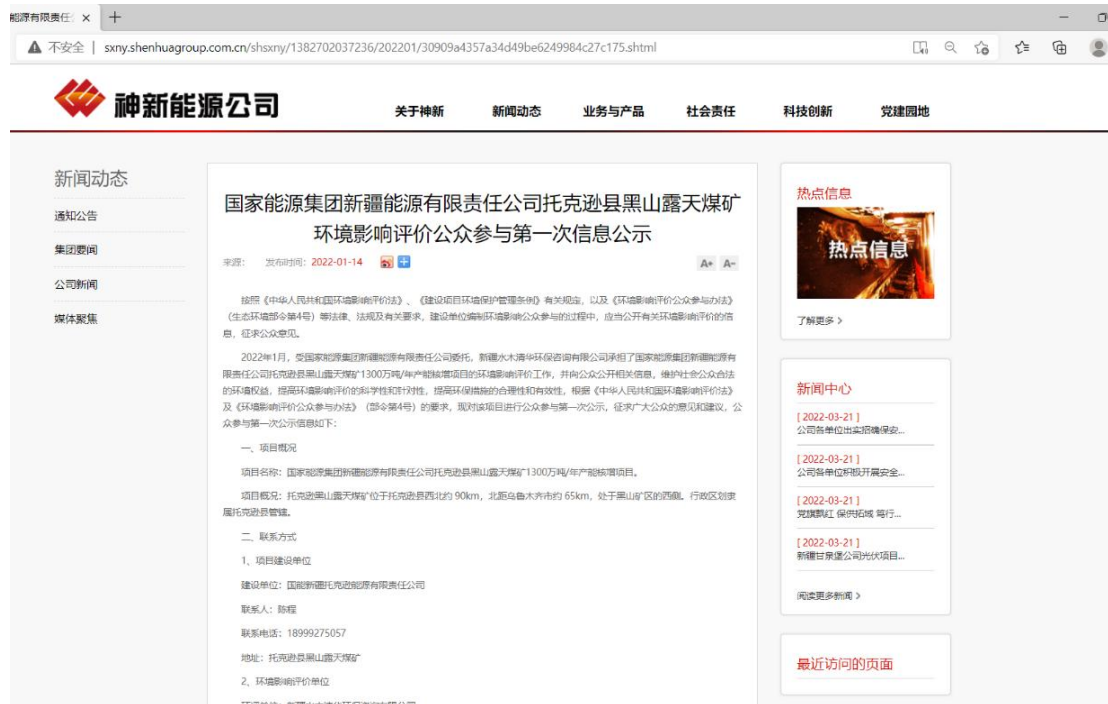
第一次公示信息截图

网络载体选择环评爱好者网。网络公示时间为2022年1月16日。公示期限为10个工作日。公示网址为： http://sxny.shenhuagroup.com.cn/shsxny/1382702037236/202201/30909a4357a34d49be6249984c27c175.shtml 。