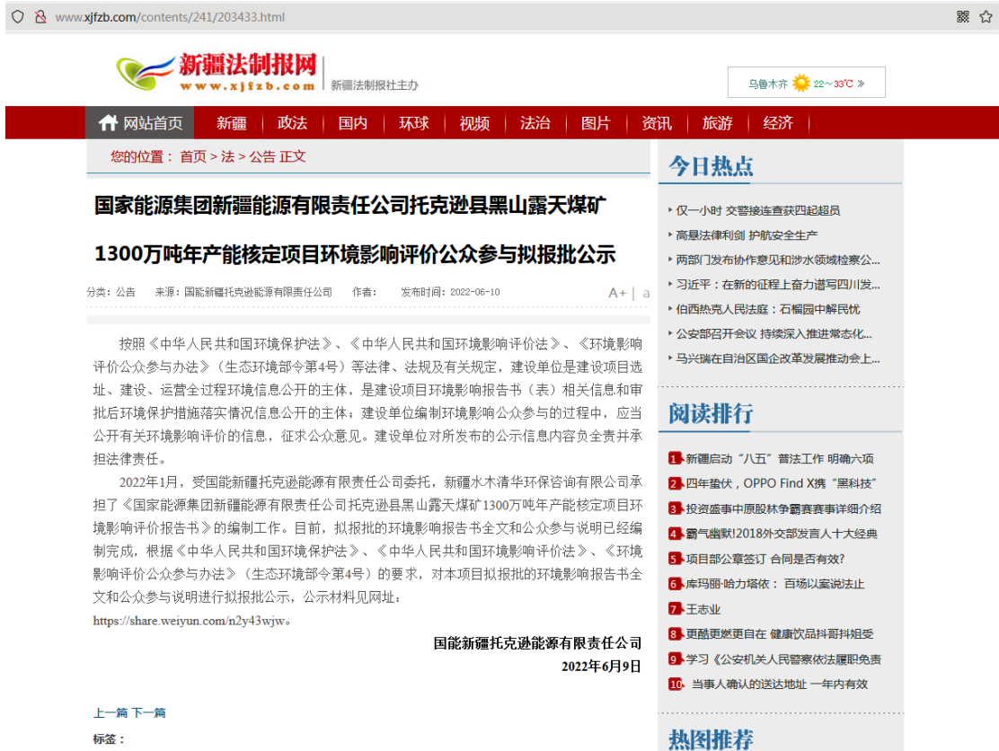
拟报批公示信息截图

网络载体选择新疆法制报网站，公示日期为2022年6月10日，公示期限为10个工作日。公示网址为： http://www.xjfzb.com/contents/241/203433.html 。