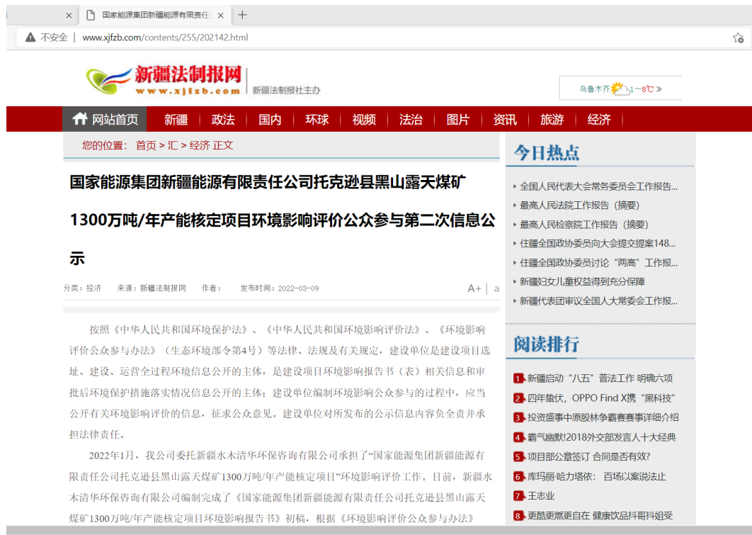
第二次公示信息截图

网络载体选择新疆法制报网站。网络公示时间为 2022 年 3 月 9 日，公示期限为 10 个工作日。公示网址为： http://www.xjfb.com/contents/255/202142.html 。