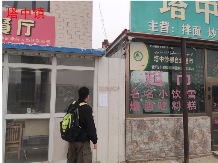
图 3-4 2022 年 4 月 17 日村庄张贴公示情况

我公司于 2022 年 4 月 17 日在周边村庄张贴了项目环境影响报告书公示信息，现场公示照片见图 3-4。