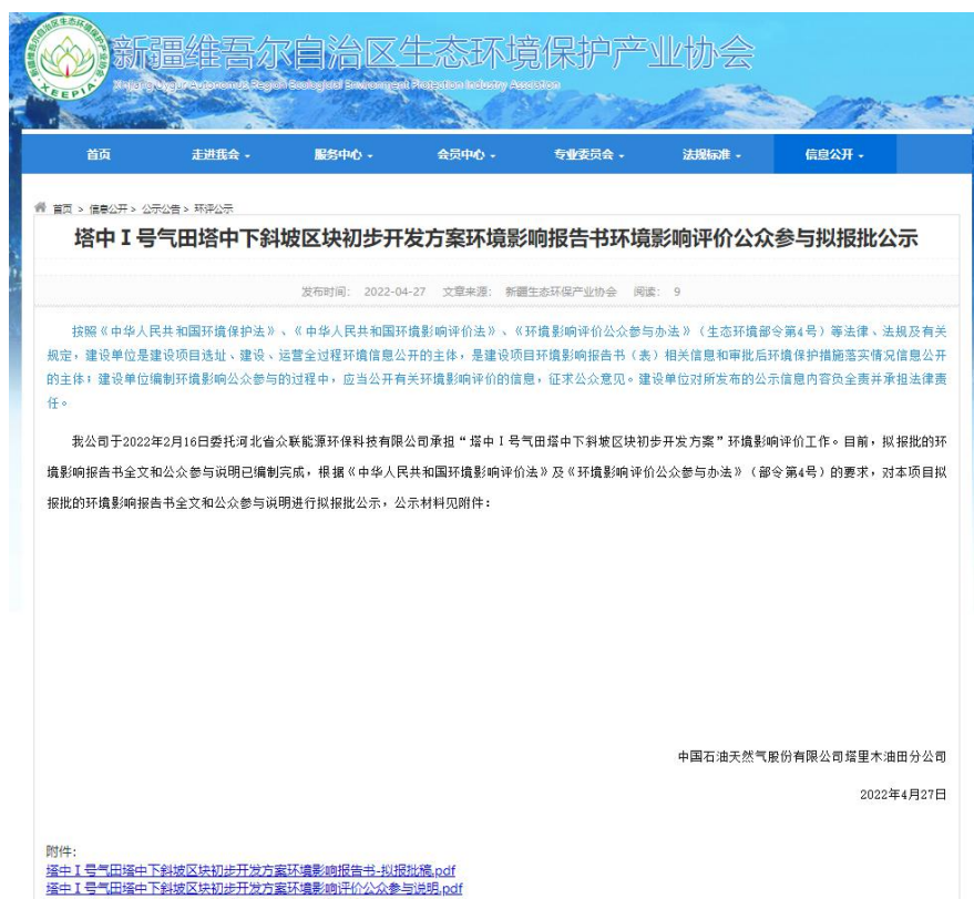
图 6-1 报批前网络公示截图

本次报批前公开方式为网络公开，公开时间为2022年4月27日，公开网站为新疆维吾尔自治区生态环境保护产业协会网站( http://www.xjhbcy.cn )，该网站可以上传并公开项目环境影响报告书全本，选择该网站进行公示符合《环境影响评价公众参与办法》要求。报批前网络公示截图见图6-1。