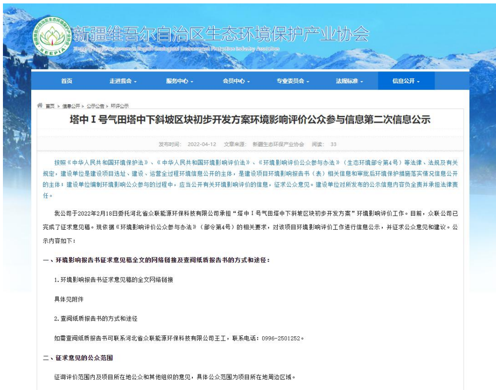
图 3-1 第二次信息公示情况

我公司在新疆维吾尔自治区生态环境保护产业协会网站 ( http://www.xjhbcy.cn/blog/article/9249 ) 上发布了征求意见稿公示信息，对环境影响报告书征求意见稿全文进行公开，公示时限为 10 个工作日，网站第二次公告截图见图 3-1。