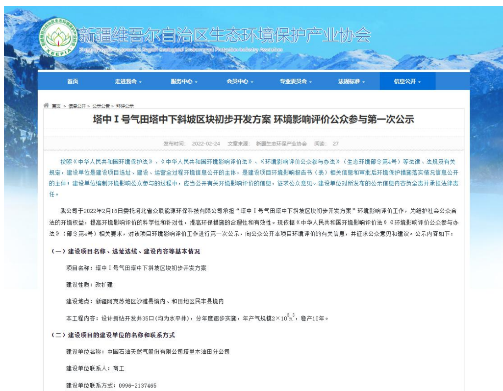
图 2-1 第一次信息公示情况

2022 年 2 月 24 日，我公司在新疆维吾尔自治区生态环境保护产业协会网站 ( http://www.xjhbcy.cn/blog/article/8933 ) 上发布了第一次公示信息。首次公示网络截图见图 2-1。