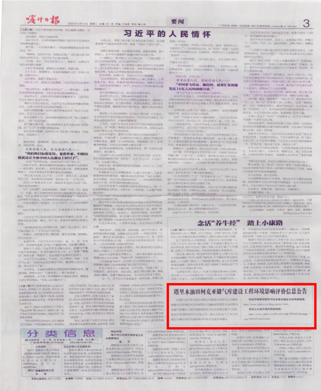
图3 第一次报纸公示——喀什日报公示页面