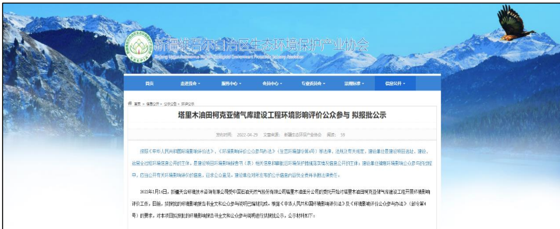
图 6 征求意见稿网络公示截图