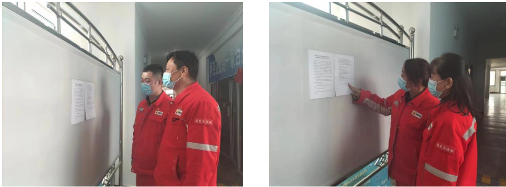
图 5 本项目张贴公示栏照片