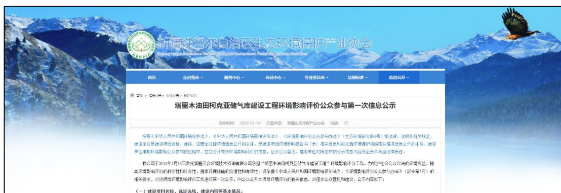
图 1 本项目第一次网络公示截图