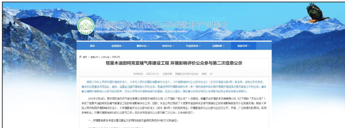
图 2 本项目征求意见稿网络公示截图