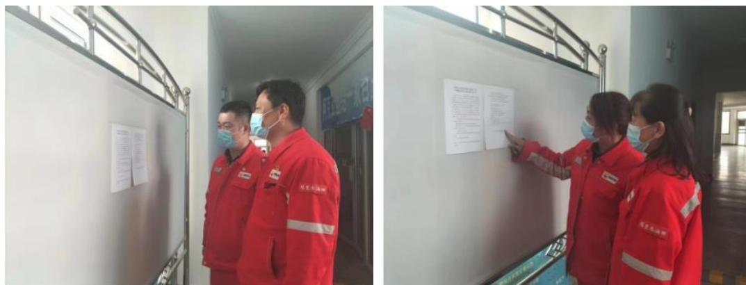
图 5 本项目张贴公示栏照片