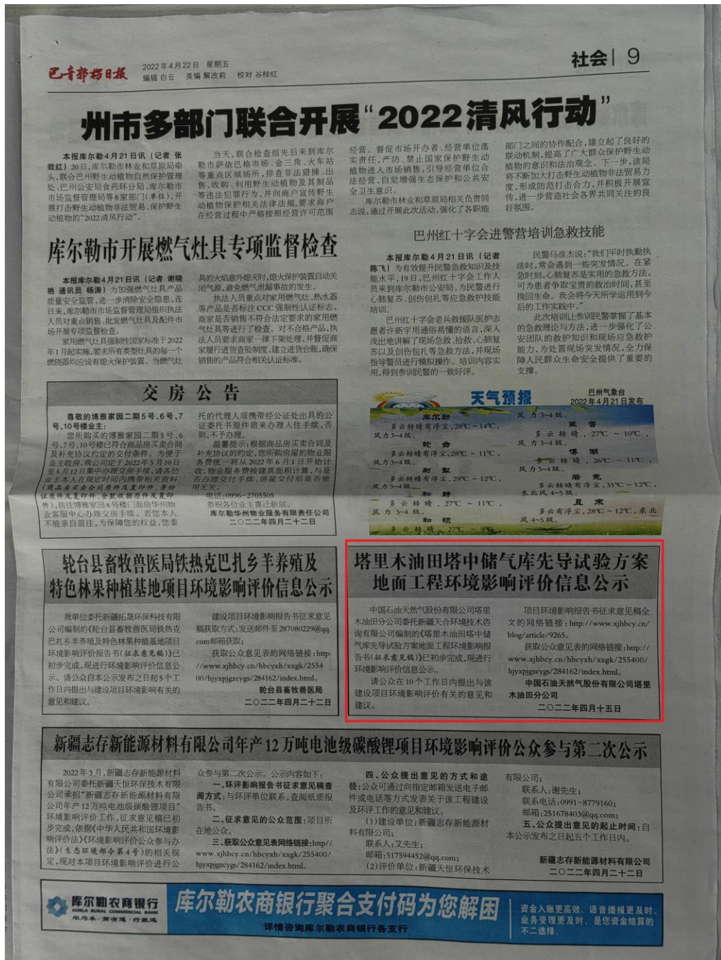
图 4 本项目《巴州日报》第二次报纸公示照片

中国石油天然气股份有限公司塔里木油田分公司于 2022 年 4 月 22 日，在《巴州日报》对项目的环境影响评价信息进行了第二次公告。载体选择符合《环境影响评价公众参与办法》要求。征求意见二次报纸公示截图见图 4。