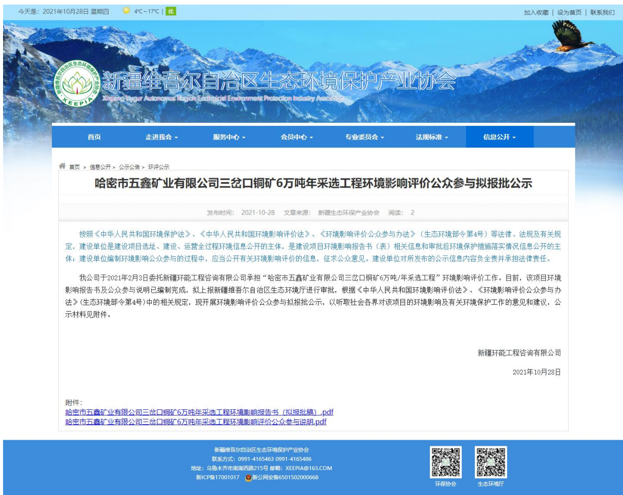
图 6 报批前公示截图