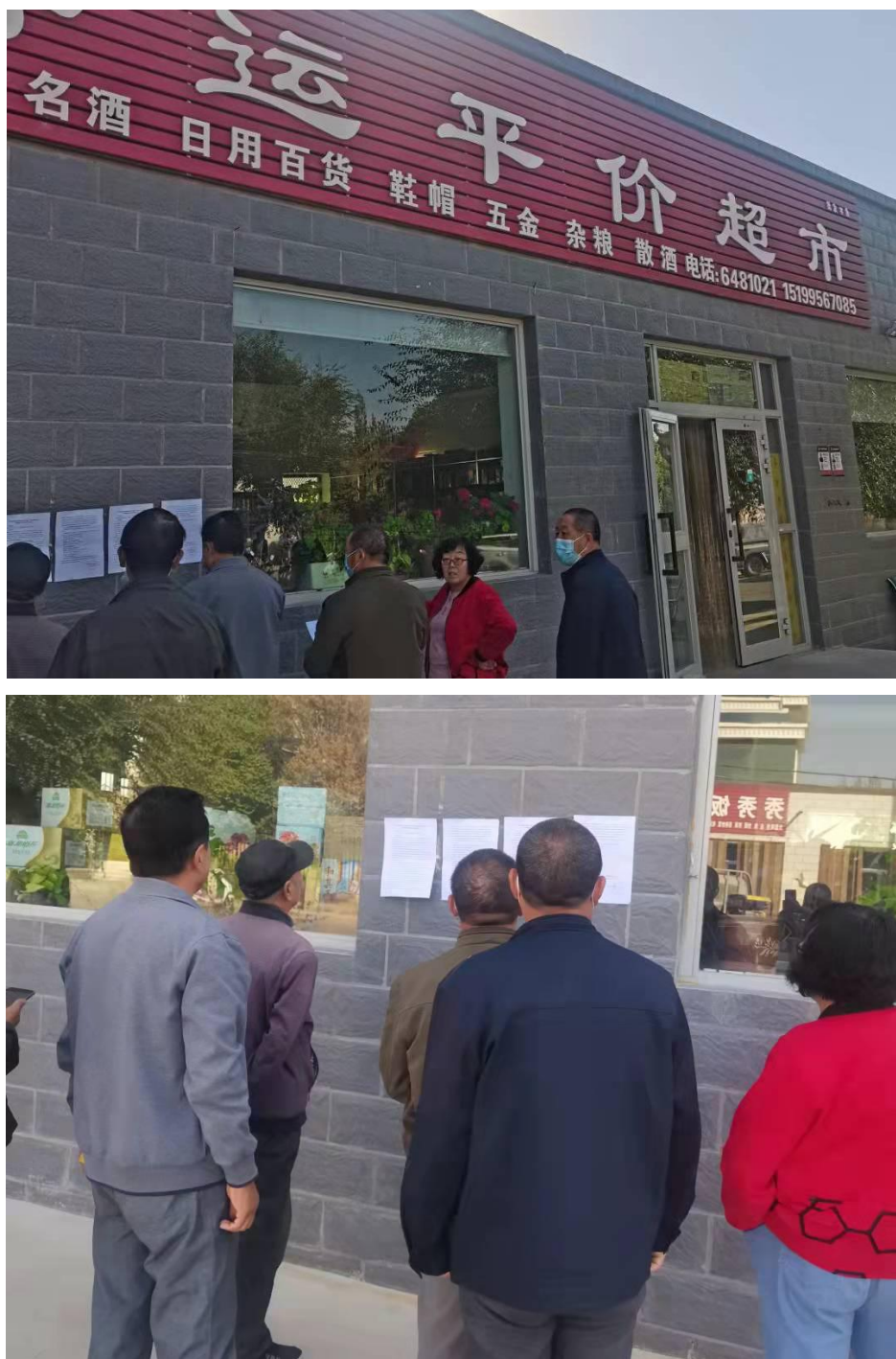
图5 张贴告示公示照片