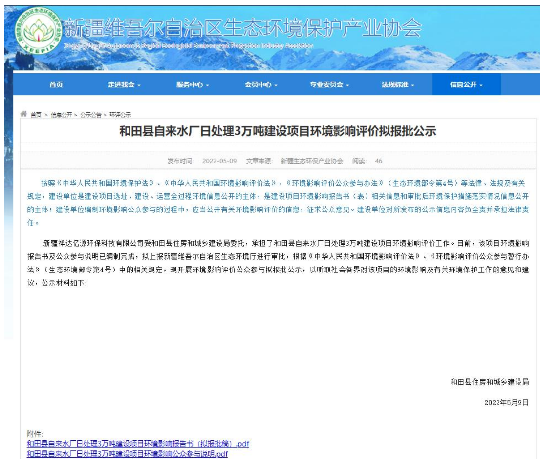
图6-1 拟报批公示网络公示图