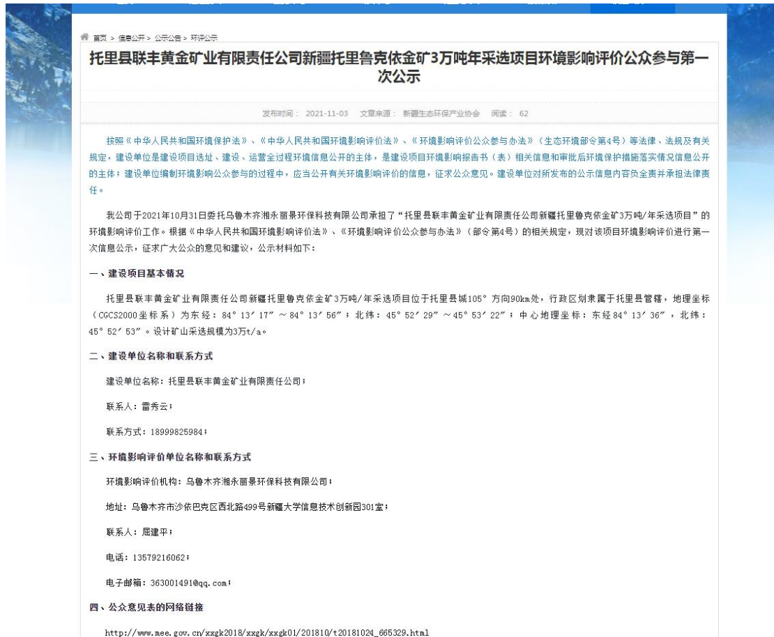
图 2.2-1 网站第一次公示