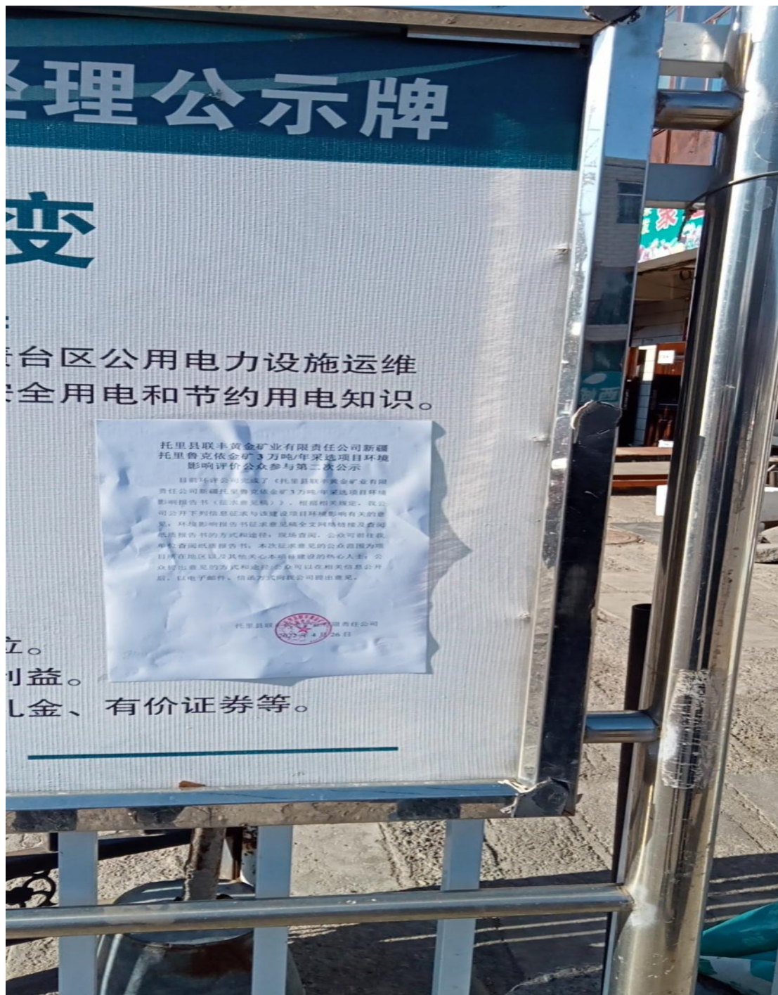
图 3.2-4 张贴公示照