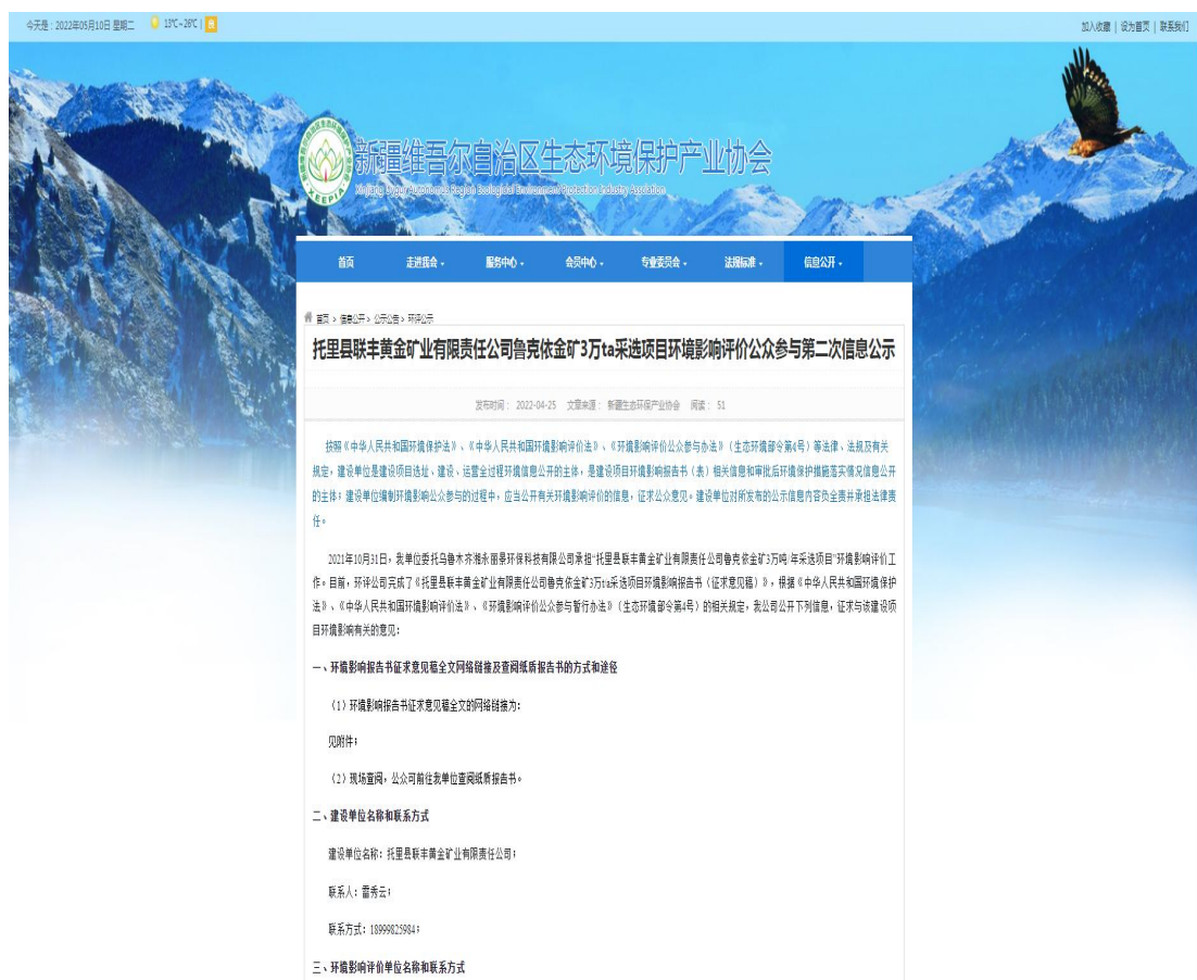
图 3.2-1 网站第二次公示

我公司于 2022 年 4 月 25 日在新疆维吾尔自治区生态环境保护产业协会 http://www.xjhbcy.cn/blog/article/8298 发布了《托里县联丰黄金矿业有限责任公司新疆托里鲁克依金矿 3 万吨/年采矿项目环境影响评价公众参与第二次信息公示》，网站公示从 2022 年 4 月 25 日起至 5 月 10 日截止。公示图片见图 3.2-1。载体选择符合《环境影响评价公众参与办法》要求。