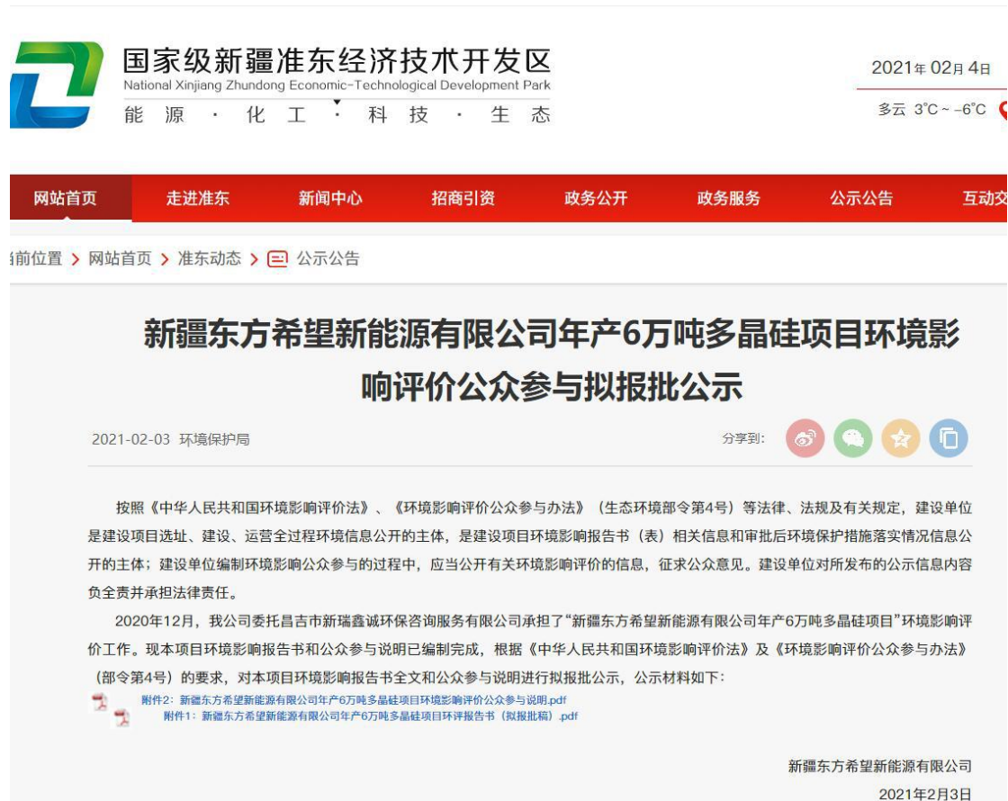
图 6-1 本项目拟报批网络公示截图

因为本项目未收到公众对环境影响方面提出的反馈意见, 所以未开展公众座谈会、听证会、专家论证会等深度公众参与, 符合《环境影响评价公众参与办法》要求。