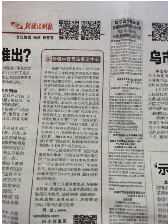
图 3-2 本项目第一次报纸公示截图