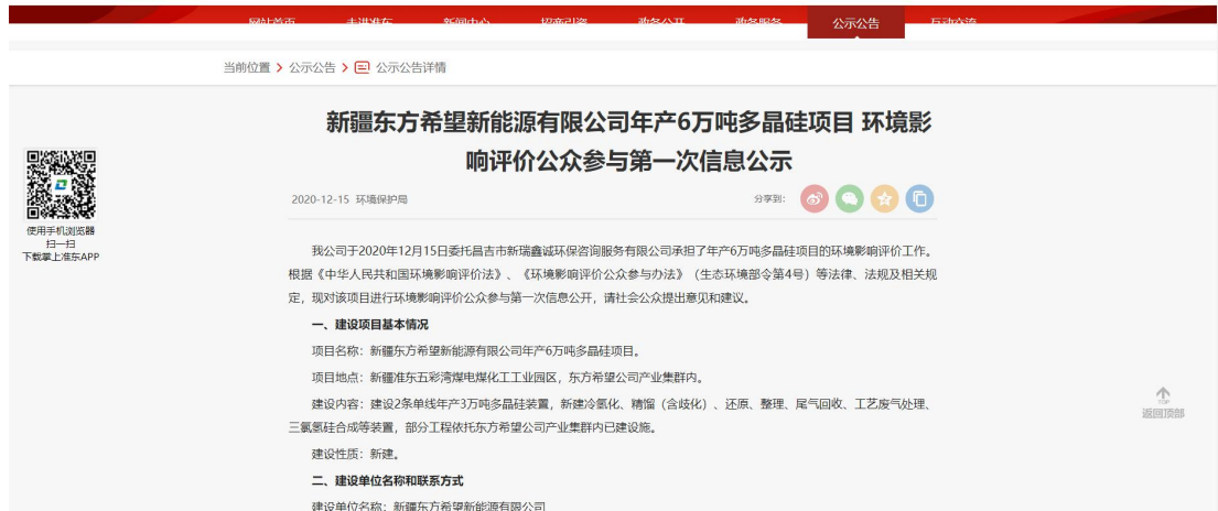
图 2-1 本项目第一次网络公示截图