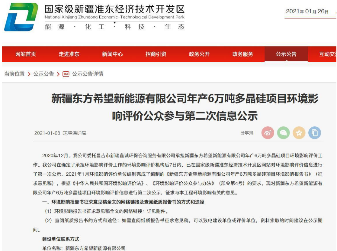
图 3-1 本项目征求意见稿网络公示截图

5E5%2585%25AC%25E7%25A4%25BA%25E5%2585%25AC%25E5%2591%258A%25E8%25AF%25A6%25E6%2583%2585&cid=79&newsId=2456&newsInfoURL=/zw/details&banner=0), 载体选择符合《环境影响评价公众参与办法》要求。公示截图请见图 3-1。