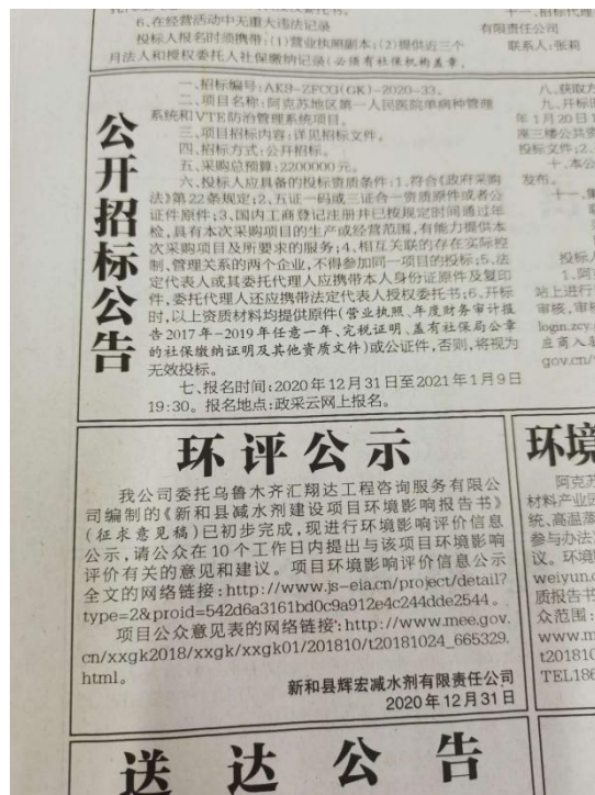
本项目第一次报纸公示截图