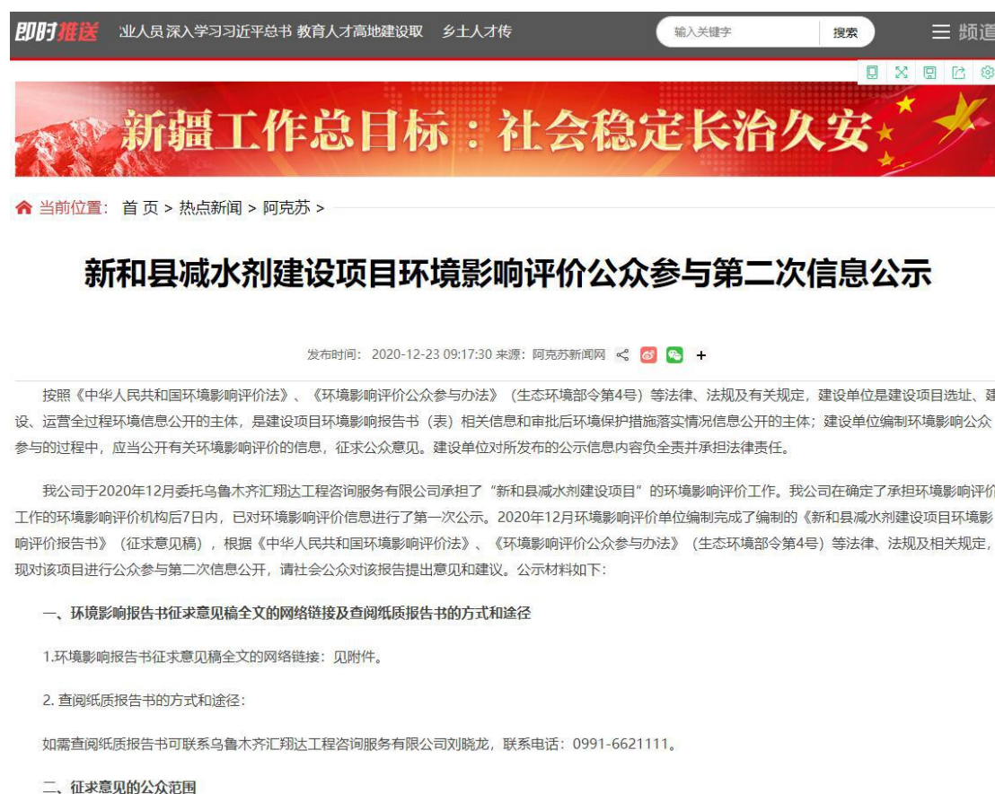
图 3-1 本项目征求意见稿网络公示截图

( http://www.aksxw.com/aksxw/content/2020-12/23/content_1142497.html ), 载体选择符合《环境影响评价公众参与办法》要求。公示截图请见图3-1。