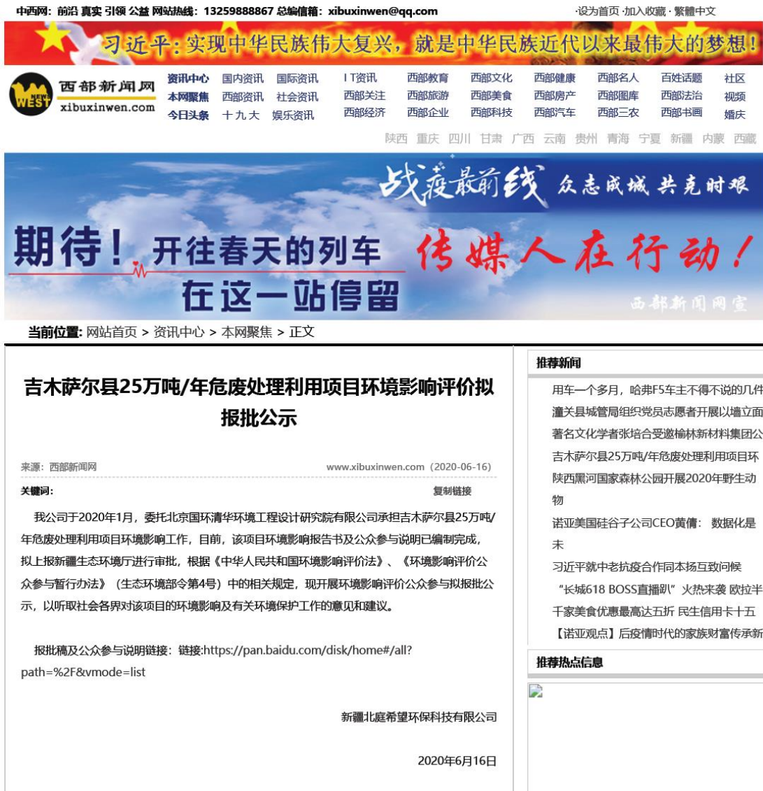
图 5 报告书全文和公众参与说明公开页面截图