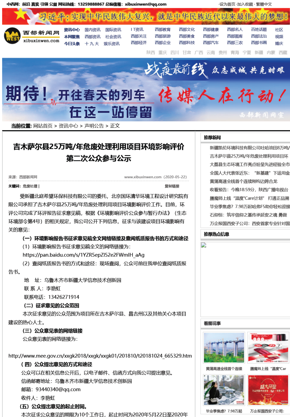
图 2 征求意见稿网络公示页面截图