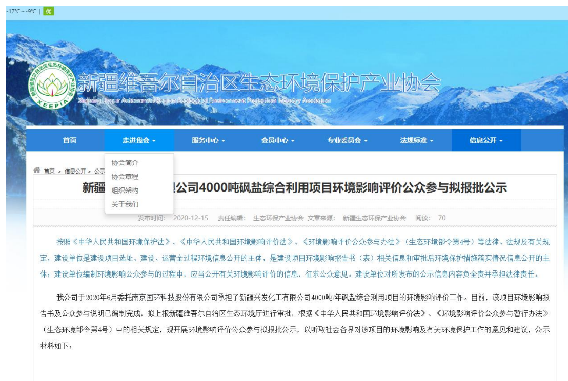
图 6-1 报批前网络公示截图

在新疆环保领域有很大的知名度，访问流量较大，且可以上传并公开项目环境影响报告书全本，选择该网站进行公示符合《环境影响评价公众参与办法》要求。报批前网络公示截图见图 6-1。