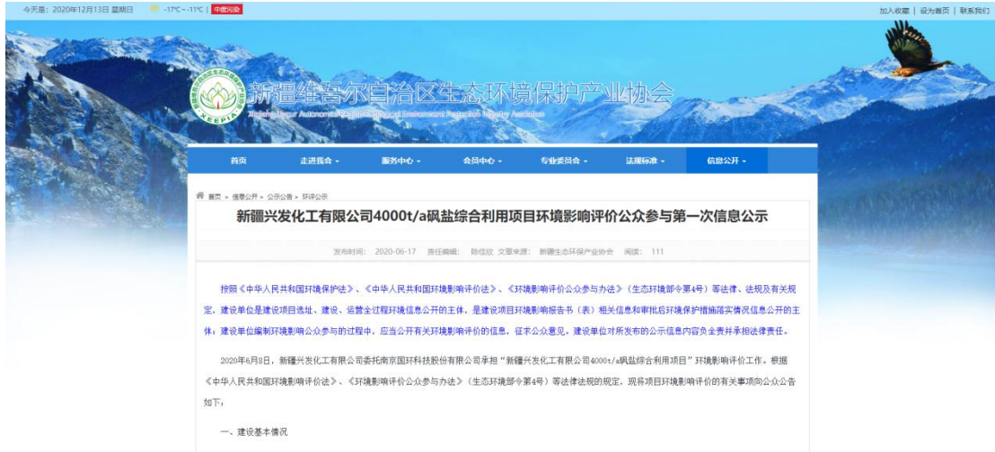
图 2-2 环境影响评价第一次公示网页截图