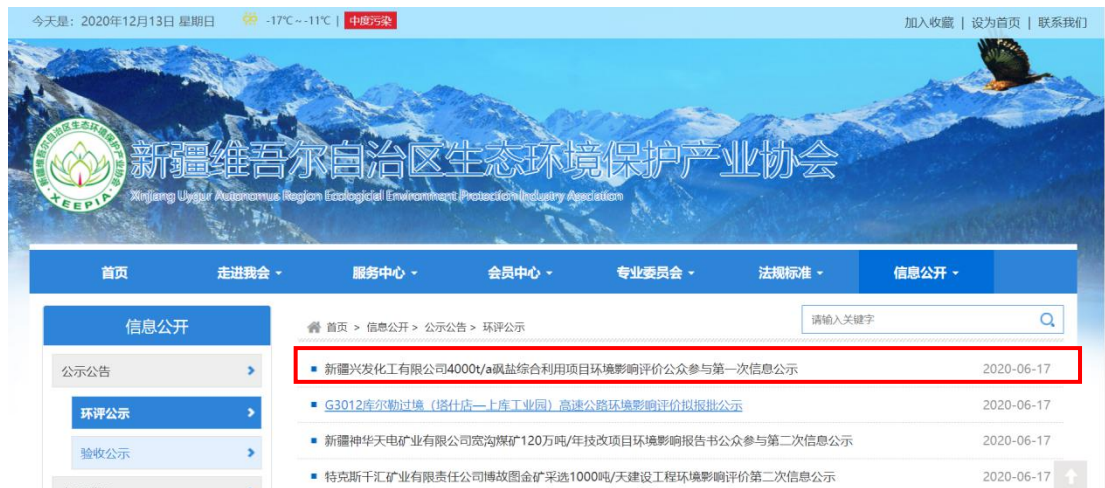
图 2-1 环境影响评价第一次公示网页截图