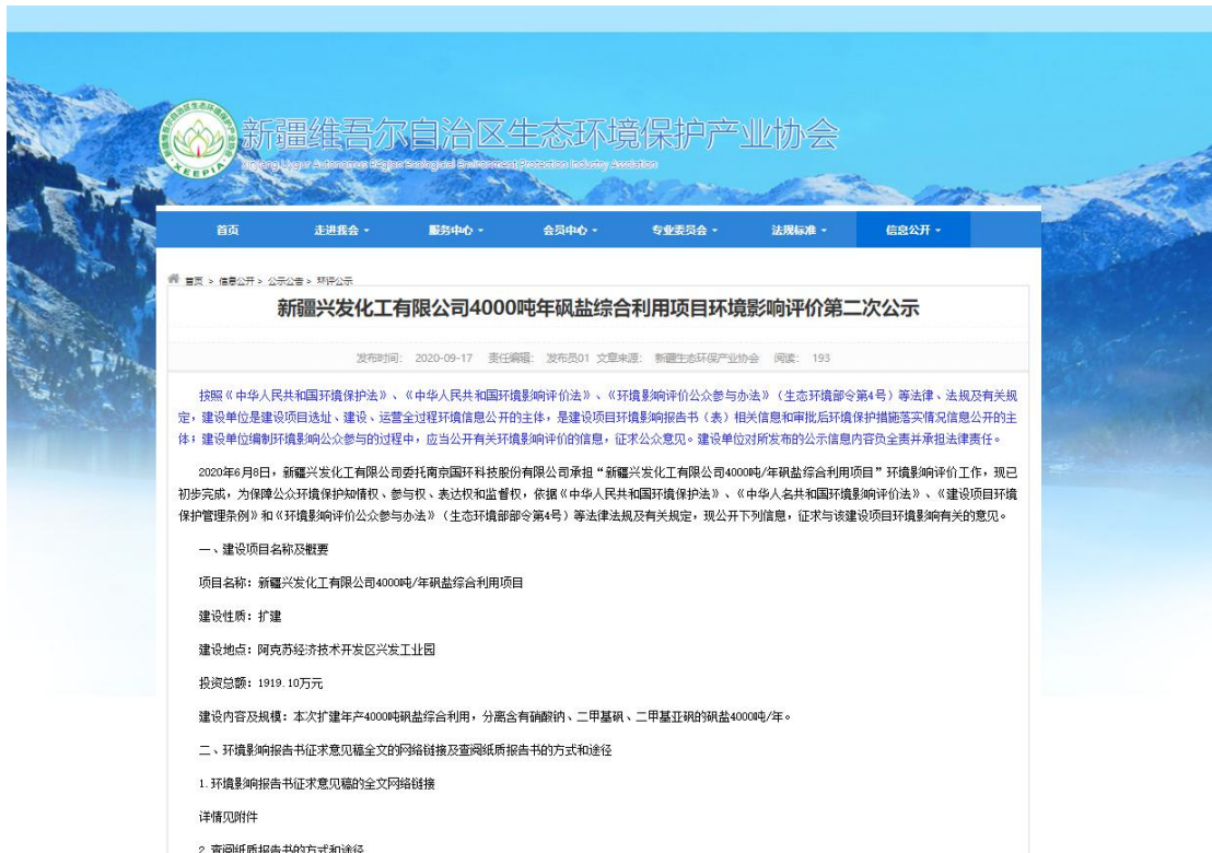
图 3-2 环境影响评价第二次公示