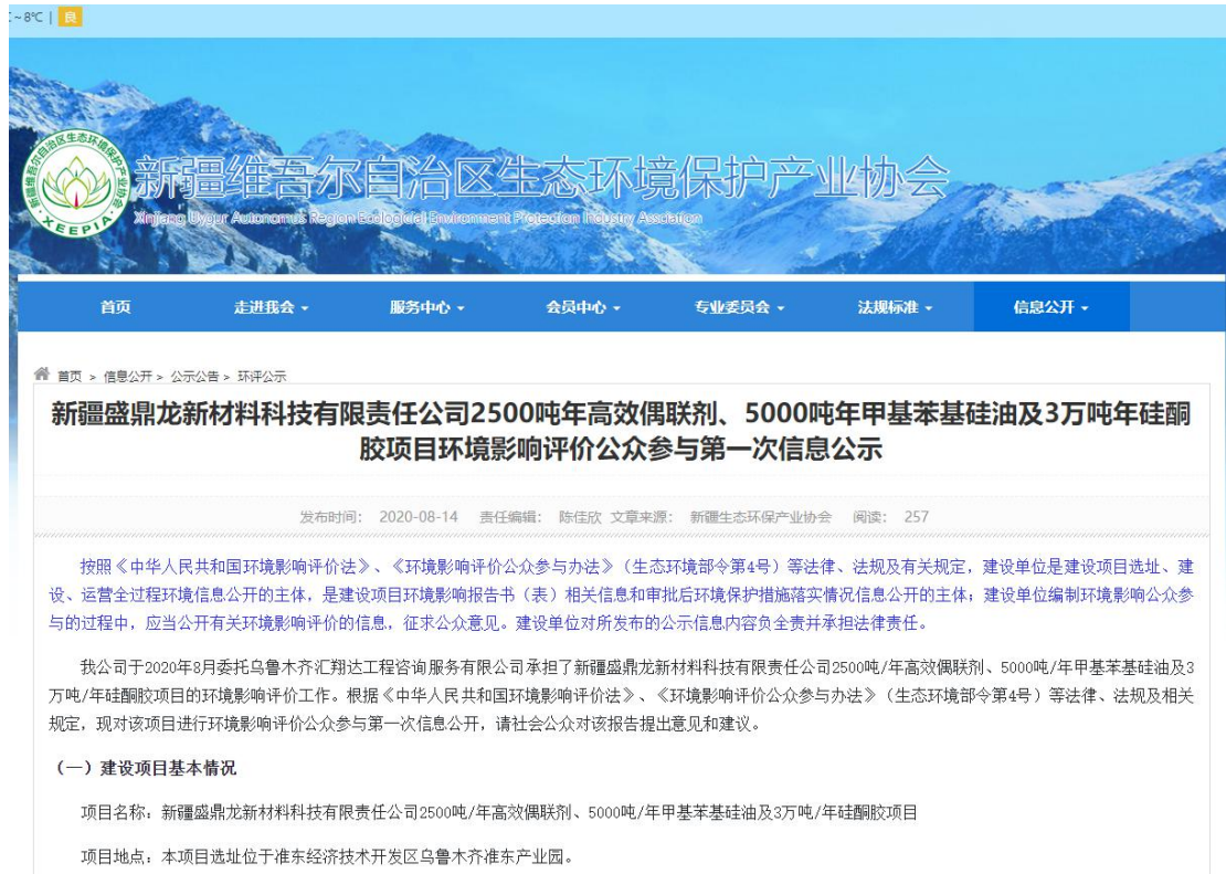
图 2-1 本项目第一次网络公示截图