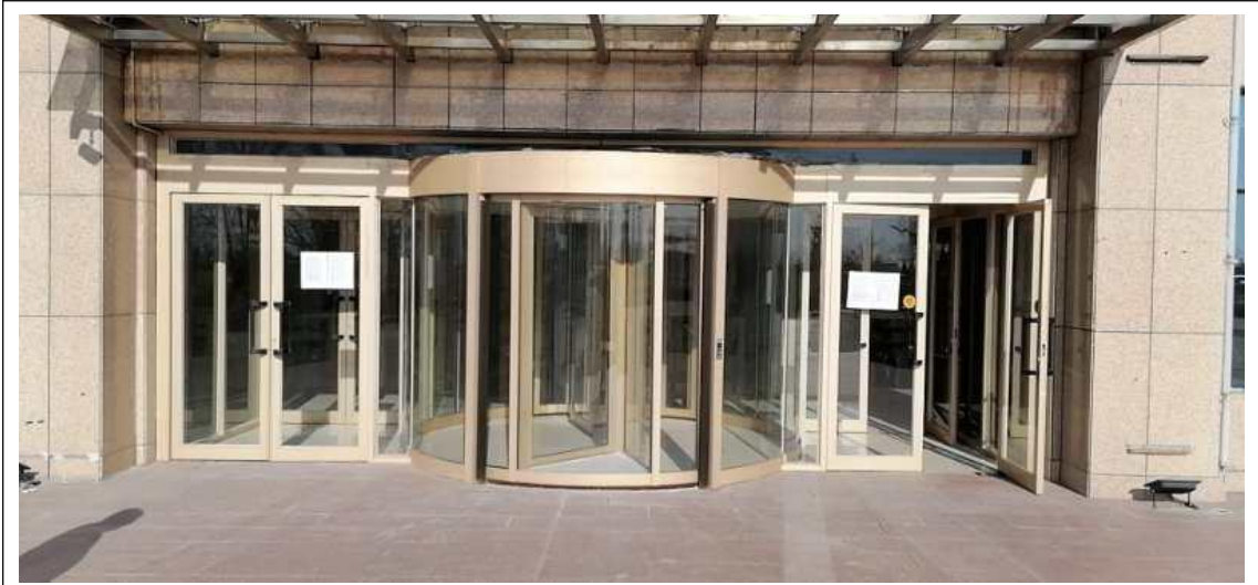
图3-4 征求意见稿张贴公告公示照片