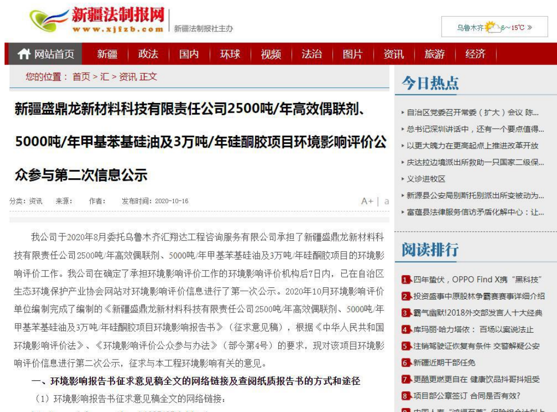
图3-1 本项目征求意见稿网络公示截图

( http://www.xjfb.com/contents/254/188218.html ), 载体选择符合《环境影响评价公众参与办法》要求。公示截图请见图3-1。