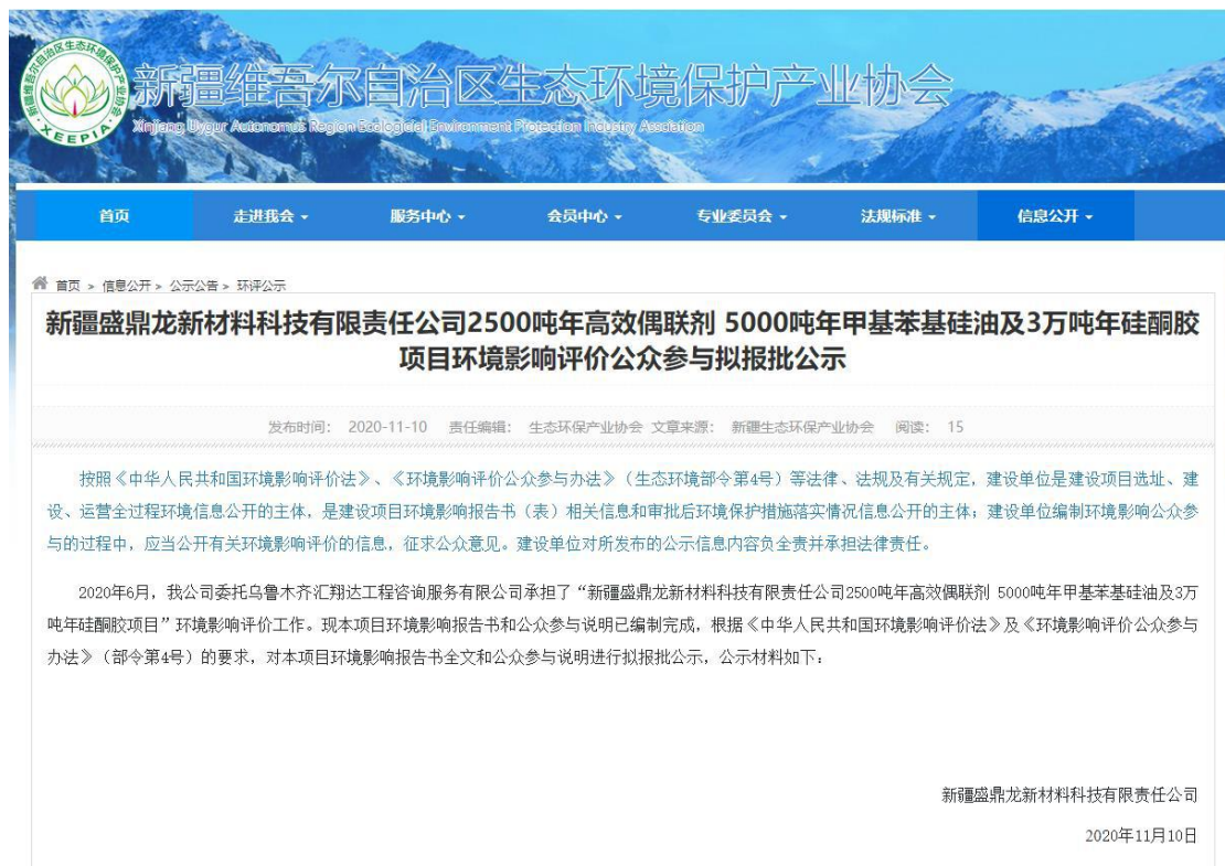
图 6-1 本项目拟报批网络公示截图

因为本项目未收到公众对环境影响方面提出的反馈意见, 所以未开展公众座谈会、听证会、专家论证会等深度公众参与, 符合《环境影响评价公众参与办法》要求。