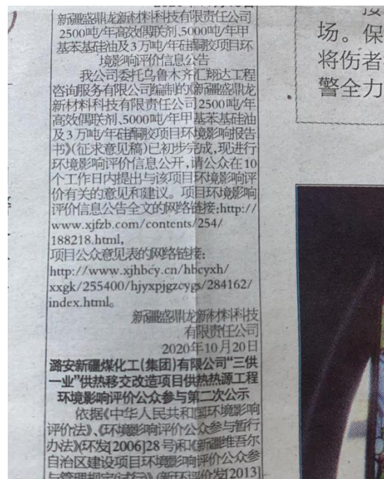
本项目第二次报纸公示截图