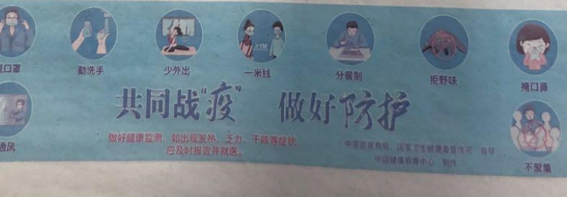
图 3.2-2 本项目第一次报纸公示照片