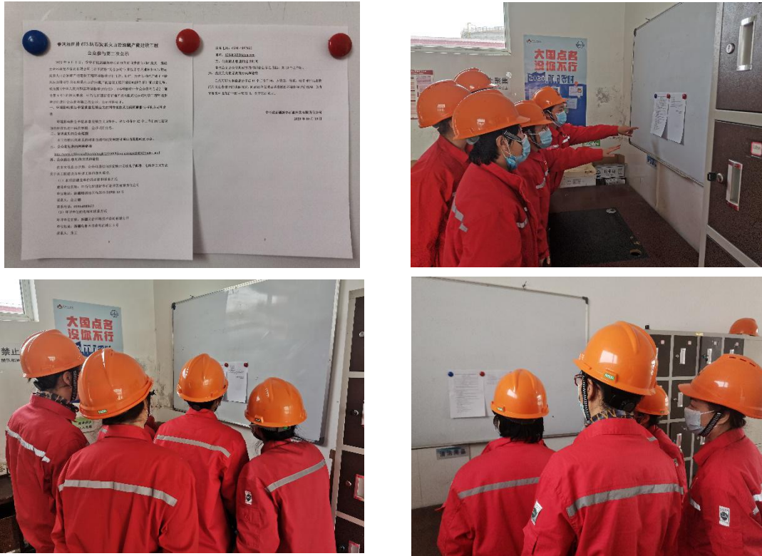
图 3.2-4 本项目张贴公示栏照片