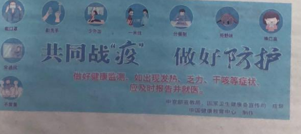
图 3.2-3 本项目第二次报纸公示照片

债权债务公告 克拉玛依市曙光教育培训中心(统一社会信用代码:5265020091940814M)经会员大会表决通过,决定注销,清算组已成立,望债权人接到通知之日起三十日内,未接到通知的自本公告发布之日起四十五日内,向清算组申报债权债务。清算组电话:13579506425。 克拉玛依市曙光教育培训中心 2020年10月28日