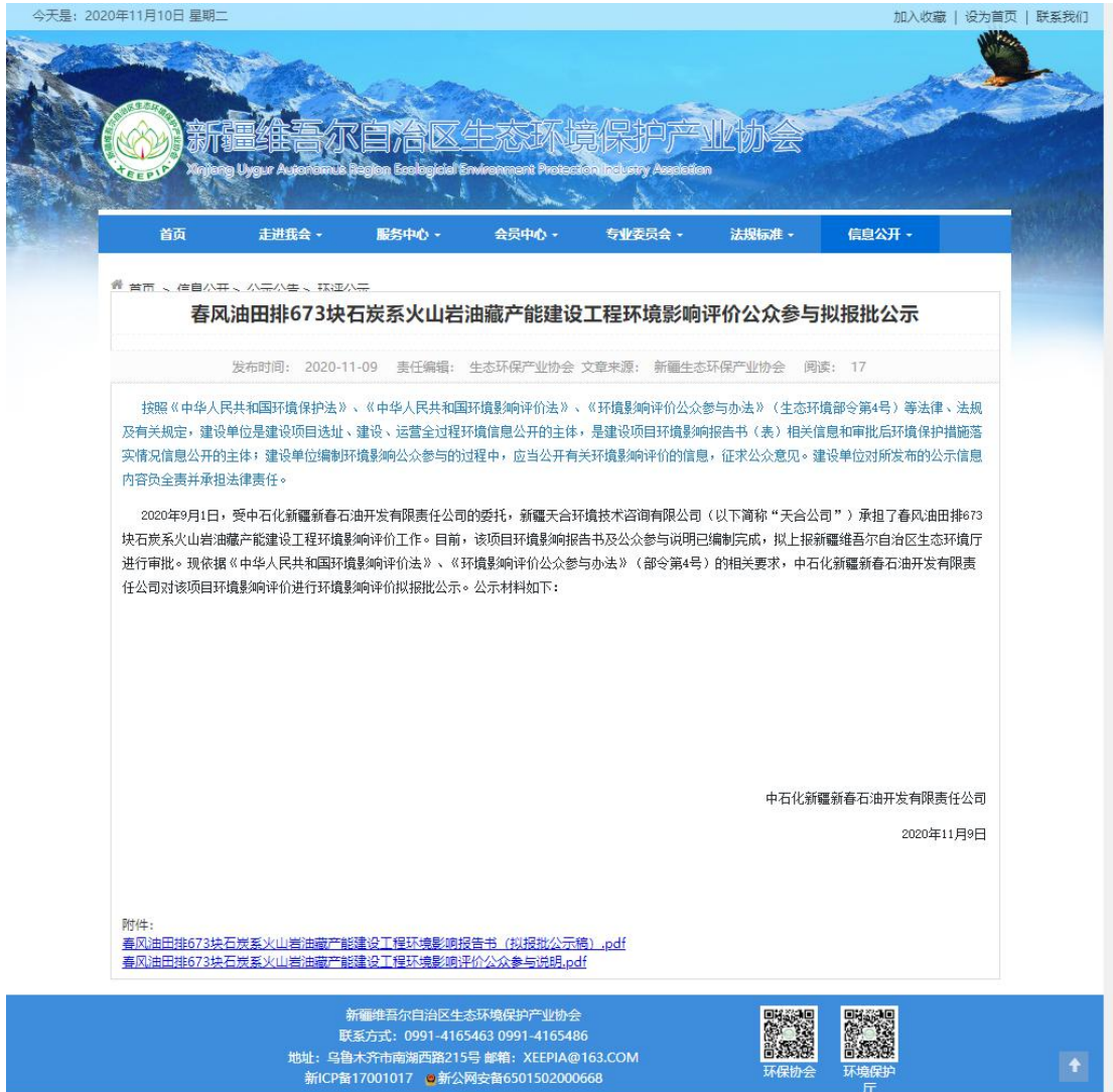
图 6.2-1 拟报批公示网页截图