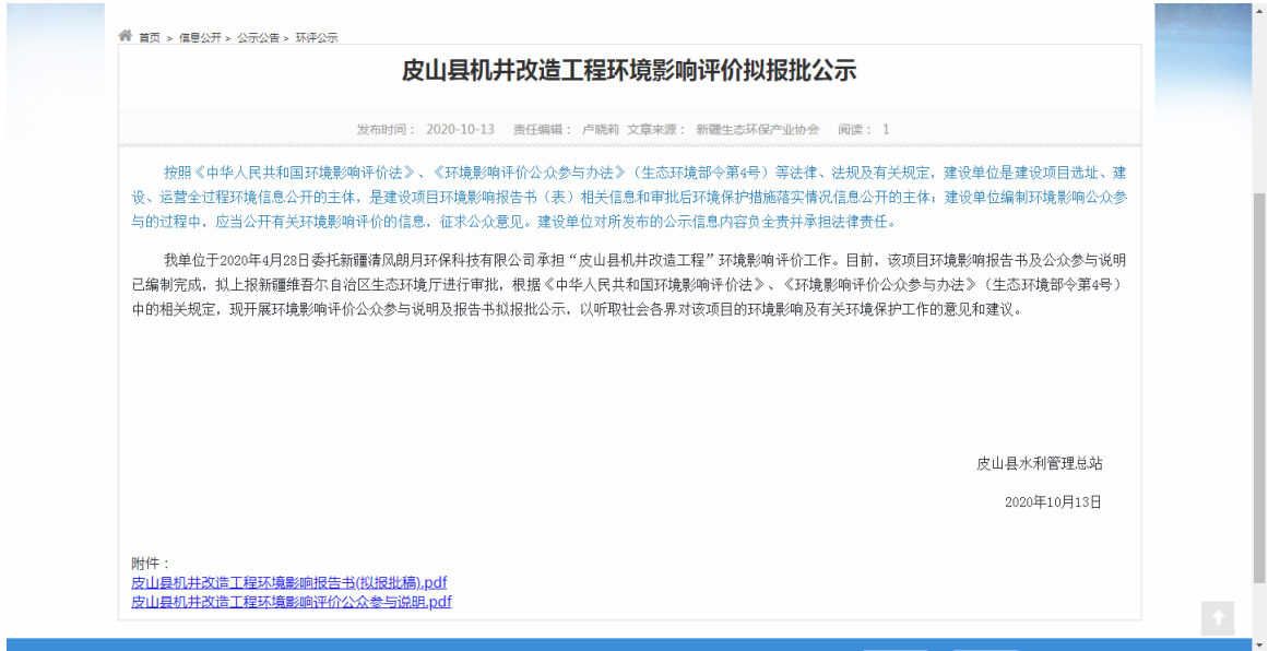
图 6.2.1 网上公示截图