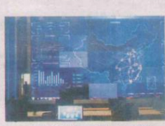
▲南京紫金山实验室，这里不仅有“高大上”的硬科技，还有很多与人们生活很近的创新。

南京是江苏加速动能转换、推动高质量发展的缩影。一大批科技创新项目正在这座城市进行，开启“小康中国升级之路”。