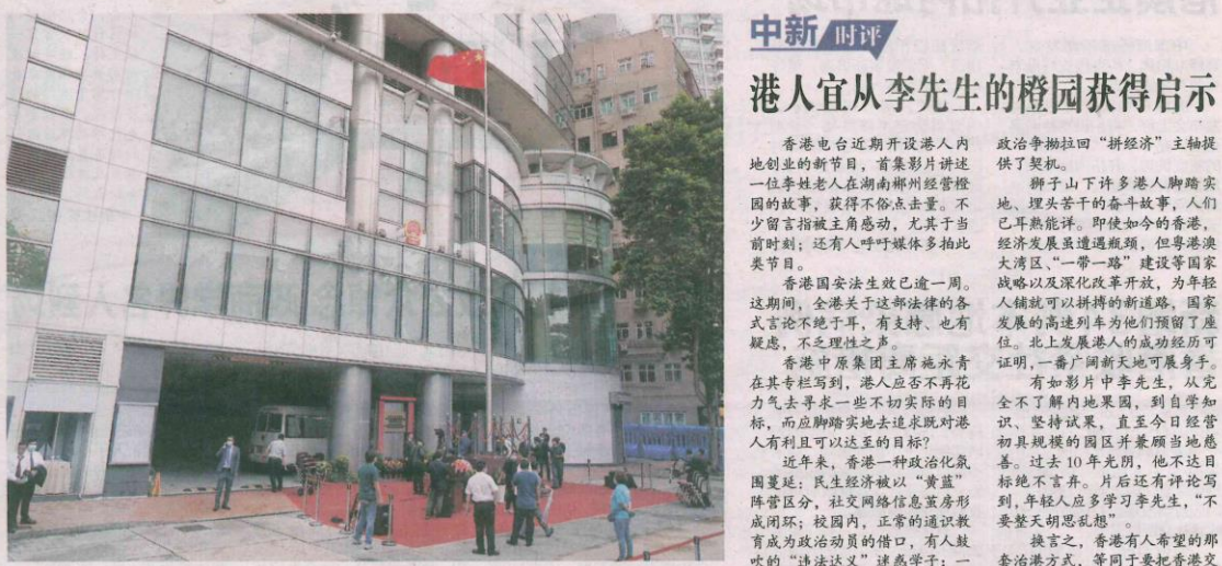
7月8日上午，中央人民政府驻香港特别行政区维护国家安全公署在香港正式揭牌。

中央人民政府驻香港特别行政区维护国家安全公署（驻港国安公署）揭牌仪式8日在港举行。9日出版的多份香港报章发表社评或时评认为，驻港国安公署挂牌并行，标志香港维护国安执行机制基本形成，有关机构将各司其责通力合作，共同担当好在香港维护国安的重任。 香港《文汇报》社评认为，驻港国安公署挂牌并行，标志香港国安法落地实施迈出重要一步，香港维护国安的执行机制基本形成，香港告别国家安全不设防的历史。 社评说，维护国家安全是中央事权，中央政府在充分信任、积极发挥特区在维护国安中的作用的同时，依法设立中央驻港国安公署，构成健全的国安法执行机制和机构。驻港国安公署的正式成立，是香港建立健全维护国家安全法律制度和执行机制的重大里程碑。驻港国安公署成立运行，是中央对香港行使全面管治权，对维护国家安全负有最大最终责任的重要体现。 香港《大公报》社评认为，香港国安法于七前夕颁布落实，其后香港国安委成立并举行首次会议，至9日驻港国安公署揭幕，短短一周之内相关机构及人员全部到位就职，效率惊人。香港从此有了维护国安健全的执行机制，不再是“无推鸡笼”。近来反对派出面人物不是“割席”就是退出政坛，或者逃亡，黑暴力明显收敛，社会大致回归正轨，足证香港国安法起到立竿见影之效，“香港安全使者”当之无愧。 《香港商报》发表时评说，未来中央和香港维护国家安全机构各司其职，依法按照职责分工和案件管辖划分，各自开展执法、司法活动，又通力合作，形成互补、协作、配合关系，共同构建香港维护国家安全的保护网，将会更好保障多数港人的合法权利和自由，促进香港繁荣稳定。 中新社香港电