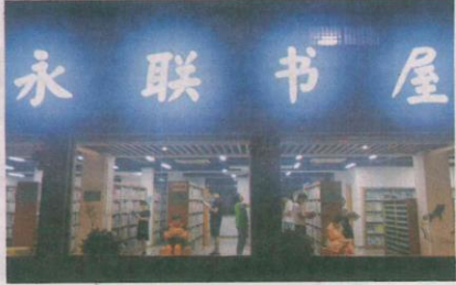
▲6月12日，张家港永联村24小时图书馆内，村民们在此看书读报。从城市到乡村，张家港40多座24小时图书馆驿站静候市民前来夜读。