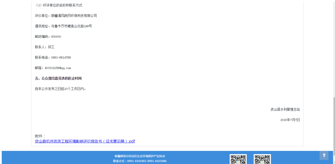
图 3.2.1 征求意见稿信息网络公开截图