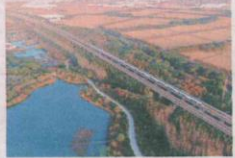
▲清晨，高铁列车穿行在昆山天福国家湿地公园美丽晨光中。

昆山高新区经济发展局局长朱振刚在介绍智谷小镇的建设布局时表示，智谷小镇将为人打打造集科创、生活、娱乐为一体的舒适环境。