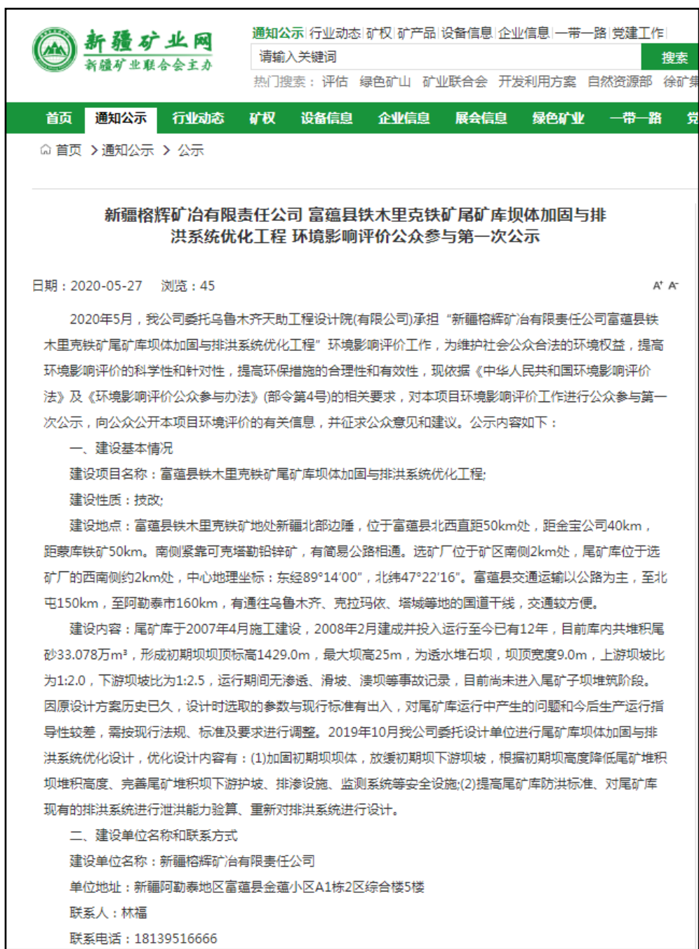
图 1 本项目第一次网络公示截图