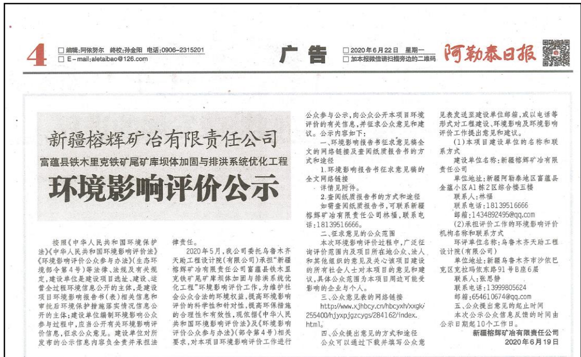
图3 第一次报纸公示——阿勒泰日报公示页面