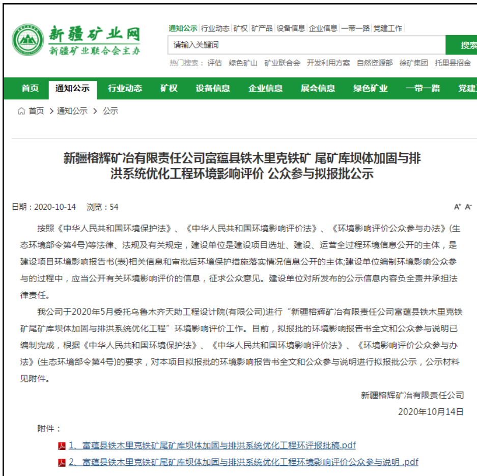
图6 报批前网络公示

项目选取新疆矿业网站（新疆矿业联合会主办）进行环境影响报告书及公众参与说明拟报批前公开，符合《环境影响评价公众参与办法》中提到的“建设项目所在地公共媒体网站”，网站媒体选取合理可行。