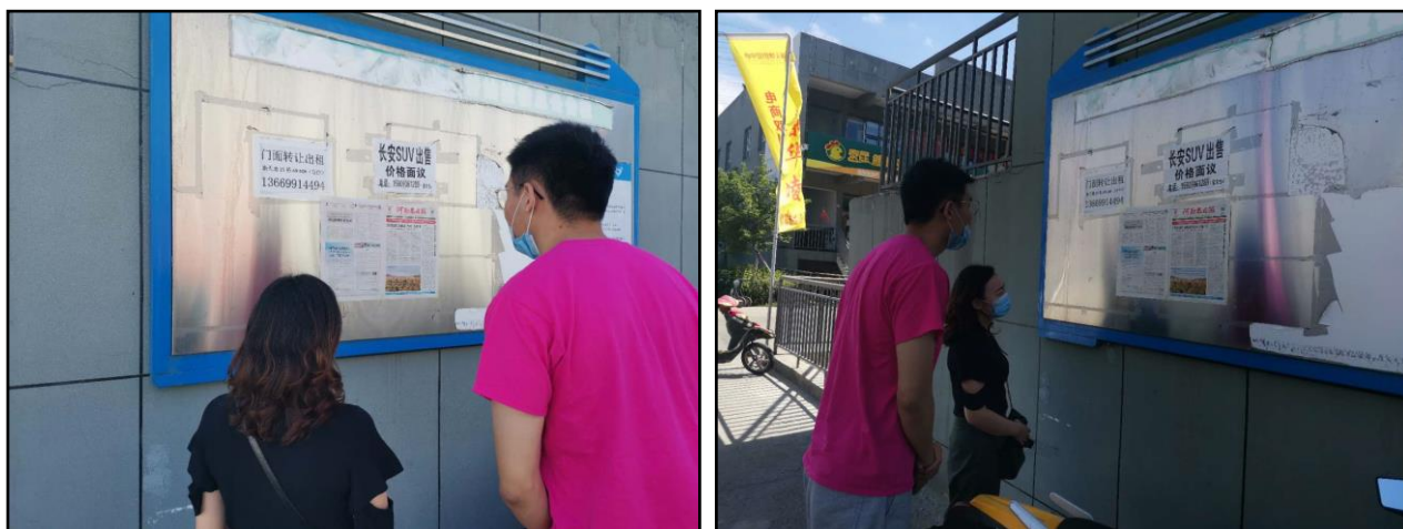
图 5 本项目张贴公告照片