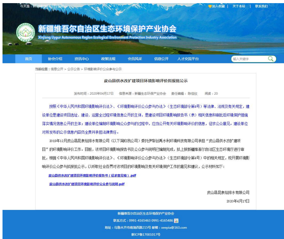
图6 拟报批公示网络截图

公开网站为新疆维吾尔自治区生态环境保护产业协会网站( http://www.xjhbcy.cn/hbcyxh/xxgk/255400/hjyxpjgzcygs/335505/index.html ),该网站在新疆地区有较大的知名度,访问流量较大,上传并公开了项目环境影响报告书全本及公众参与说明,选择该网站进行公示符合《环境影响评价公众参与办法》要求。