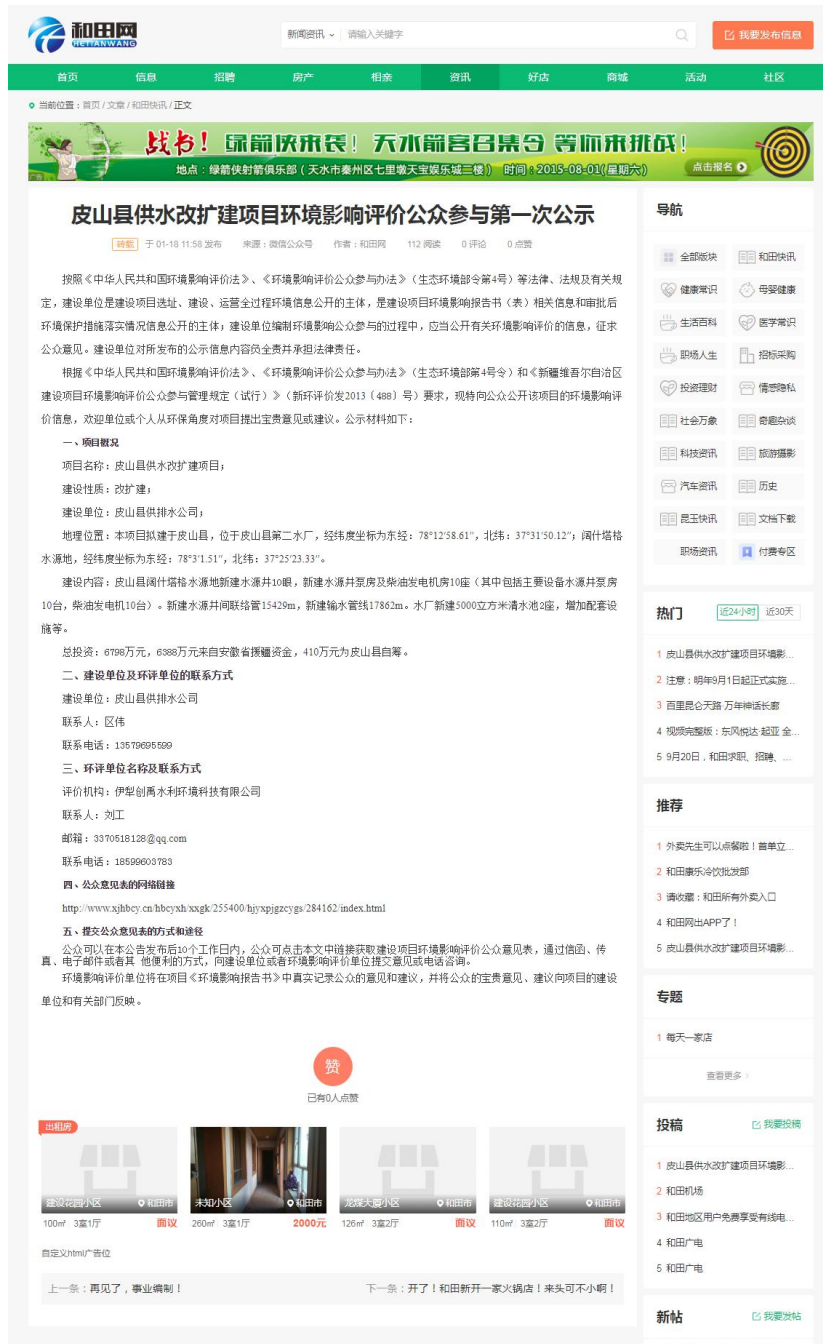
图 1 第一次网络公示截图