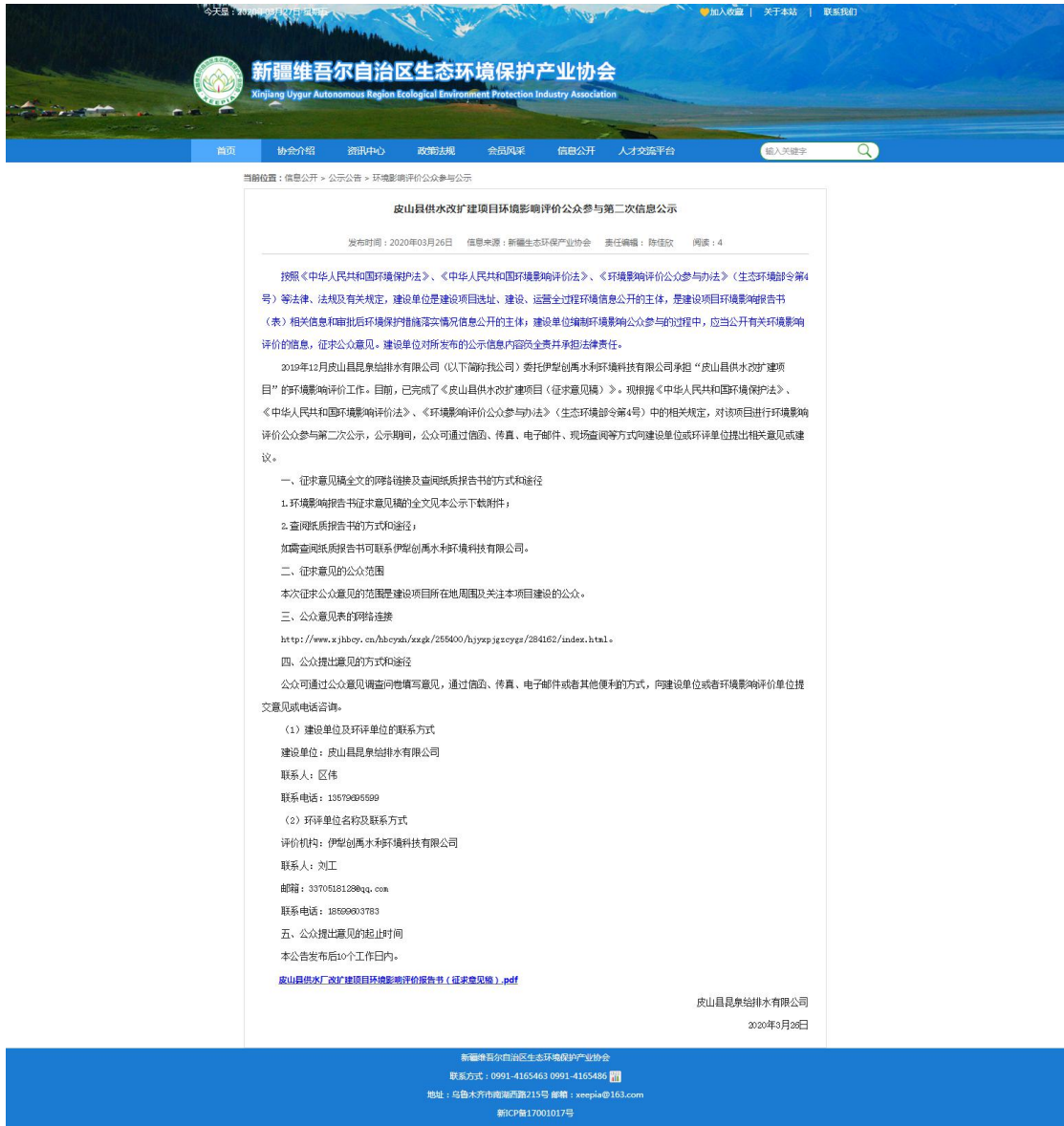
图2 第二次网络公示截图(新疆维吾尔自治区生态环境保护产业协会网站)