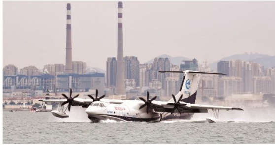
7月26日,水陆两栖飞机AG600在团岛滑行。